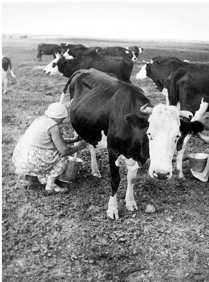
Стрёканьё коровы. Кацкая доярушка, как и положено, доит корову с правой стороны. д. Владышино. 1970-е годы.

начинают выпадать зубы, а вместе с ними и пропадать сила. Лошадь вновь переводят на лёгкие работы, и она сможет прослужить ещё лет десять – до последнего своего часа.