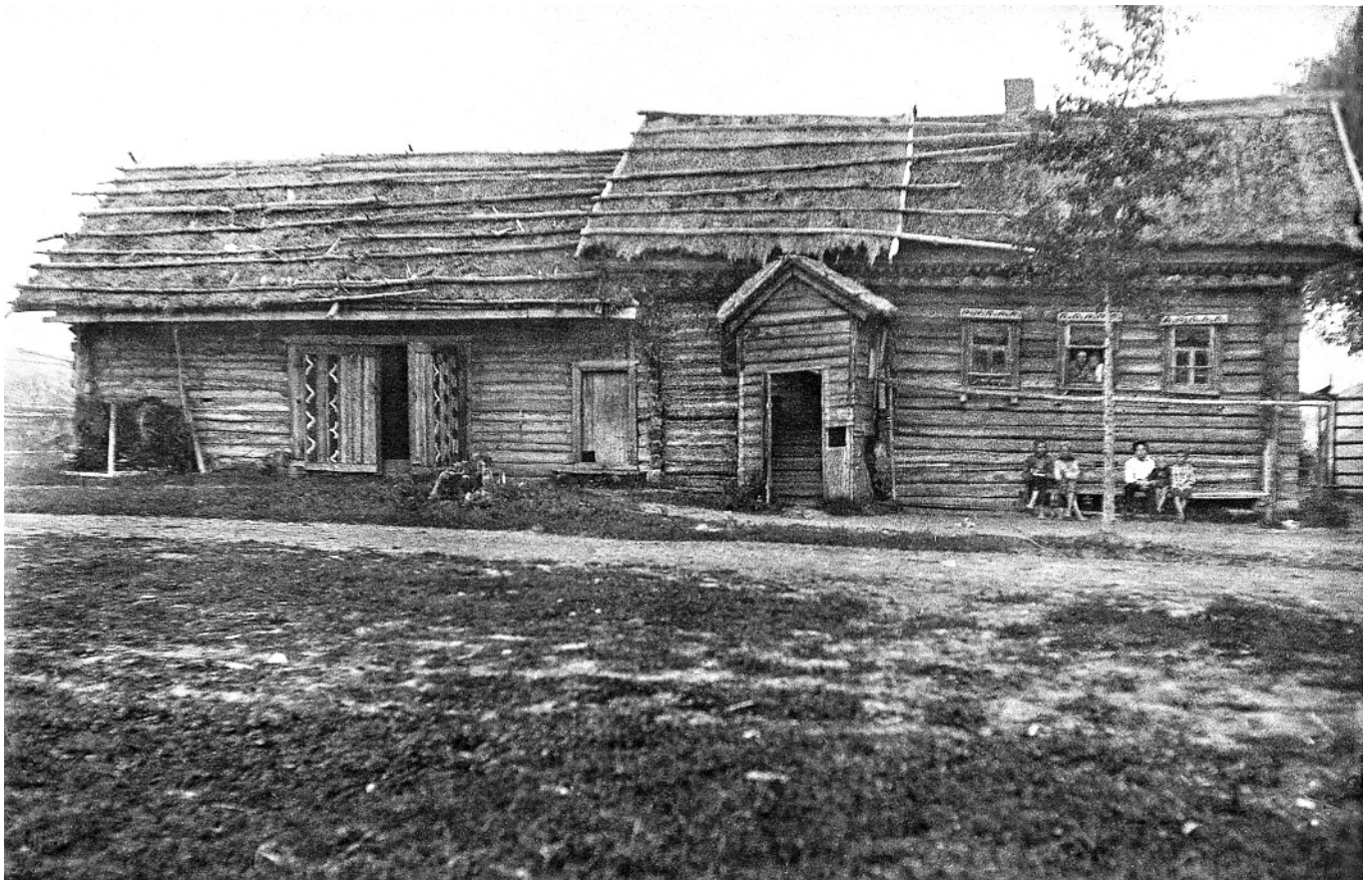
Изва со двором под соломенной крышей. д. Кузьмадемьянка, август 1936 года.

Выражение «красный угол» знакомо, почитай , каждому: так в русских деревнях называется угол с иконами, убранными полотенцами. Кстати, учёные считают, что красный угол существовал и до принятия христианства