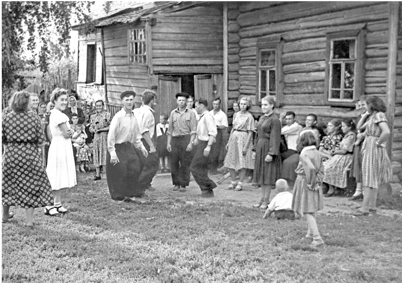
Кадрель в Ильин день. д. Киндяково, 2 августа около 1957 года.