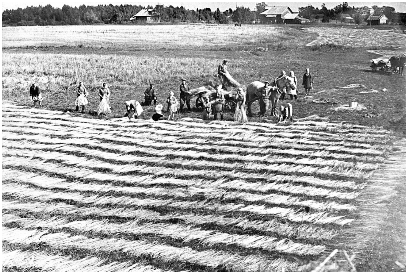
На стлице. Расстилка льняной тресты на луг считается южнорусским способом обработки льна. с. Юрьевское, 1960-70-е годы.

Для этого брали повесьмо (пучок) льну и разминали его на мяднице – она могла быть как ручная, так и конная. Омятой повесьмо подсушивали в риге и трёпальцам трёпали – соскабливали остатки кос-