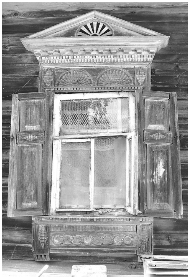
Вырѣза. д. Нефѣдово, 19 июня 2007 года.