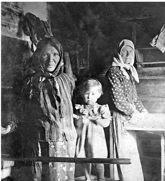
В каморке. д. Платуново, рубеж XIX-XX веков.

сказать, в ней две печи, а не одна! Сбоку пристраивают подтопок , которой курят для ради тепляди в перерывах между топкой основной печи. Правда, в последнее время подтопкам кацкари предпочитают небольшие железные печки-буржуйки (а то и вовсе устраивают паровое отопление).