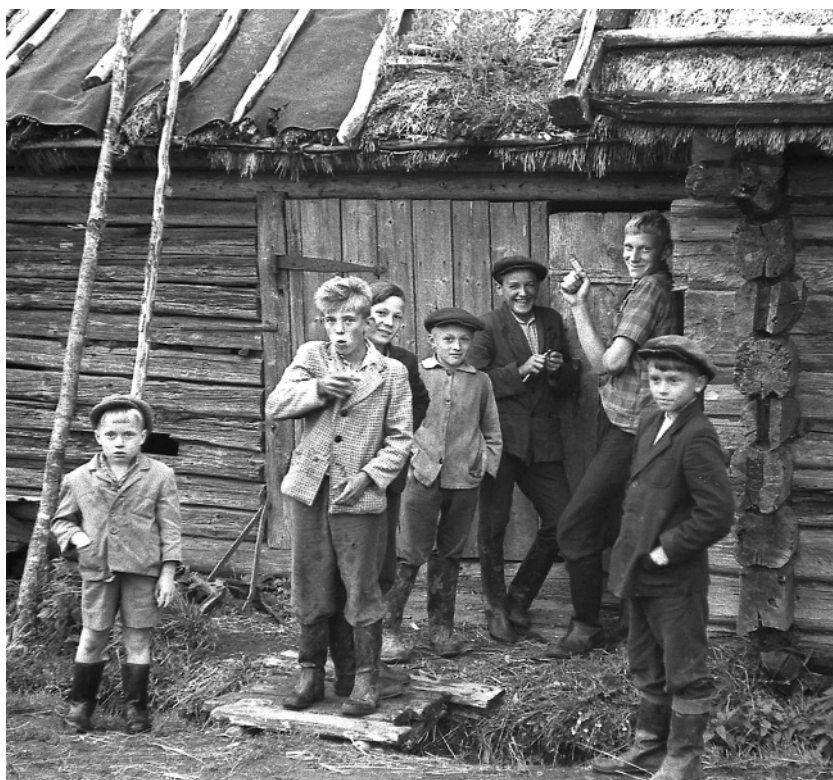
Парнишки. Самой популярной игрой для мальчишек XX века была игра «в войну», или «в войнушку». д. Комарово, 1963-64 годы.

Зайцы – игра, похожая на современные салки. Участники делятся на три команды: зайцы (самые старшие), охотники (те, что помладше) и собаки (мальчиши).