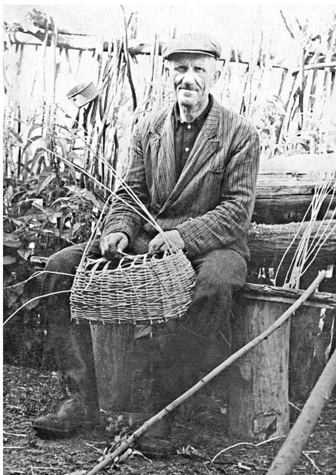
Плётеньё на берухи. д. Платуново, 1950-е годы.