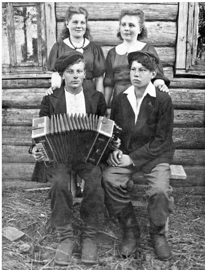
Перед биседой. д. Козлово, 21 мая 1947 года.