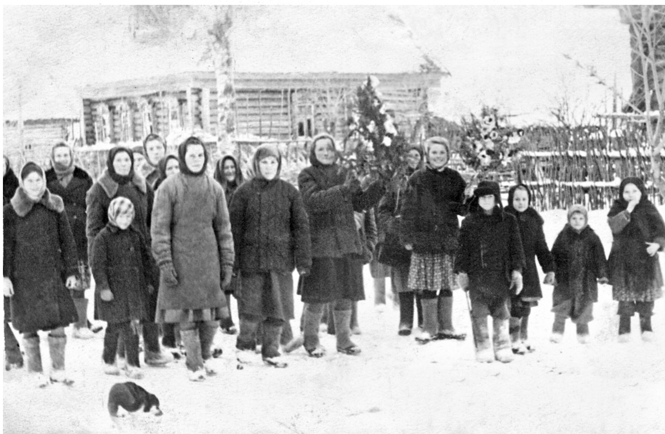
Со сваребной красю. д. Дьяконовка, 25 ноября 1956 года.