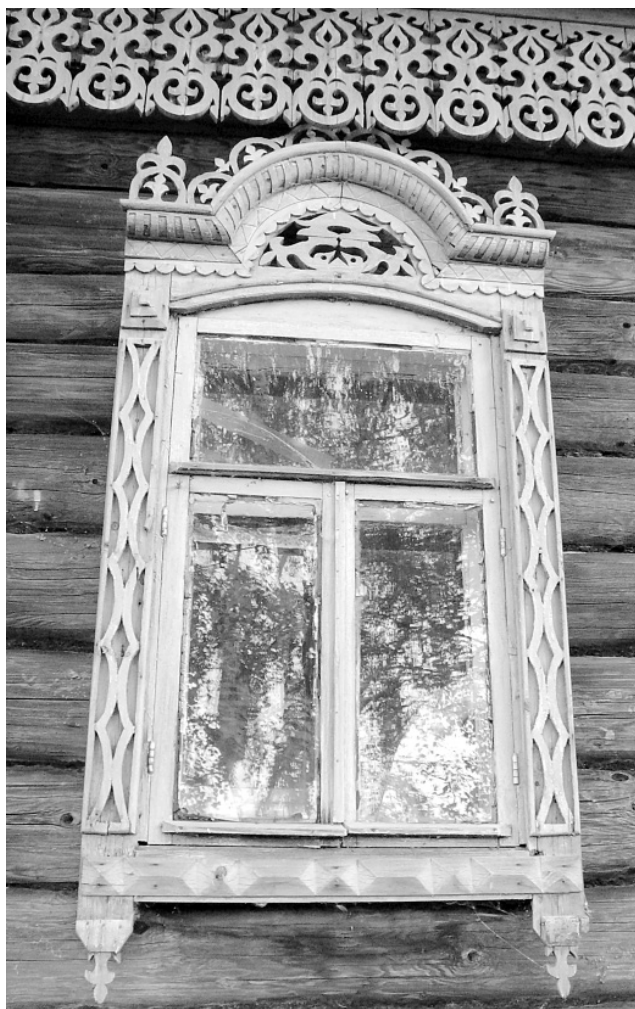
Вырѣза. с. Хороброво, 10 августа 2007 года.