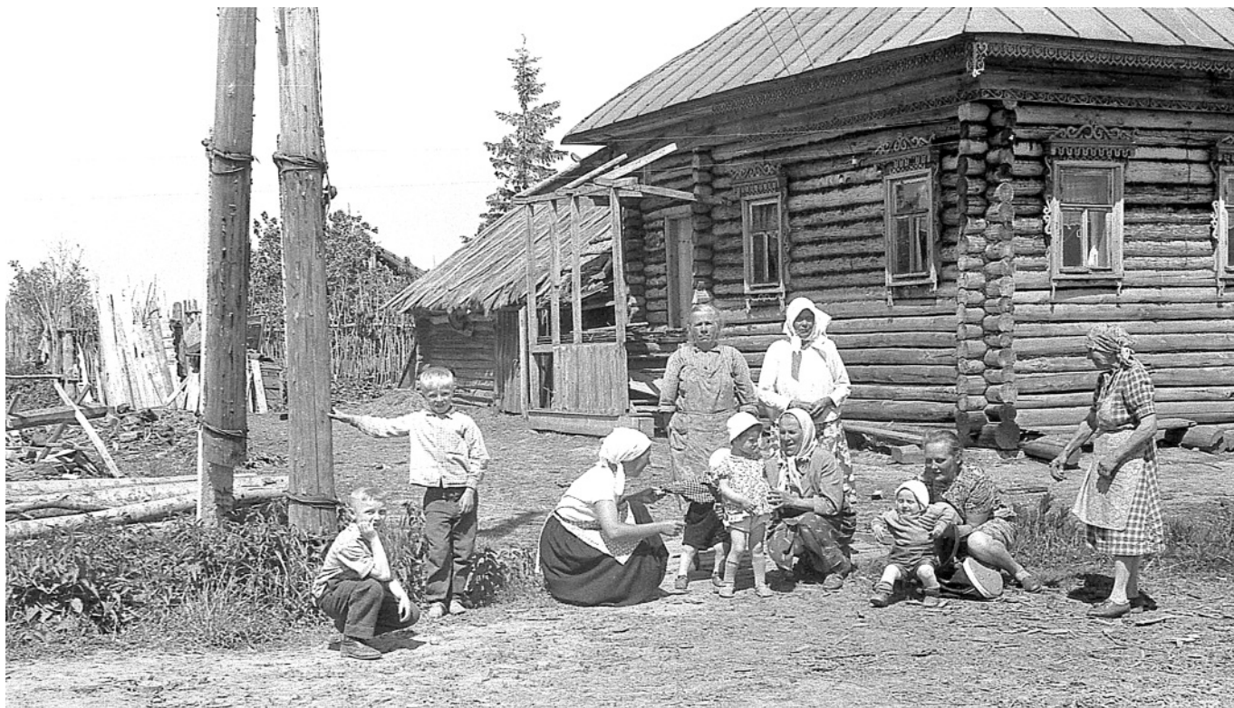
Кацкари подростают! Женщины с детьми на деревенской улице. д. Комарово, 1963-64 годы.

голомёно – большое количество чего-либо;