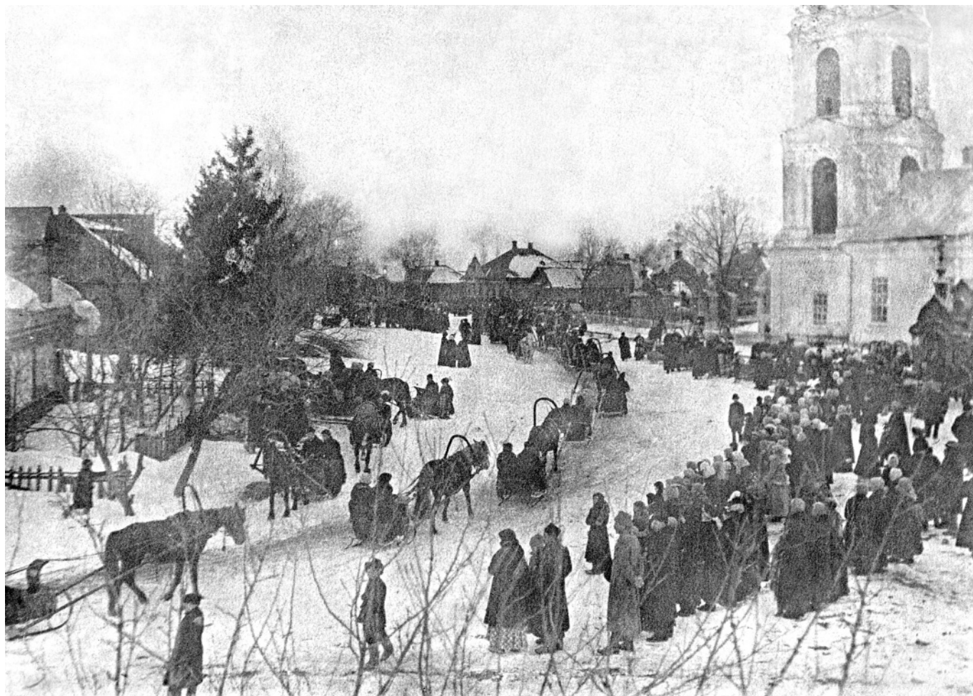
Масленишной каток. с. Ордино, около 1918 года.

Мясовед , продолжающийся с 19 января до Маслён -