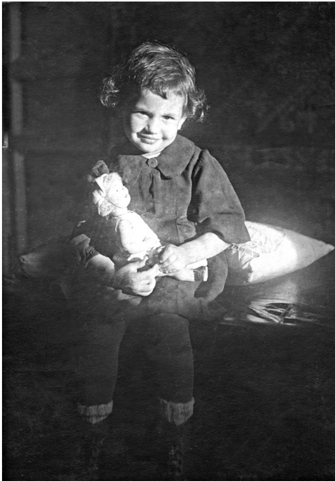
С торговой лядькёй . Покупную куклу называли обычно Кате́й, играли в неё до замужества, а берегли всю свою жизнь. д. Владышино, 1920-30 годы.

От простодушного толкования по сути мифологической куклы я буквально остолбенела... Впервые встре-