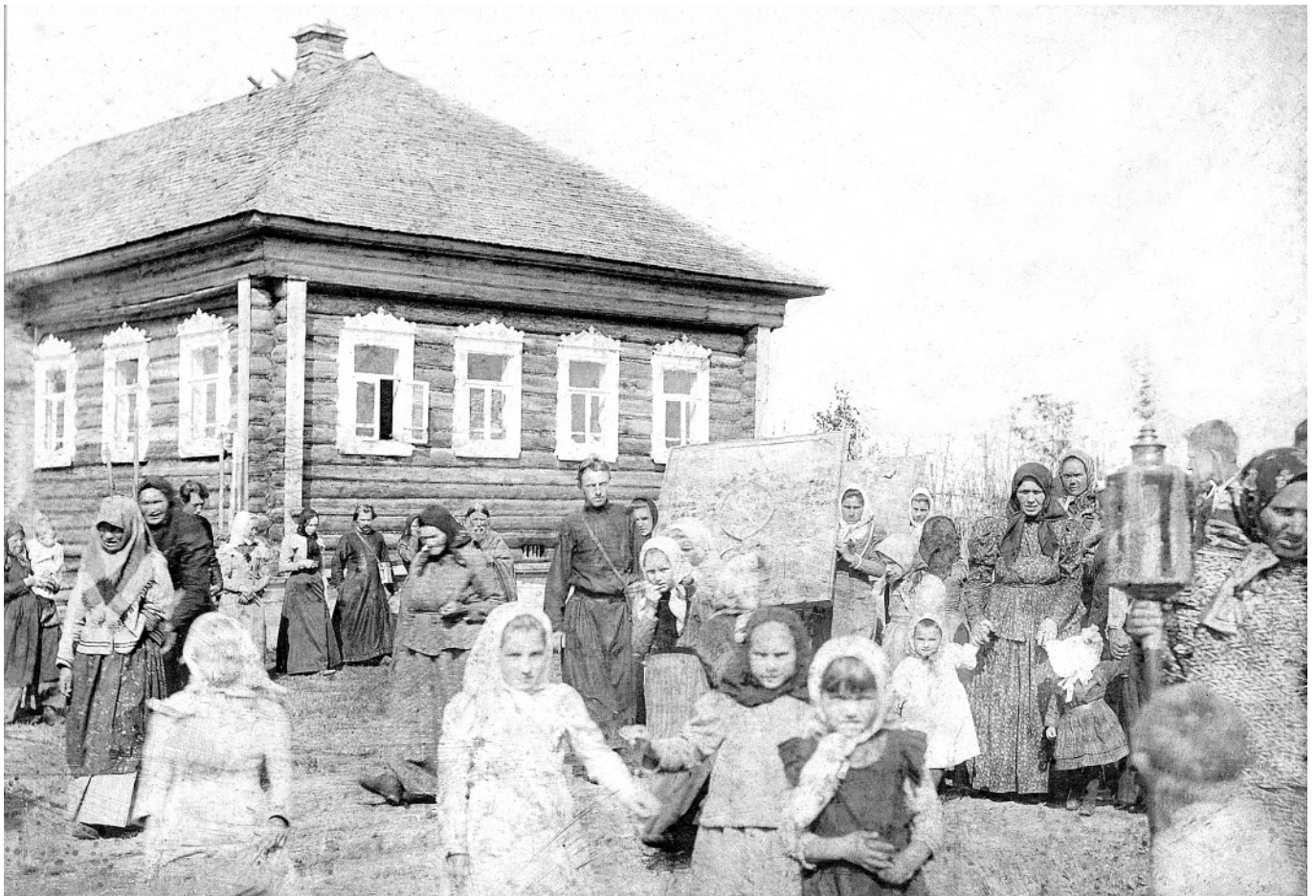
Крестный ход в обещанный праздник. д. Платуново, рубеж XIX-XX веков.

ЧОСАНКИ не были характерны для глумяных кацких праздников , их принёс в нашу жизнь окаянный XX век. Первая мировая война, гражданская, Финская, Великая Отечественная война изменили нравы людей: земляки приходили с фронта озлобленные, привычные к смерти и насилию, принося в тихую деревенскую жизнь нравы военного времени. А тут ещё раскулачивание, коллективизация, насильственное сселение маленьких деревень... Особенно распространились чосанки после Отечественной войны: тогда даже праздник не считался за праздник, если на нём кого-нибудь не убоют!