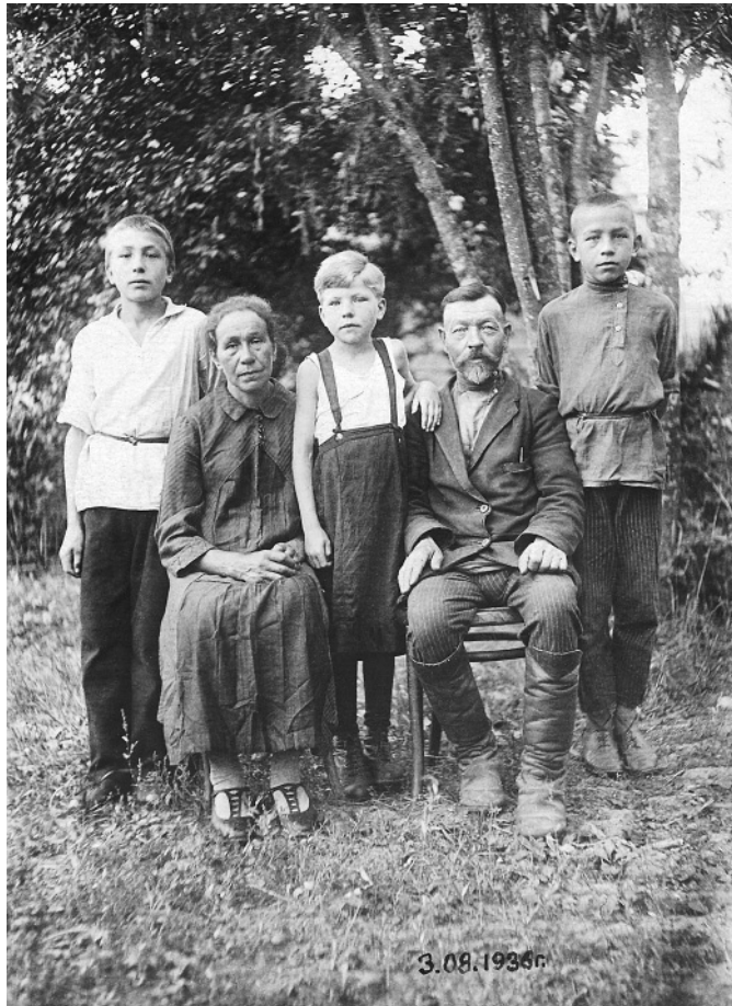
Семья Шершнёвых. Их фамилия появилась в результате ошибки сельсоветских работников: вместо «Шерстнёвы» они написали «Шершнёвы». с. Юрьевское, август 1936 года.

ИСКУССТВЕННЫЕ ФАМИЛИИ назначались свыше. Как так? Да просто!