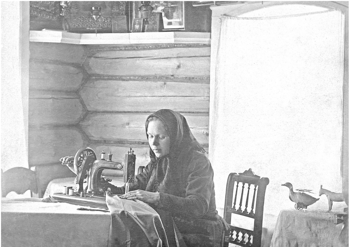
Швея. д. Платуново, 1910-е годы.

Зародилось отходничество давно – ещё в XVIII столетии, продолжалось весь XIX век, захватило начало XX-го, и, конечно, оказало громаднейшее влияние на жизнь кацкарей. Живя подолгу в городе и тем более в столице Российской империи, кацкари очень быстро перенимали городские привычки. Особенно это сказалось на манере одеваться – к началу XX-го столетия кацкий традиционный костюм оказался полностью утраченным. С оглядкой на город строились избы, покупалась мебель, но... кацкий диалект, фольклор, обычаи, мировоззрение тем не менее сохранялись. Удивительно? Но тем не менее объяснимо! Об этом поразмыслим, выполняя задание «ж» к следующему параграфу.