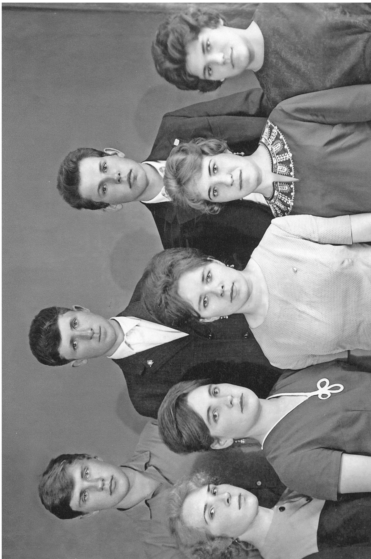
АРИСТОВО. КОМСОМОЛЫЦЫ. Май 1967 года.