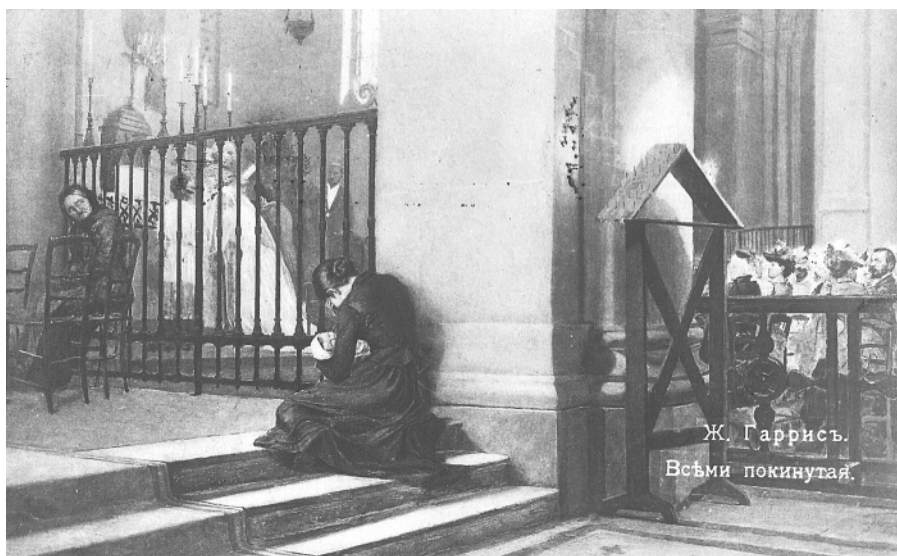
Ж. Гаррись. Всёми покинутая.

Так, в 1913 году Рождественским почтово-телеграфным отделением по 7937-ю переводам выдано денег на сумму 185316 рублей 40 копеек (в среднем по 15 тысяч рублей в месяц). Самая большая сумма выдачи