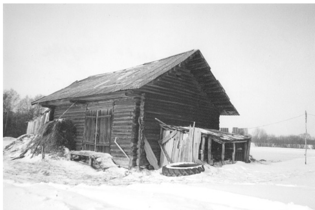
Карасёва кладовая в Юрьевском.