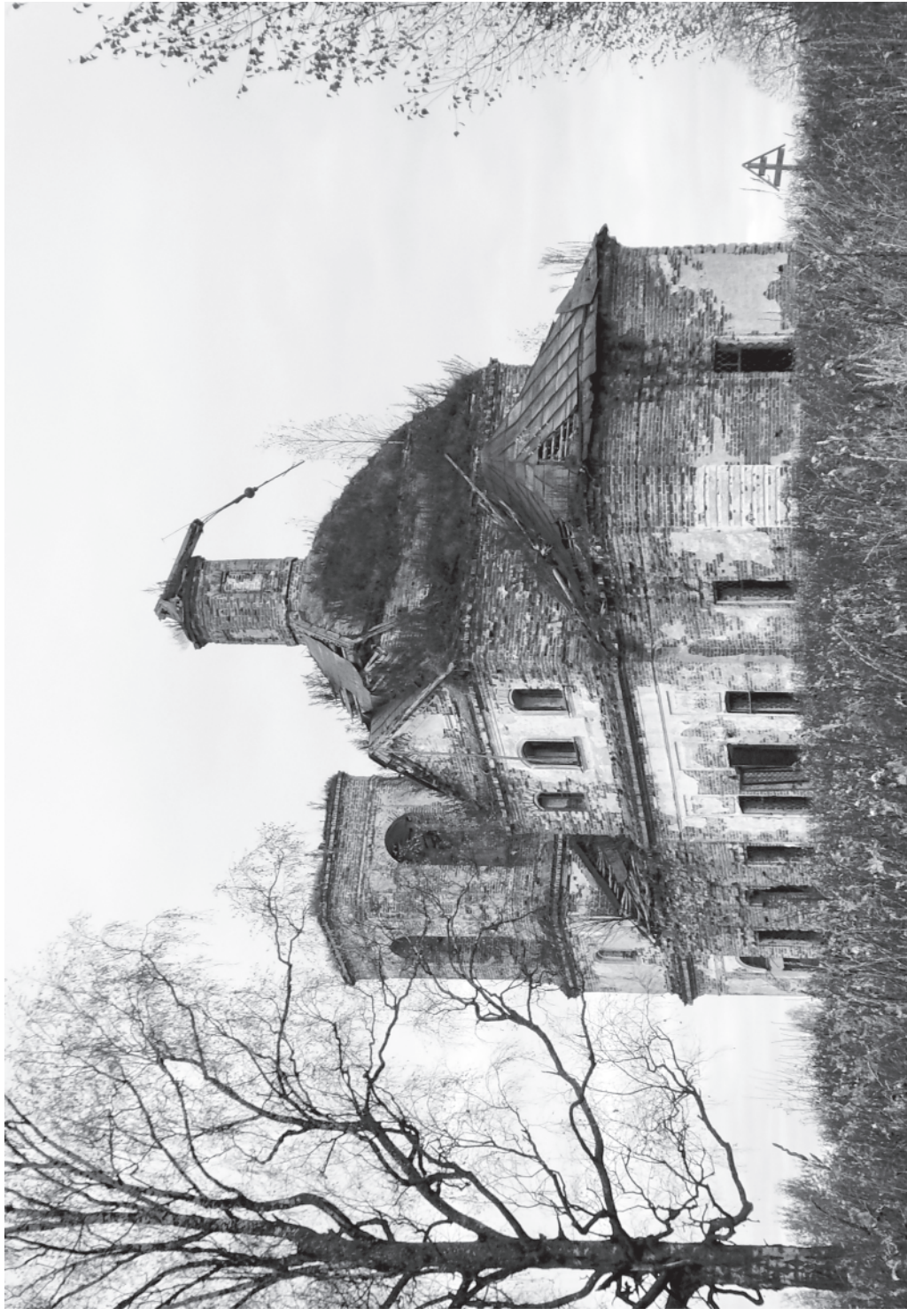
Кадка. Осень. Знаменское.