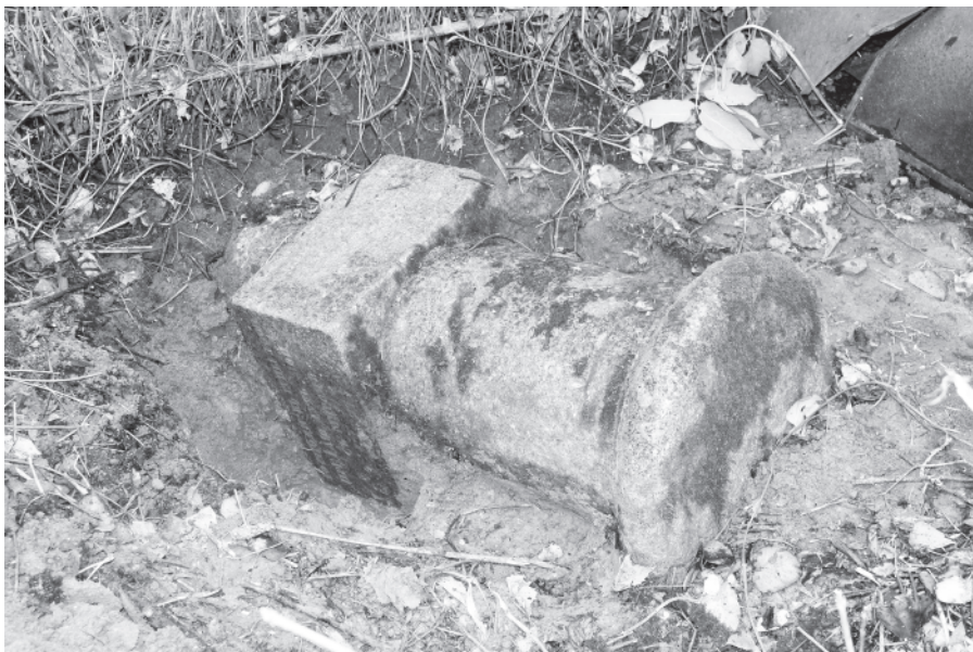
Чтобы снять замеры и прочесть эпитафии упавшее надгробие В.С. Тресневской пришлось подкопать.

Надгробия-стелы появились на кладбищах в середине XIX-го века и используются до сих пор. Они представляют собой вытянутые вертикальные надгробия с гранями трапециевидной формы, где верхняя часть несколько уже основания. Так, в нашем случае длина-ширина нижней части стелы 45,5 на 26 см, верхней