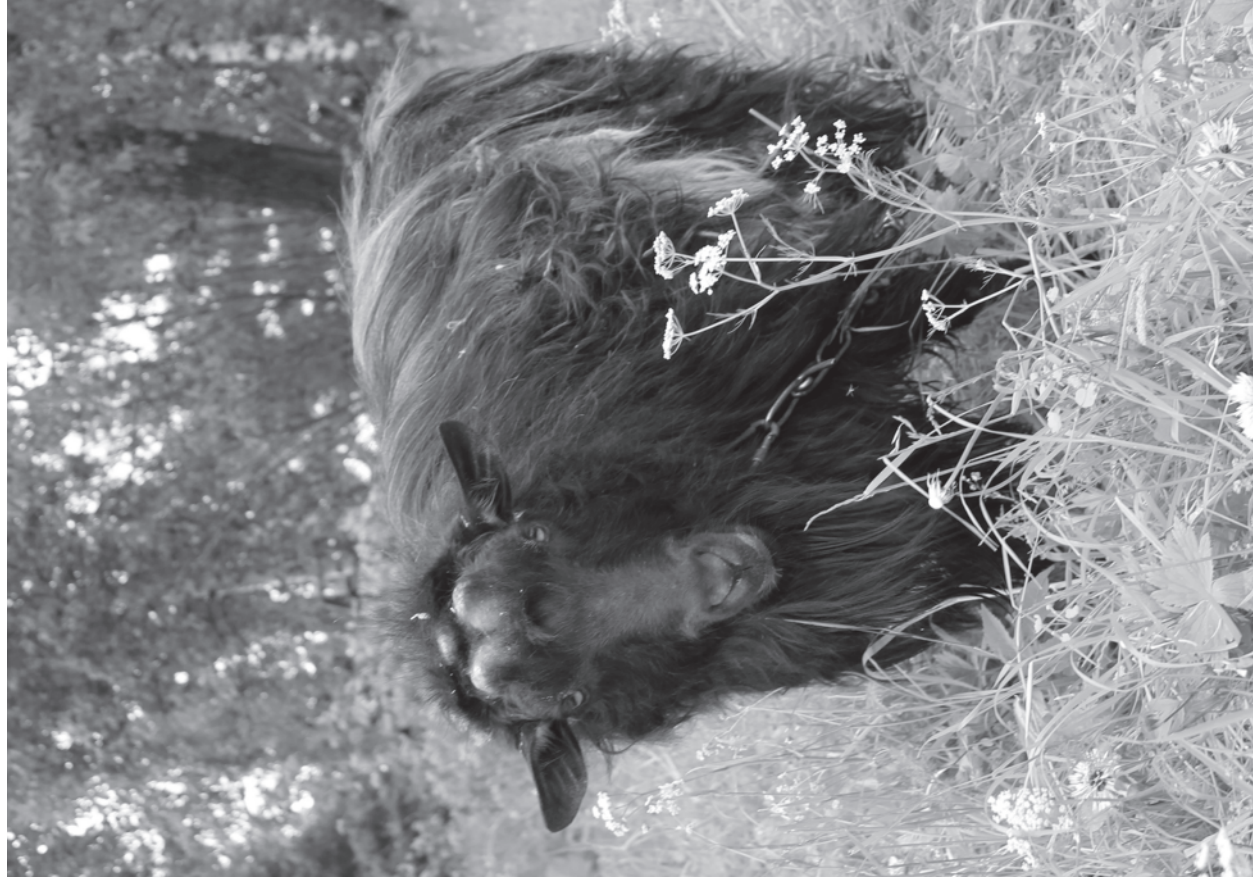
Такие вот встрéчнны! д. Аристово, 2018 год.

Электронная почта: temnyatkin.s@mail.ru Приходите и приезжайте, будем рады!