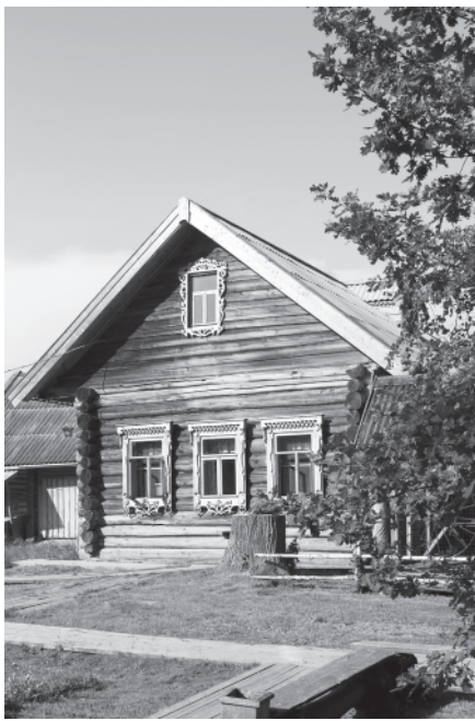
Изда Кочневых теперь часть Этнографического музея кацкарей.

Дошла очередь до вальсов. Зазвучали «Амурские волны». Перед