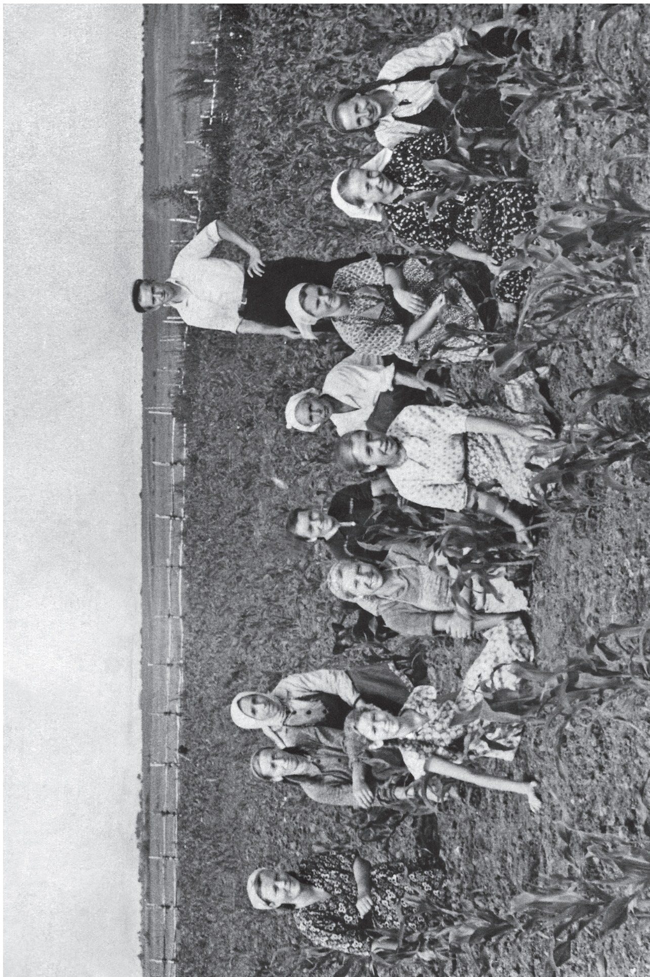
ЮРЬЕВСКОЕ. «КУКУРУЗНИКИ». Июль 1958 года.