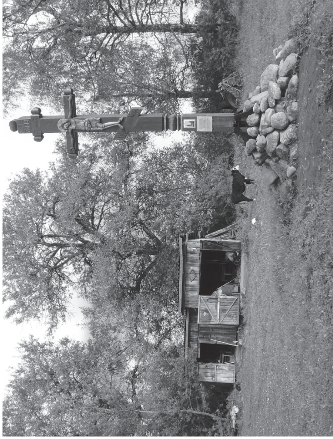
Кадка. Осень. Юрьевское.