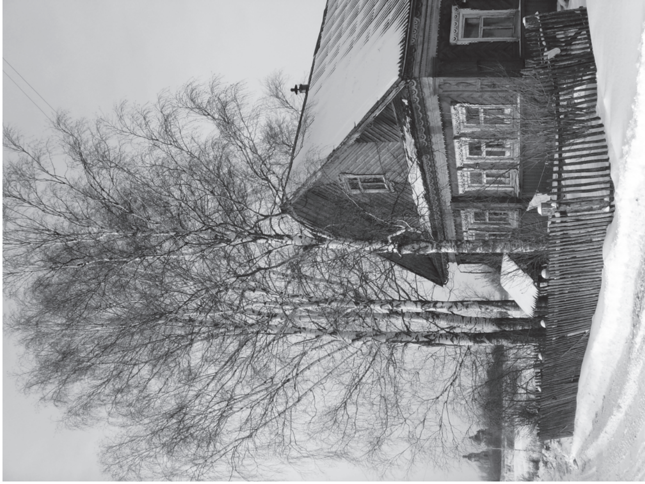
В деревне Парфёнове зима...