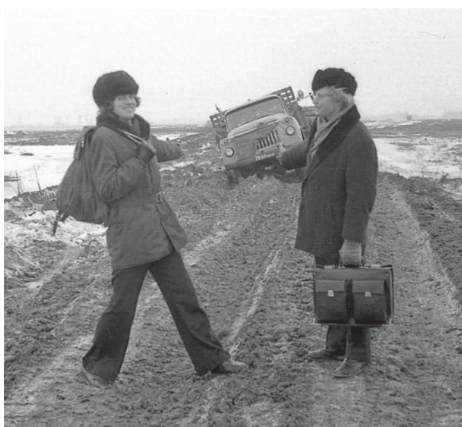
Бездорожье – ещё один бич российских деревень. Эх, сколько же молодёжи в своё время поехало в города по этому-то бездорожью... д. Мартыново, рубеж 1960-1970 годов.

Снимок из семейного собрания Знамовых, д. Мартыново