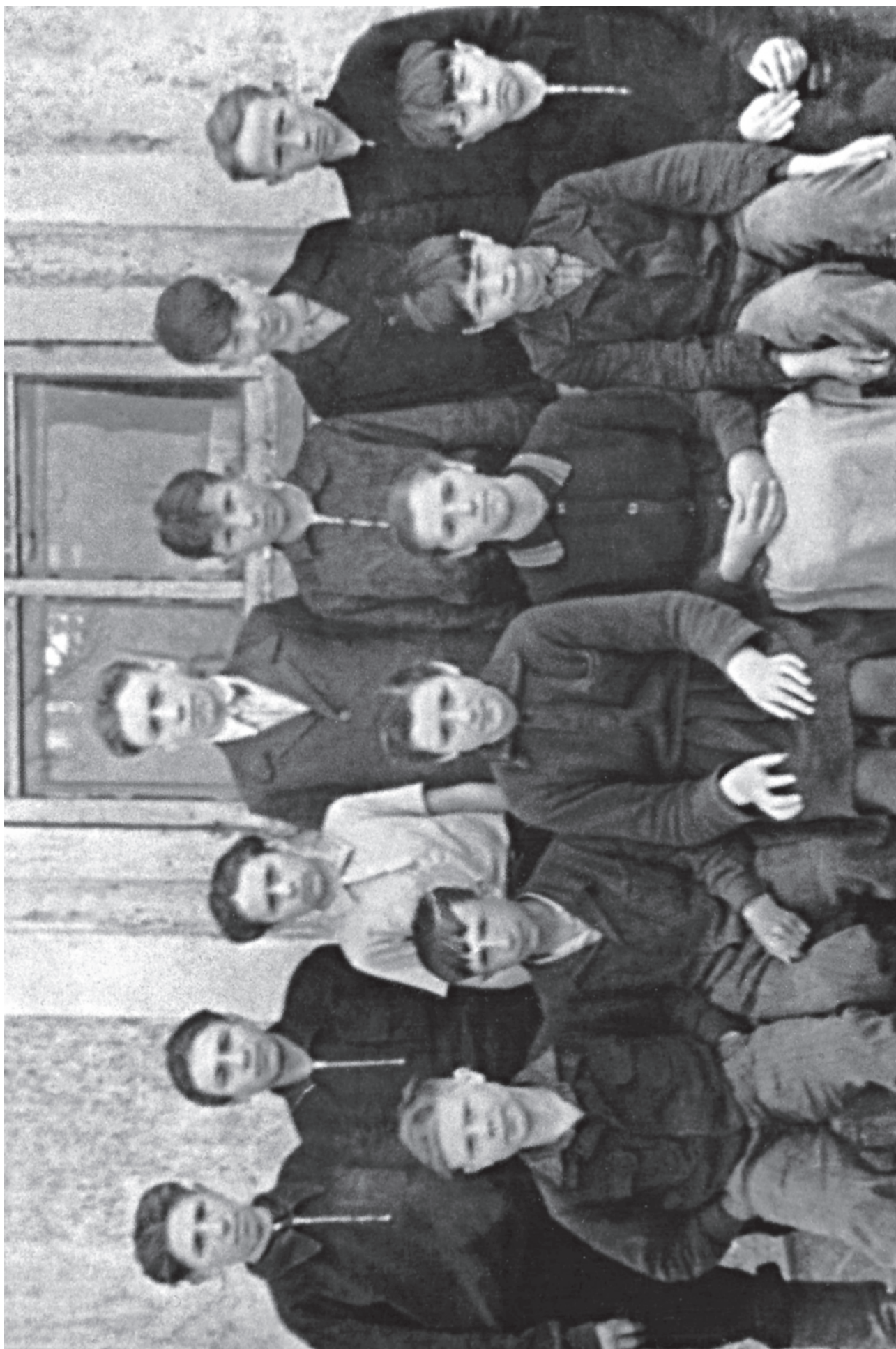
НЕФЕДЬЕВО. ВЫПУСКНИКИ. 1958-1959 годы