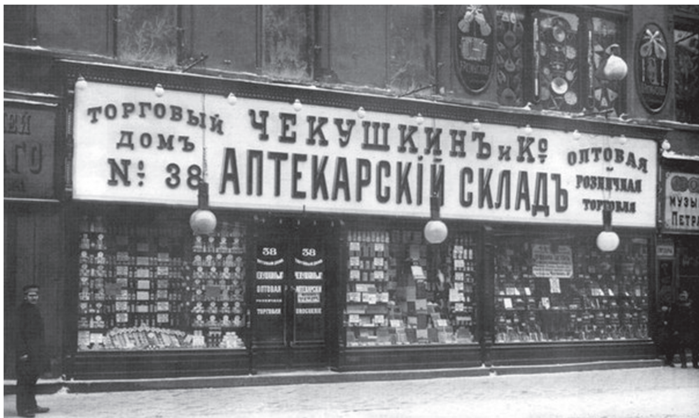
Аптекарский склад и магазин аптекарских, косметических и химических товаров торгового дома «Чекушкин и К°». Санкт-Петербург, улица Садовая, дом 38. 1900 год.