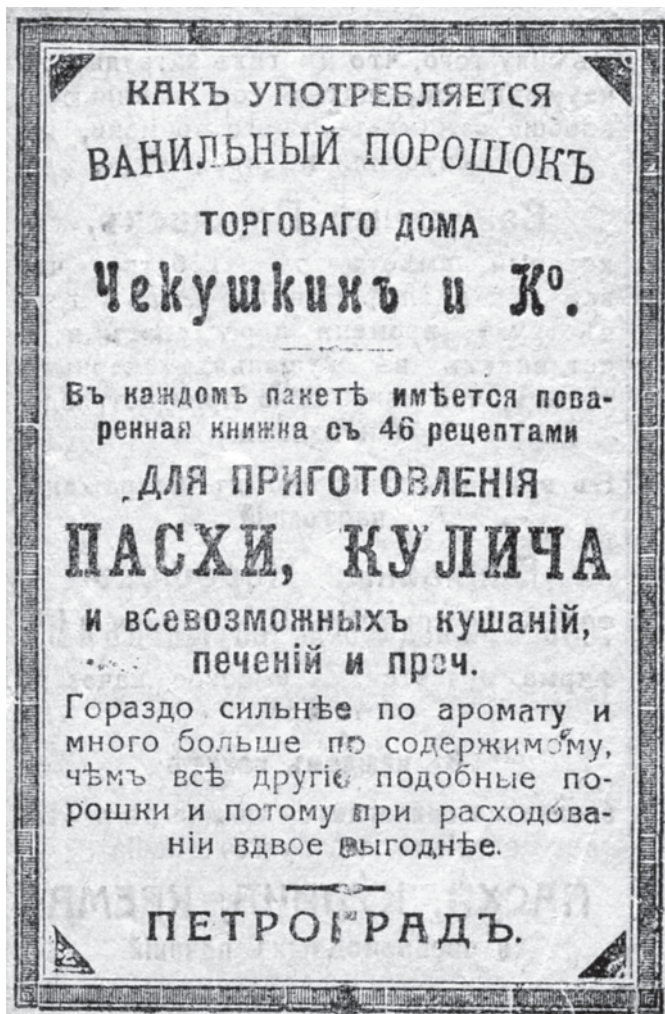
Страничка из рекламной брошюры фирмы «Чекушкин и К°». Из собрания Этнографического музея кацкарей

стерстве Внутренних Дел) служили благодарственный молебен в церкви Общества благотворения в память 19 февраля 1861 года (Тамбовская улица, дом 16) перед образом Спаса Нерукотворного за преуспеяние Общества. В 1914 году по постановлению общего собрания пожертвовали в Верховный Совет Её Императорского Величества Государыни Императрицы Александры Фёдоровны на дело удовлетворения нужд семейств воинов, сражающихся за Родину, 1000 рублей 33) .