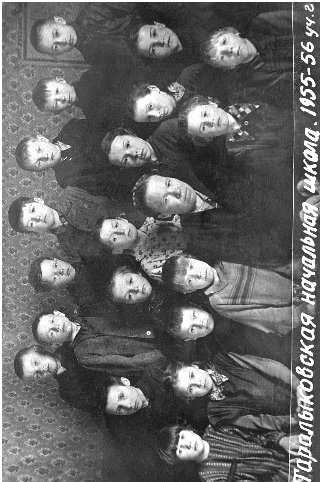
ТАРАЛЫКОВО. УЧЕНИКИ. 1955-56 учебный год.