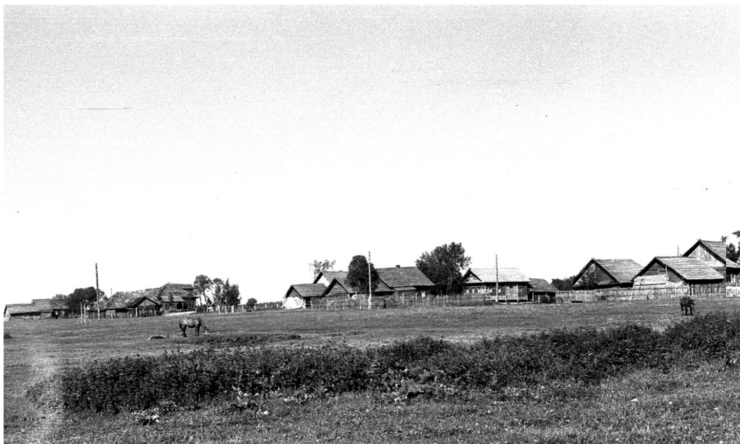
Деревня в Верхней Кадке, 1963-1964 годы. Владельцы фотографии сомневаются: Яксаево это или Комарово?