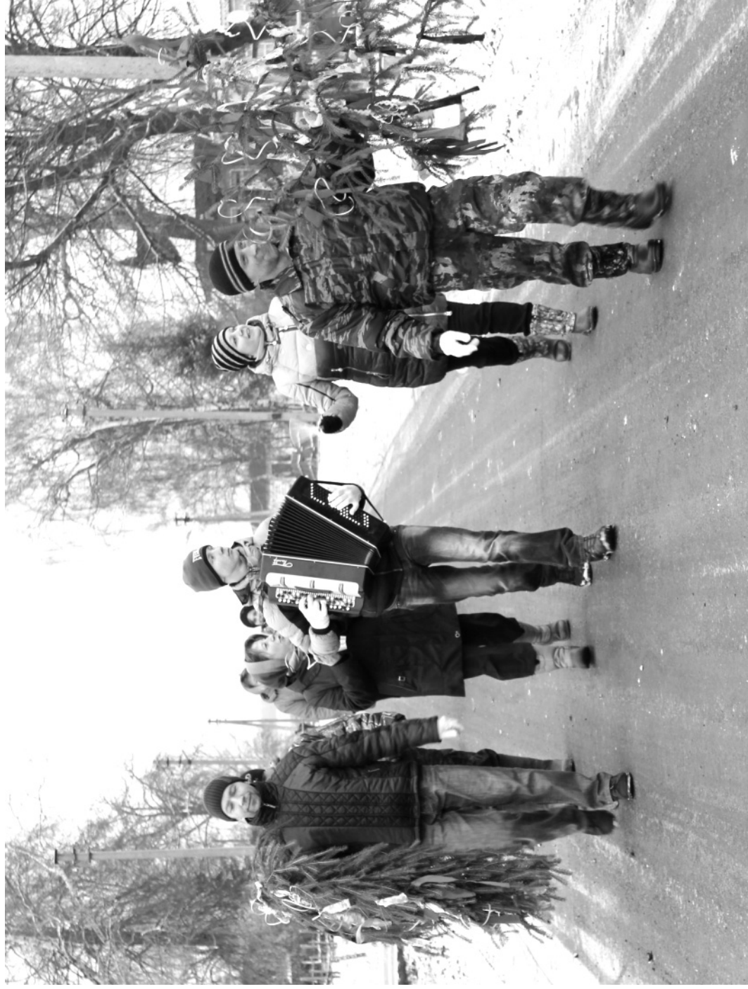
Кадка. Осень. Мартыново.