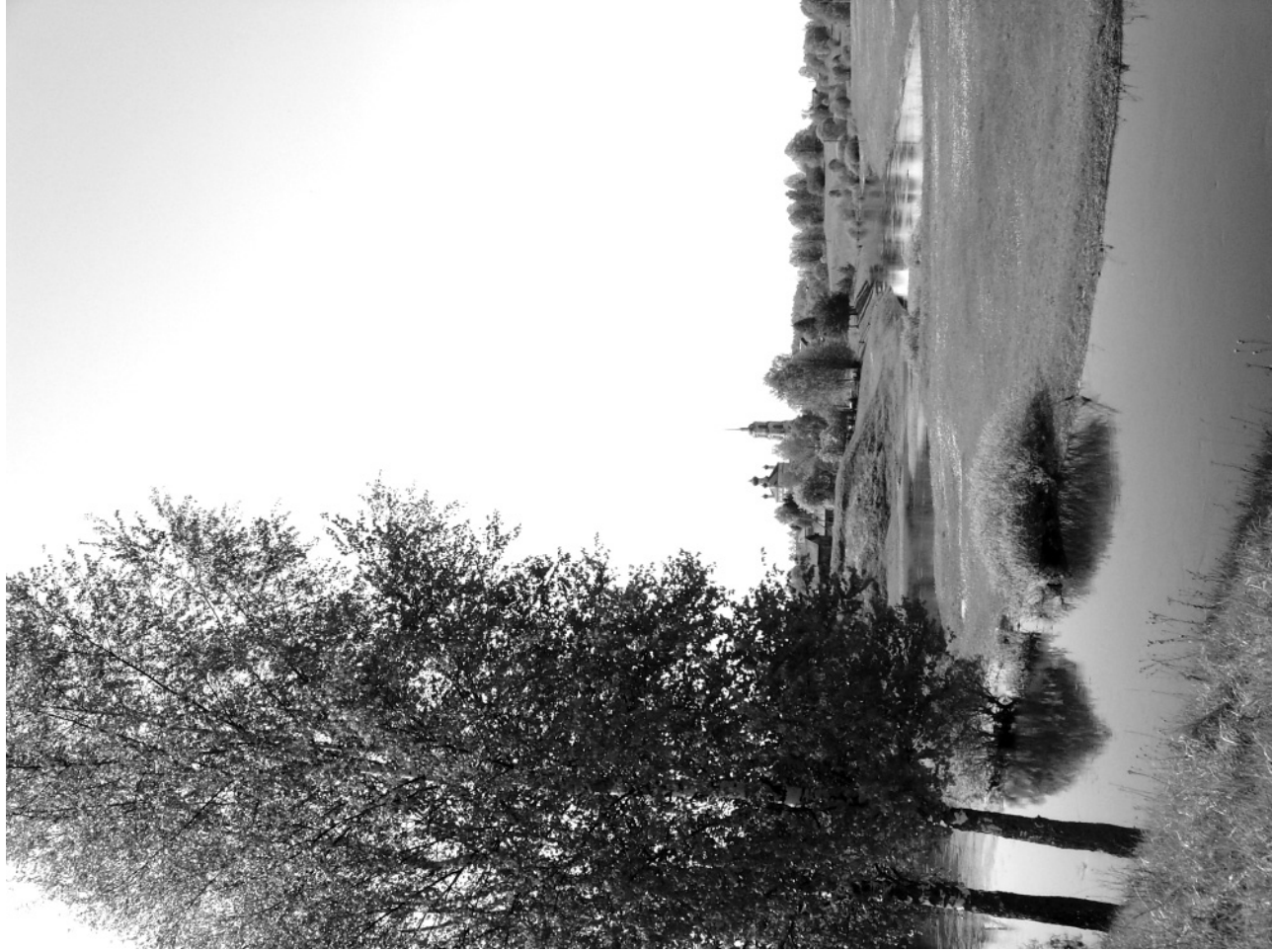
Май в окрестностях села Ордина.