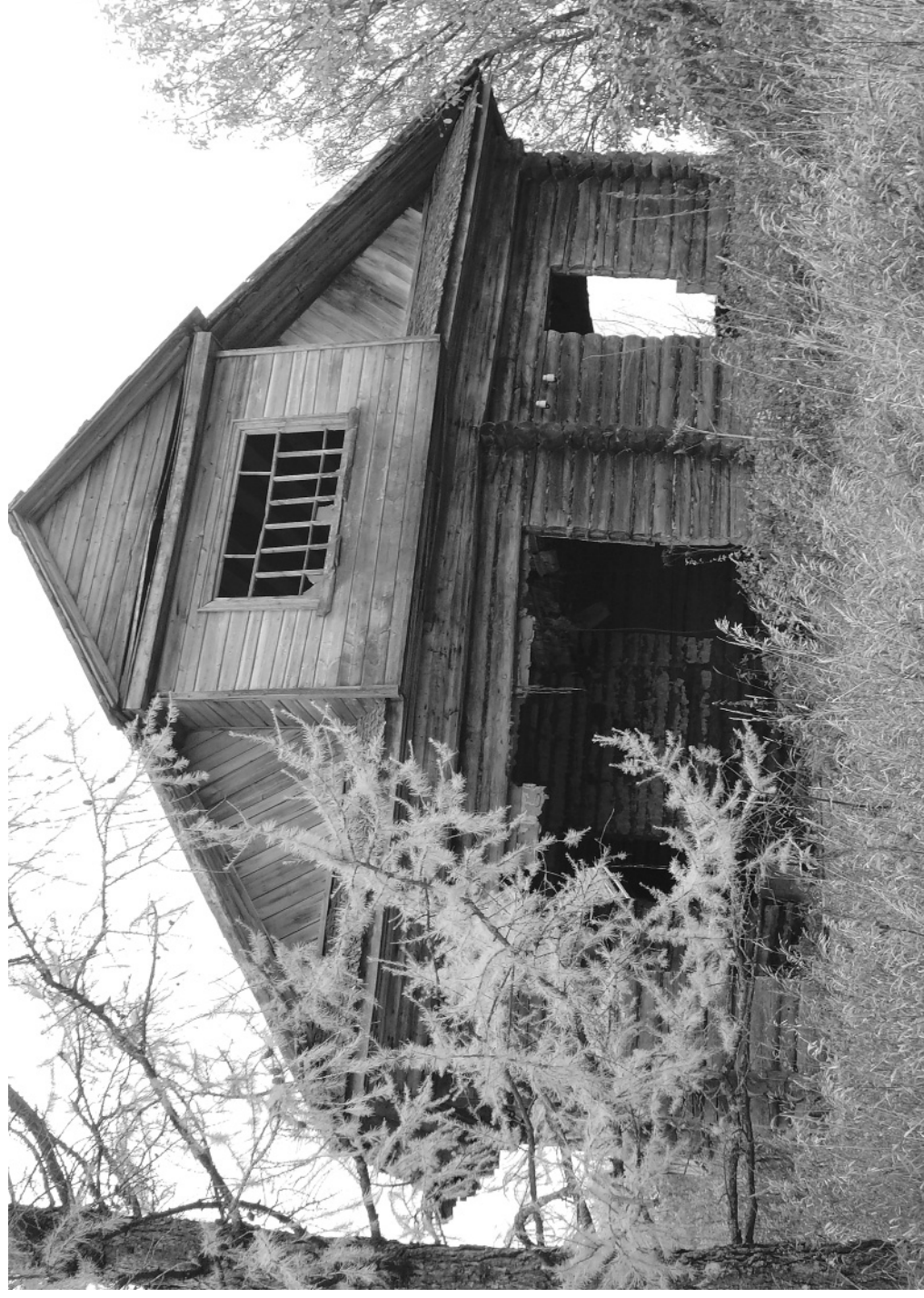
Кадка. Осень. Гальчино́ (Галицыно́).