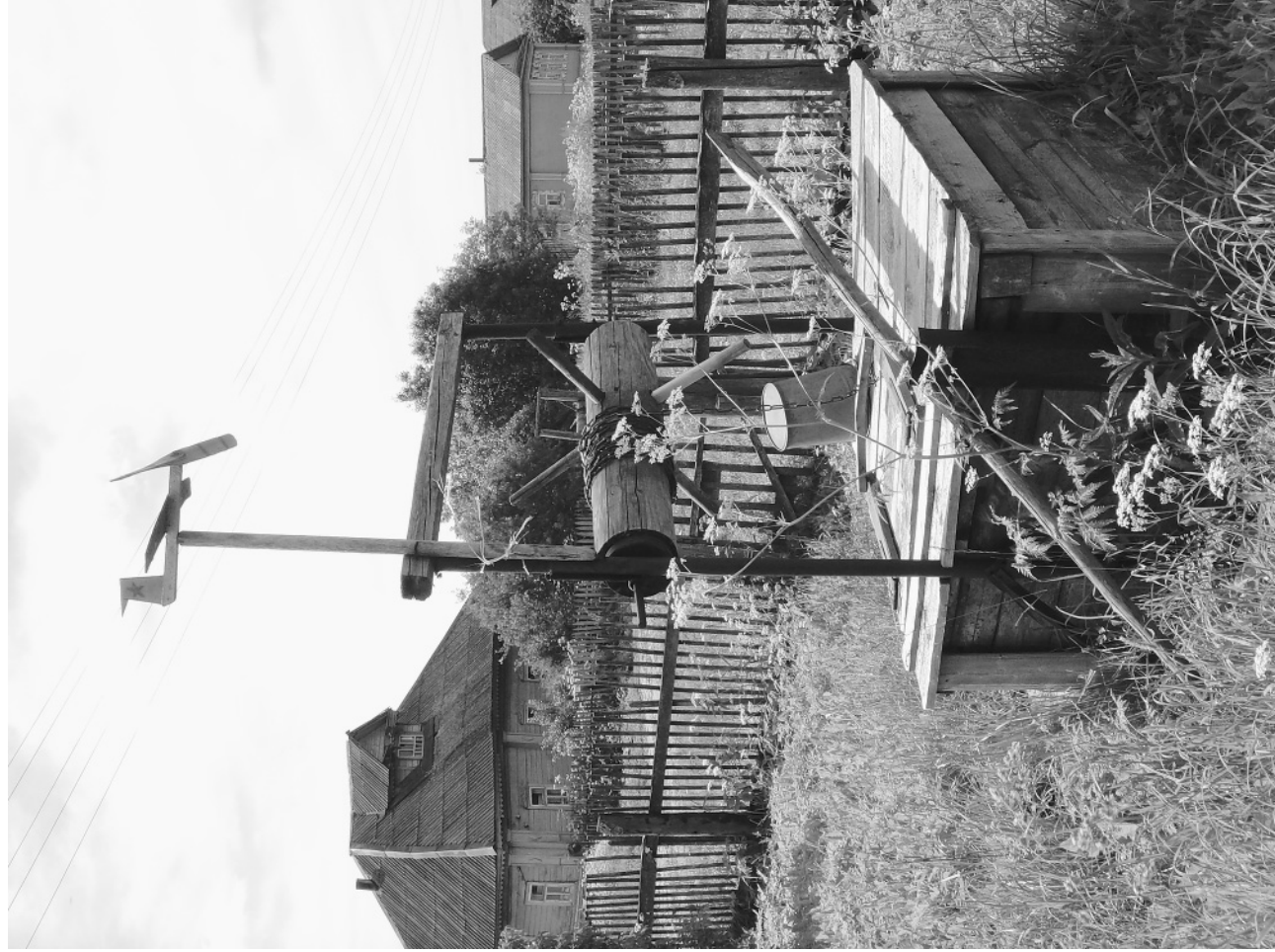
На одворице Куликовых. Средняя Кадка, д. Балакирево, 2008 год.

Дополнительные справки по телефонам: (48544) 32-7-36, 8-962-200-94-95.