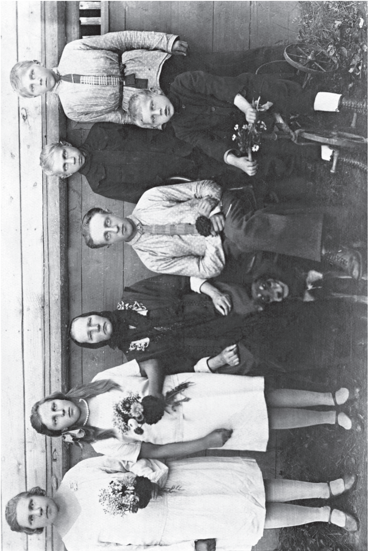
ПАРФЁНОВО, ДОРФЕЕВЫ. Первая половина 1920-х годов.