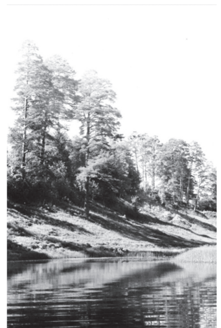
Река Кадка у Знаменского. май 1988 года

Сергей немало фотографировал. Один кадр наиболее удачен: возле возносящихся вверх колонн старой церкви корявый изломанный жизнью старый тополь. Природа и архитектура, начало и продолжение, нелёгкие судьбы.