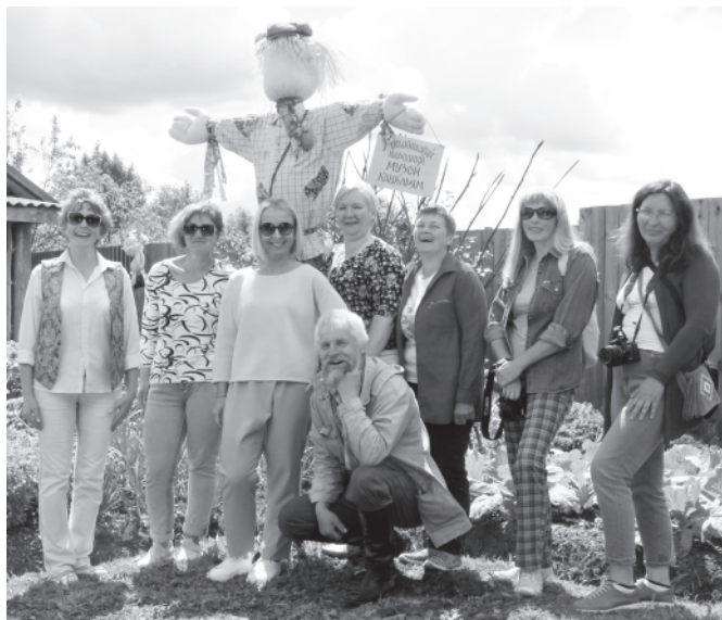
Коллеги из Мышкинского народного музея «примаскалили» к кацкарям «со своим полохалом». 5 июля 2018 года.

Но кульминацией встречи двух музеев была, безусловно, торжественная установка «полохала» в музейном «тыне». «Полохало» получилось настолько красивым, что само собой родилось для него имя – Иванко. Есть, правда, опасение, что вороны – наоборот – будут прилетать ещё в большем количестве, чтобы им полюбоваться... Но и у Иванки совсем другая работа нашлась: с туристами фотографироваться и напоминать им, что после Этнографического музея кацкарей неплохо бы заглянуть ещё