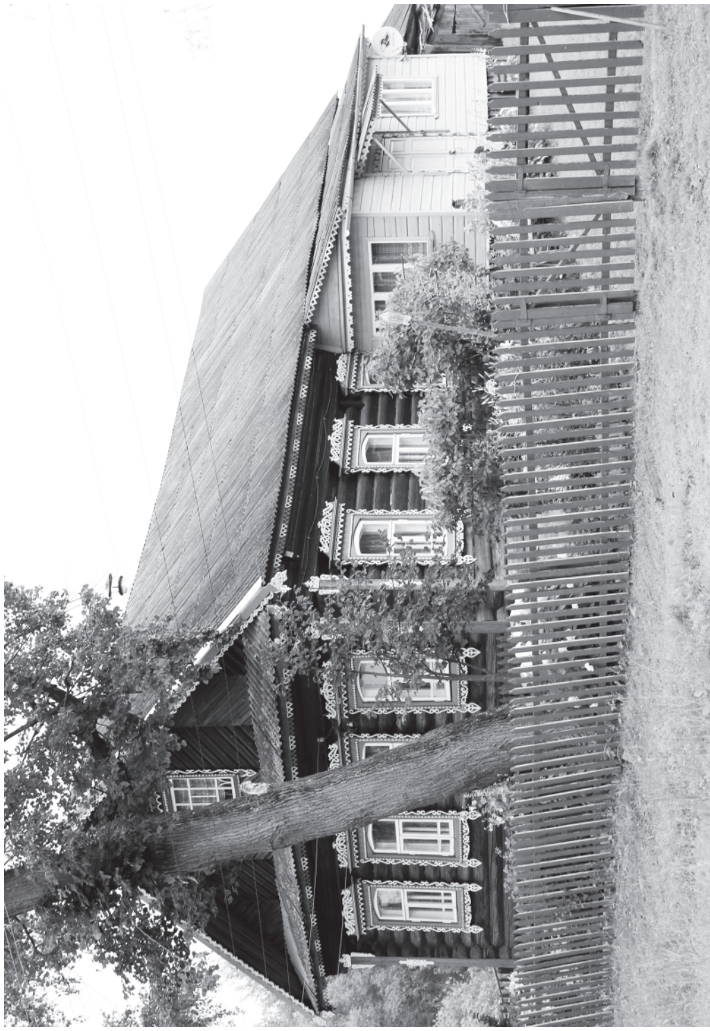
Кадка. Лето. Платуново.