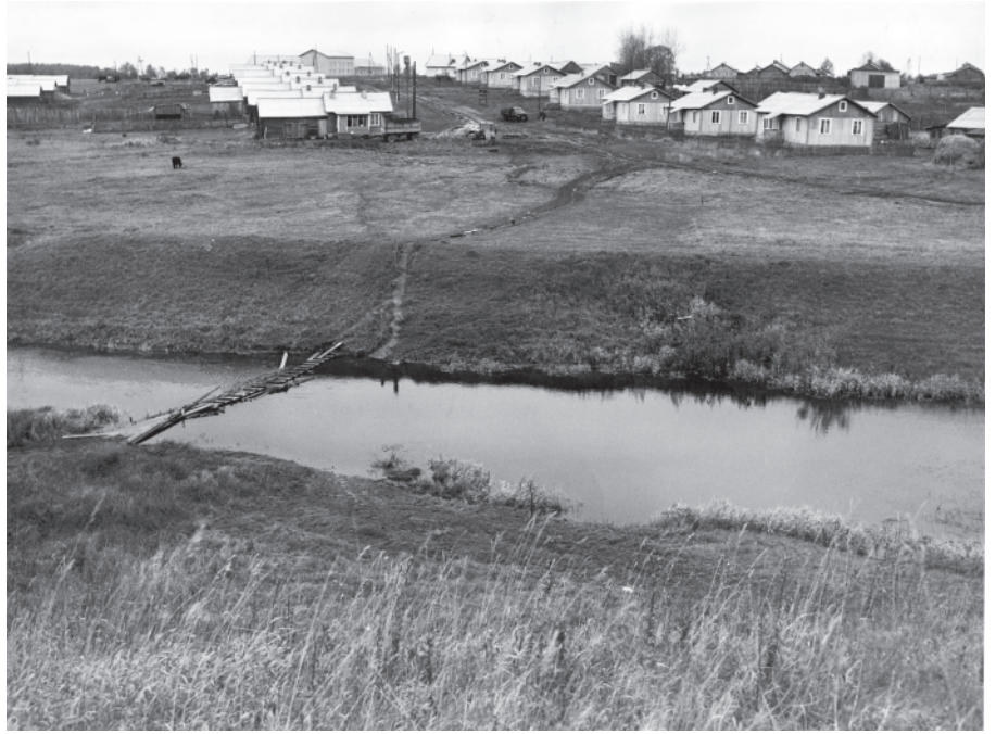
Новый колхозный посёлок при деревне Воронцево. г. Ярославль, 1986 год.

Оплата труда в колхозах производилась в основном в конце года в форме натуральной оплаты зерном, сеном, картофелем, льняным маслом и сахаром, которые получали в обмен на сданное зерно. Служащие сельсовета получали заработную плату; она была невысокой, и в виде зарплаты им ежемесячно выдавалась мука. На декабрь 1933 года норма