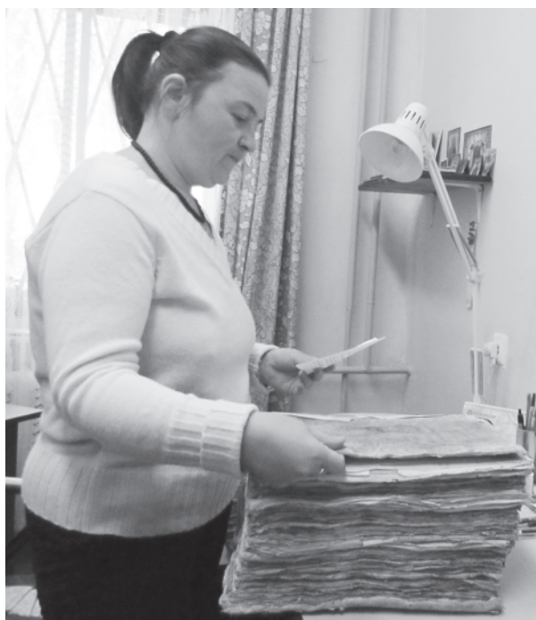
«О, сколько нам открытий чудных» готовят старинные документы. Сотрудница угличского филиала государственного архива с метрической книгой. 2014 год.

«Исповедные книги по городу Мышкину и Мышкинскому уезду», 1807 год // Филиал Государственного архива Ярославской области в городе Угличе (УФ ГАЯО), фонд 18, опись 3, единица хранения 60.