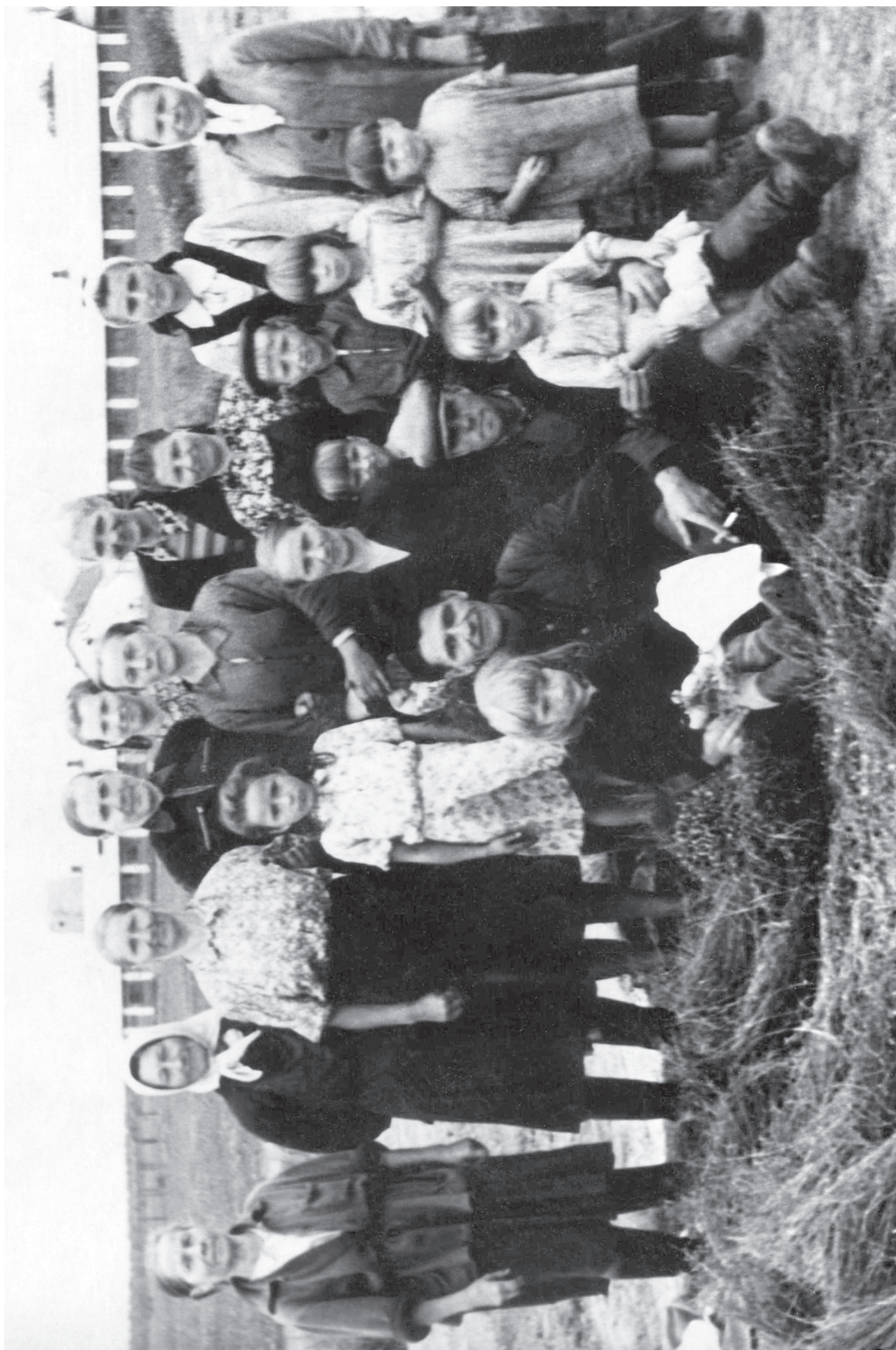
БІБЯКІ. ОКОЛОТКА ЛЬНА. 8 сeнтябpя 1957 гoдa.