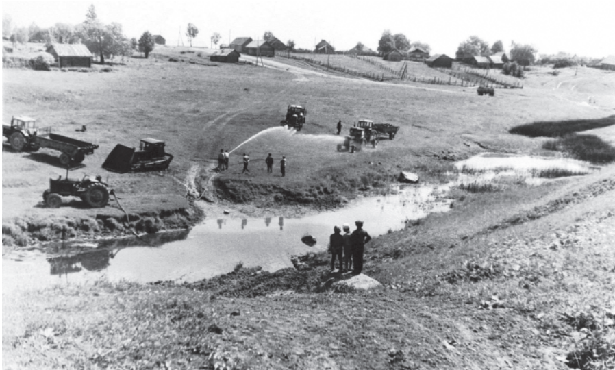
Мылка техники в колхозе «Новый путь» на реке Кадке у деревни Трухина. д. Трухино, 1960-е годы.

Местной властью устанавливались нормы коллективизации. Вот выписка из постановления сельсовета