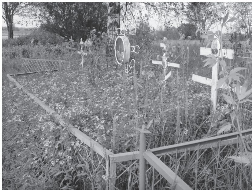
А это Хоробровское кладбище. Тоже несуетное, притягательное, обещающее вечный покой...

1. «Метрические книги по городу Мышкину и его уезду. 1848 год» // Угличский филиал Государственного архива Ярославской области, фонд 18, опись 3, единица хранения 219.