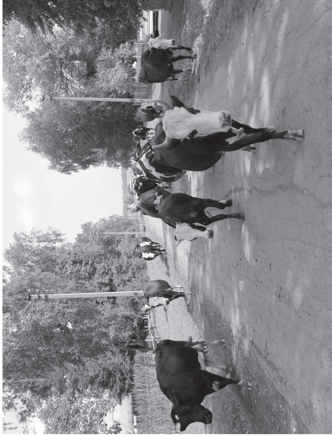
Кадка. Лето. Мартыново