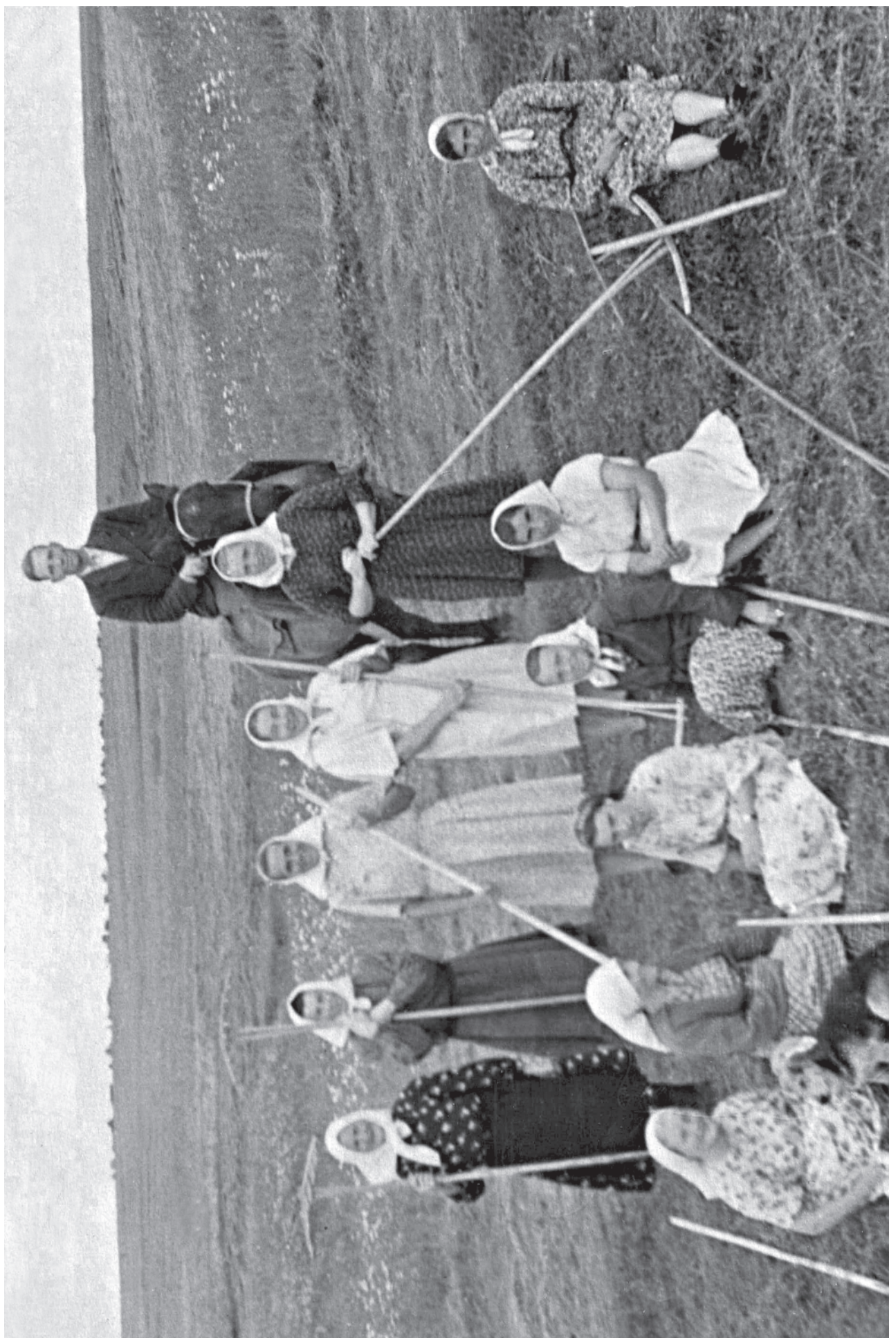
ХОРОБОВО. СЕНОКОС. 1962-1963 годы.