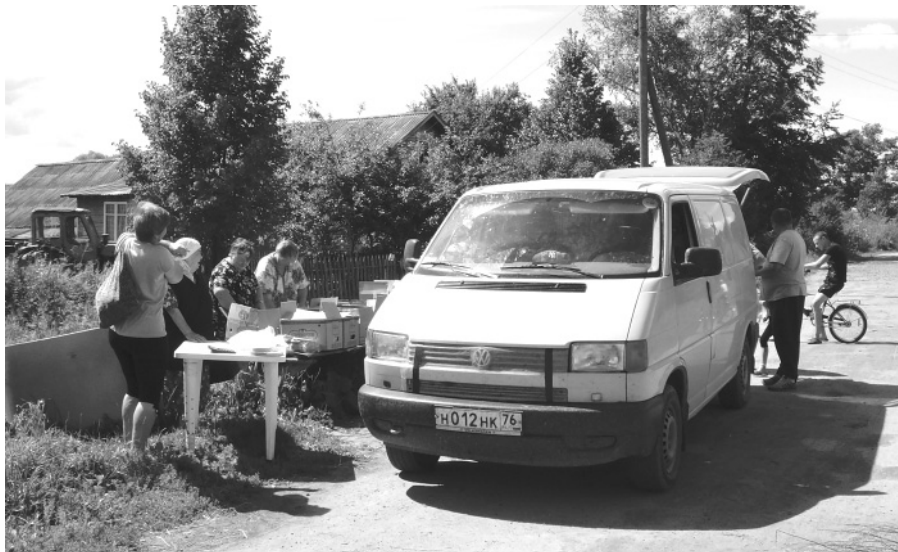
Из современной жизни Платуновского края: автолавка примаскалила!