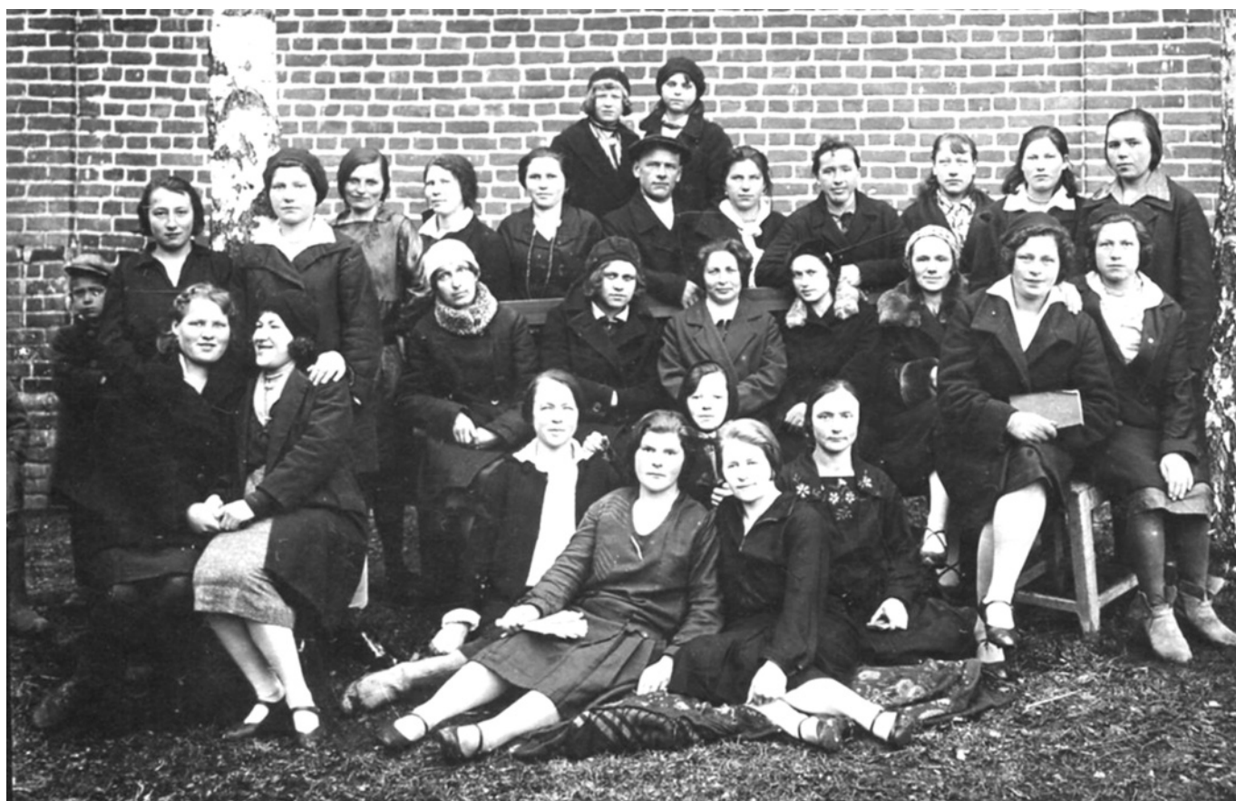
У Рождественской сельской участковой больницы. Имена сфотографированных давным-давно позабыты. Кто-то из них наверняка из медперсонала, кто-то – учитель, а кто-то и работник культуры... В общем, активные участники народно-просветительского движения первого советского десятилетия. 1920-е годы.

«Нардом Рождественского культпросвета в селе Рождествене Рождественской волости Мышкинского уезда организован в феврале 1918 года. Помещение – бывший