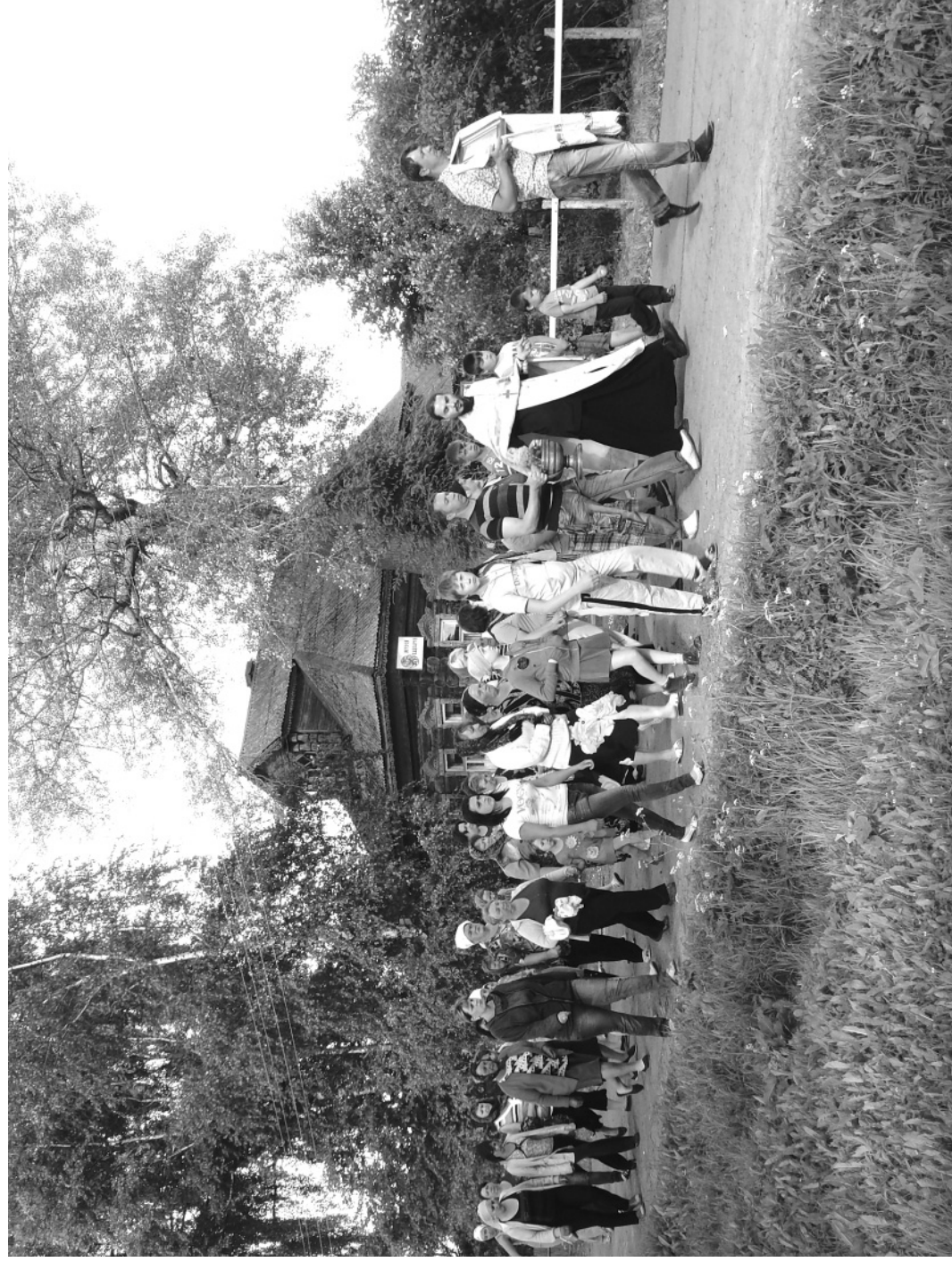
Кадка. Лето. Мартыново.

Снимок Ольги Алексеевны Перовой, 2013 год