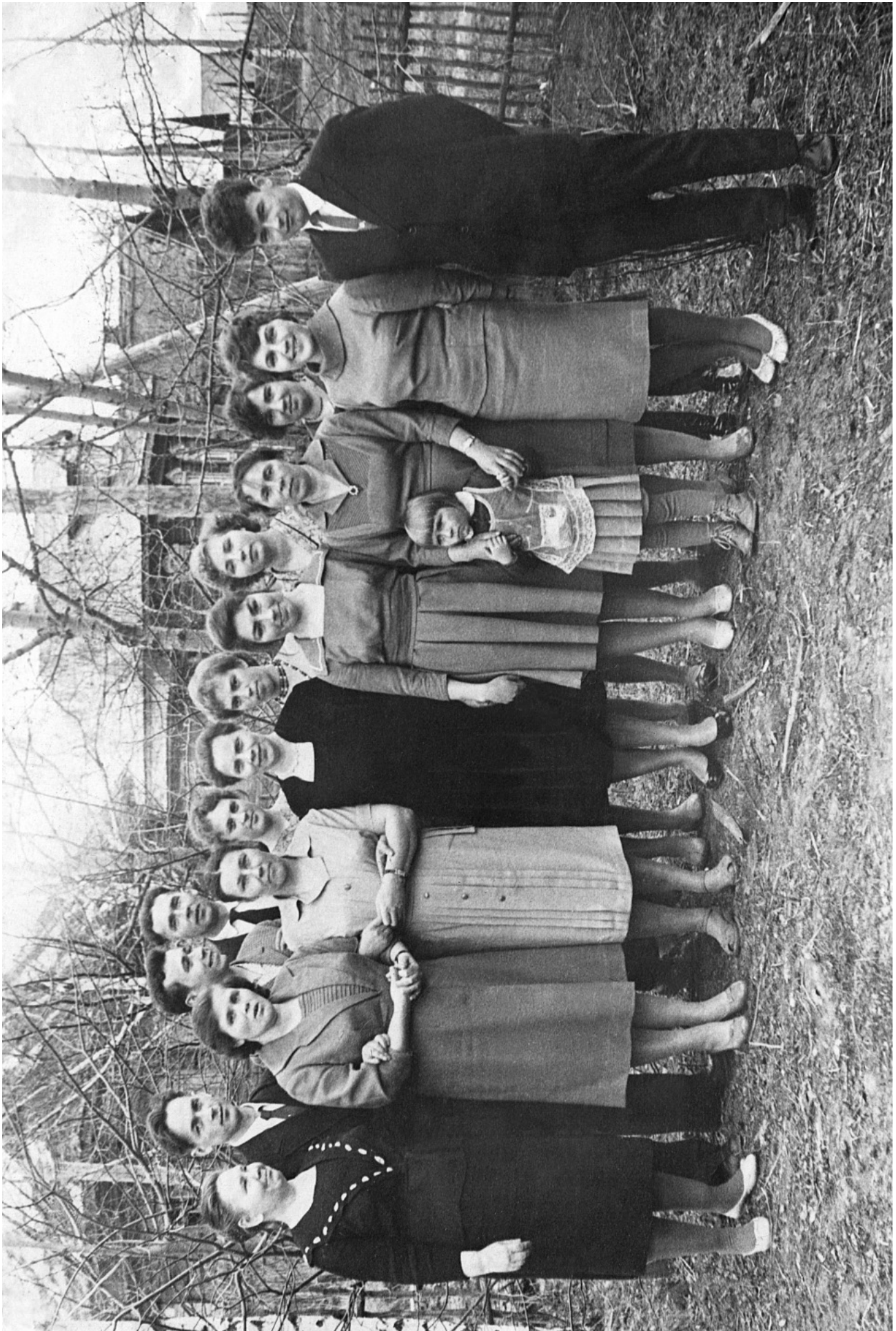
РОЖДЕСТВЕНО. МАЙ. 1964-1965 годы.