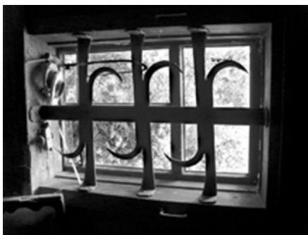
Кованая решётка очень традиционна. Возможно, такие были и в XVII веке. Особняк Гариных, село Ковезино, Верхняя Кадка.