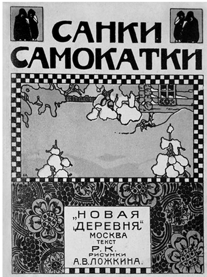
Обложка шестистраничной книжечки «Санки-самокатки», выпущенной издательством «Новая деревня» в 1923 году. Автор по-прежнему скрывается под псевдонимом «Р.К.».

Раиса Адамовна Кудашева г. Москва, 1910 год