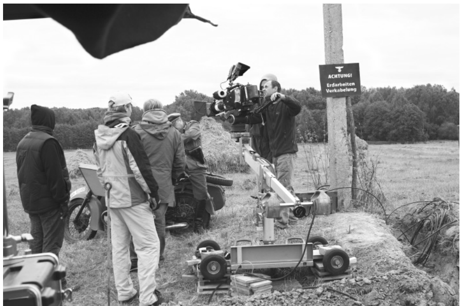
Великую Отечественную войну снимали на кацком порубежье – по дороге в Крюково...