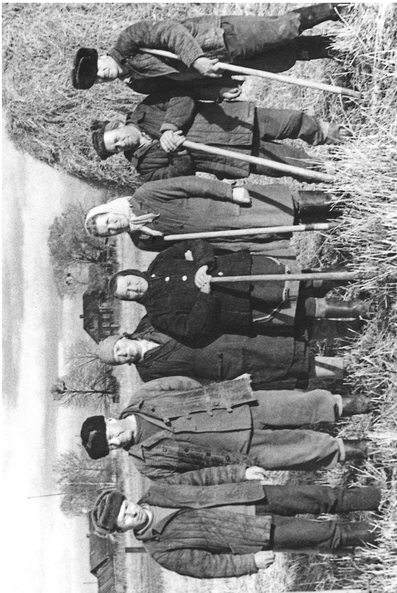
БОГДАНКА. СТОГОВАНИЕ СОЛОМЫ. 1978 или 1979 год.