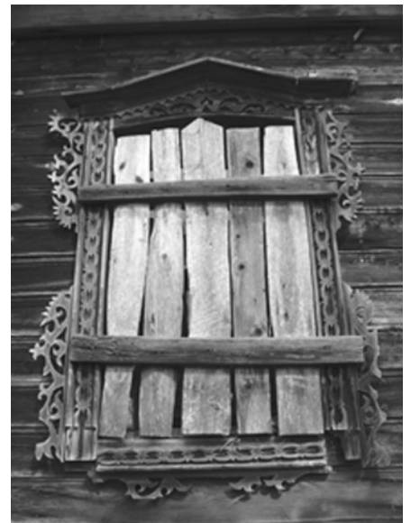
Вот и в наши дни, как и в начале XVII века, сплошь и рядом заколоченные окна деревенских изб. Новая Смута? Изба Волковых, деревня Дягилово, Нижняя Кадка. Снимок С. Темняткина, 2007 год

В Кацкой да волости на речке да на Шишинке стояло себе село Тишаево с храмом Божиим да с окрестными деревеньками: Летииковом, Стулыбьевым (а Кузнецовом то ж), Исаковом, Киёвом, Зерновом Починком, Селином да Пашковом. И дано было это самое Тишаево да с деревеньками в 1611 году в помес-