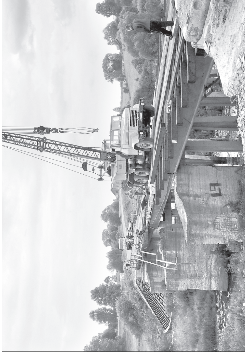
Кадка. Лето. Ордино.