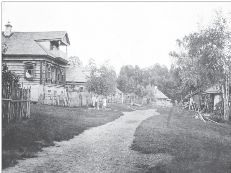
Улица в селе Ордине (в сторону кладбища). 1920-е годы.

В сохранившихся метрических книгах церкви села Ордина можно отыскать