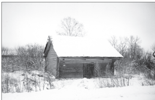
Кондырева кладовая в Юрьевском.

На втором этаже все парты сдвинуты к одной стене, поставлены одна на другую. Посредине класса стоит