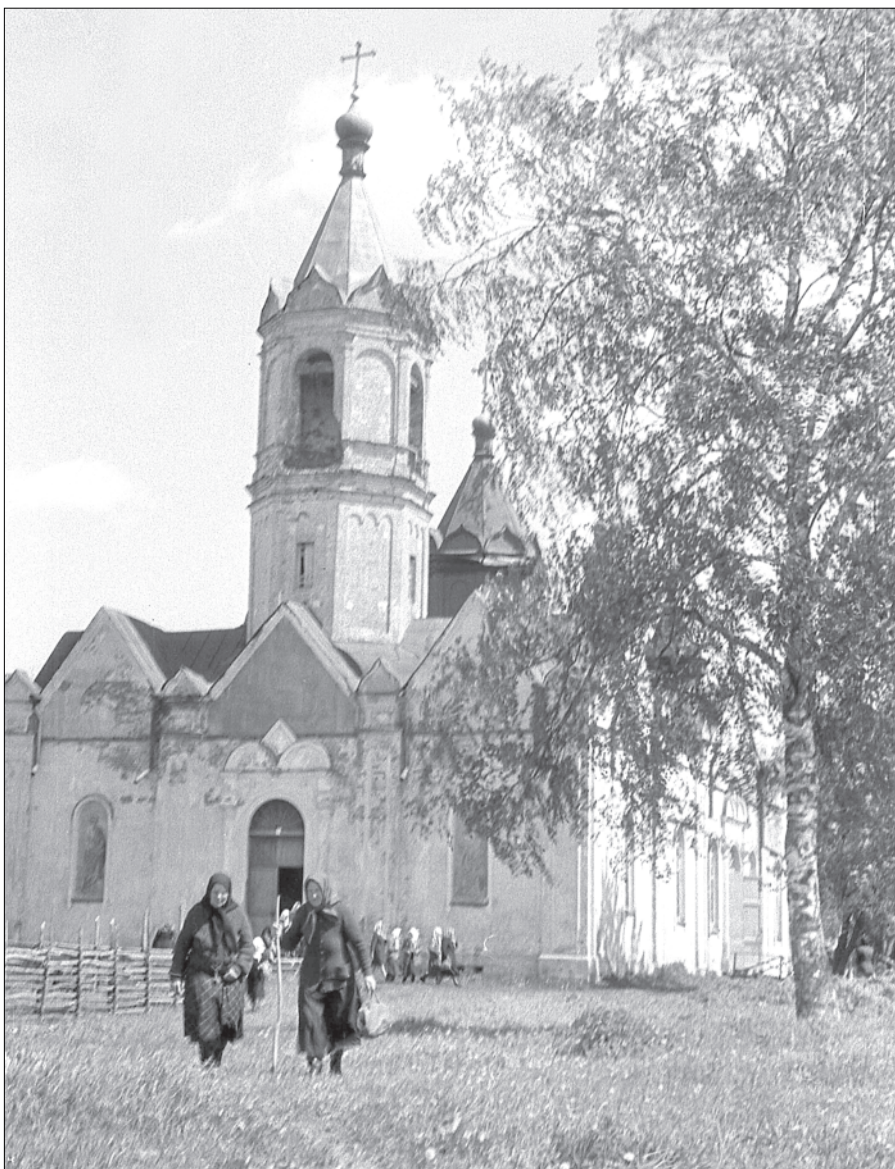
В 1960-е годы в Ковезинской (Покровско-Кацкой) церкви всё ещё шли службы. с. Ковезино (Покровское в Кадке), 1963-64 годы.