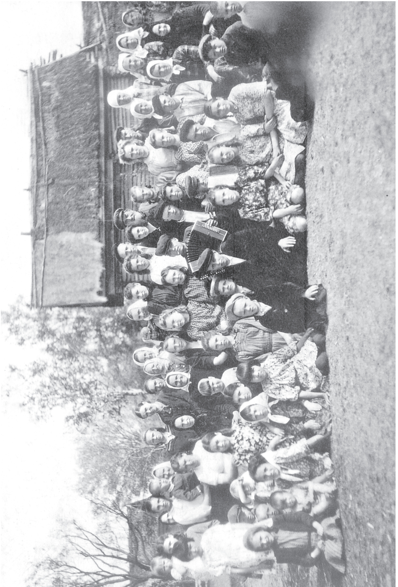
ЧЕРНЕВО. ИВАНОВ ДЕНЬ. 1949-1950 год.