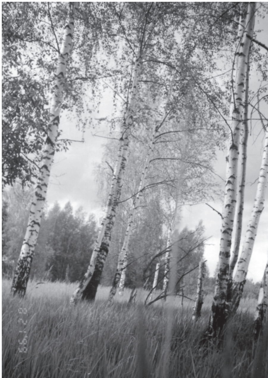
Там, где жил Тресневский, теперь растут берёзы. Козловка (бывшее сельцо Козловка) на реке Кадке. 1999 год.

5. Малов-Гра А.Г. «Путь доблести и славы 18-го Егерского полка в 1812-1814 гг.» // «Военно-исторический журнал», № 6, 2009 год, стр. 31-39. Сайт: Международная военно-историческая ассоциация – ссылка на публикацию – http://www.imha.ru/page,5,1144528988-put-doblesti-i-slavy-18-go-egerskogo-polka-v-1812-1814-gg.html (дата обращения 12 сентября 2015 года).