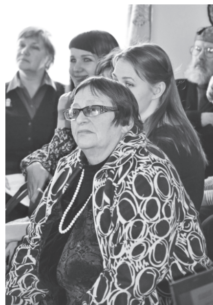
На XVII-х Кацких чтениях: слушатели.

А вообще-то надо сказать, что кацкие краеведы, отнюдь не гонясь за мировыми тенденциями, нередко, тем не менее, оказываются в их русле. Может быть, в силу интуитивной чуткости к духу времени. Так, например, сейчас во всём мире растёт интерес к истории повседневной жизни разных стран и эпох.