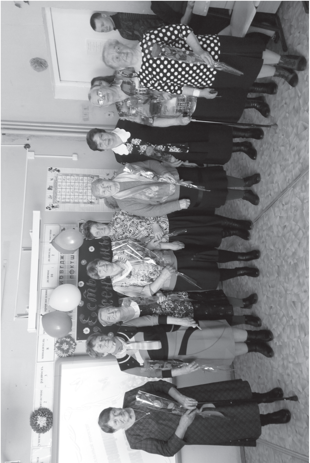
РОЖДЕСТВЕНО. ЕСТЬ ЖЕНЩИНЫ... 28 апреля 2017 года.