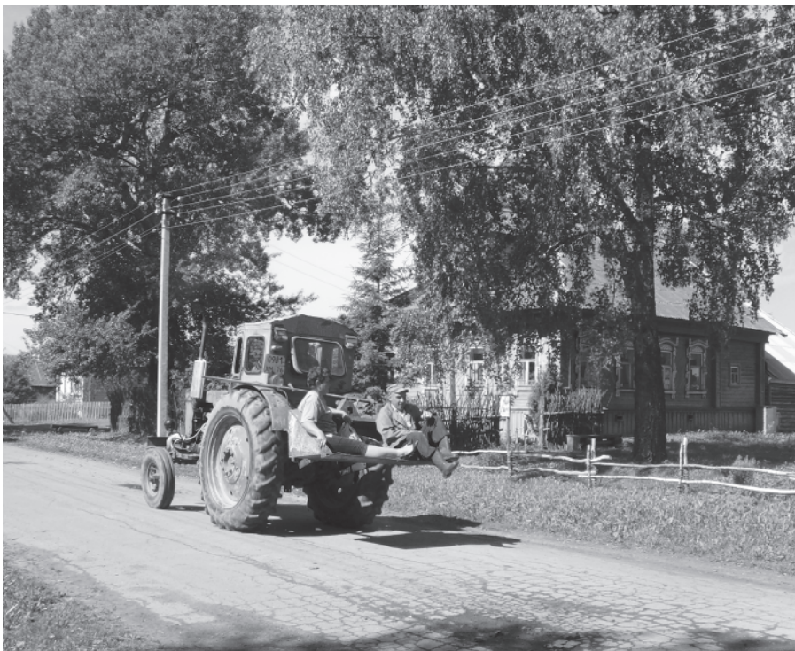
А бывает, в магазин за покупками из дальних деревень добираются так... д. Мартыново, 16 июня 2016 года.