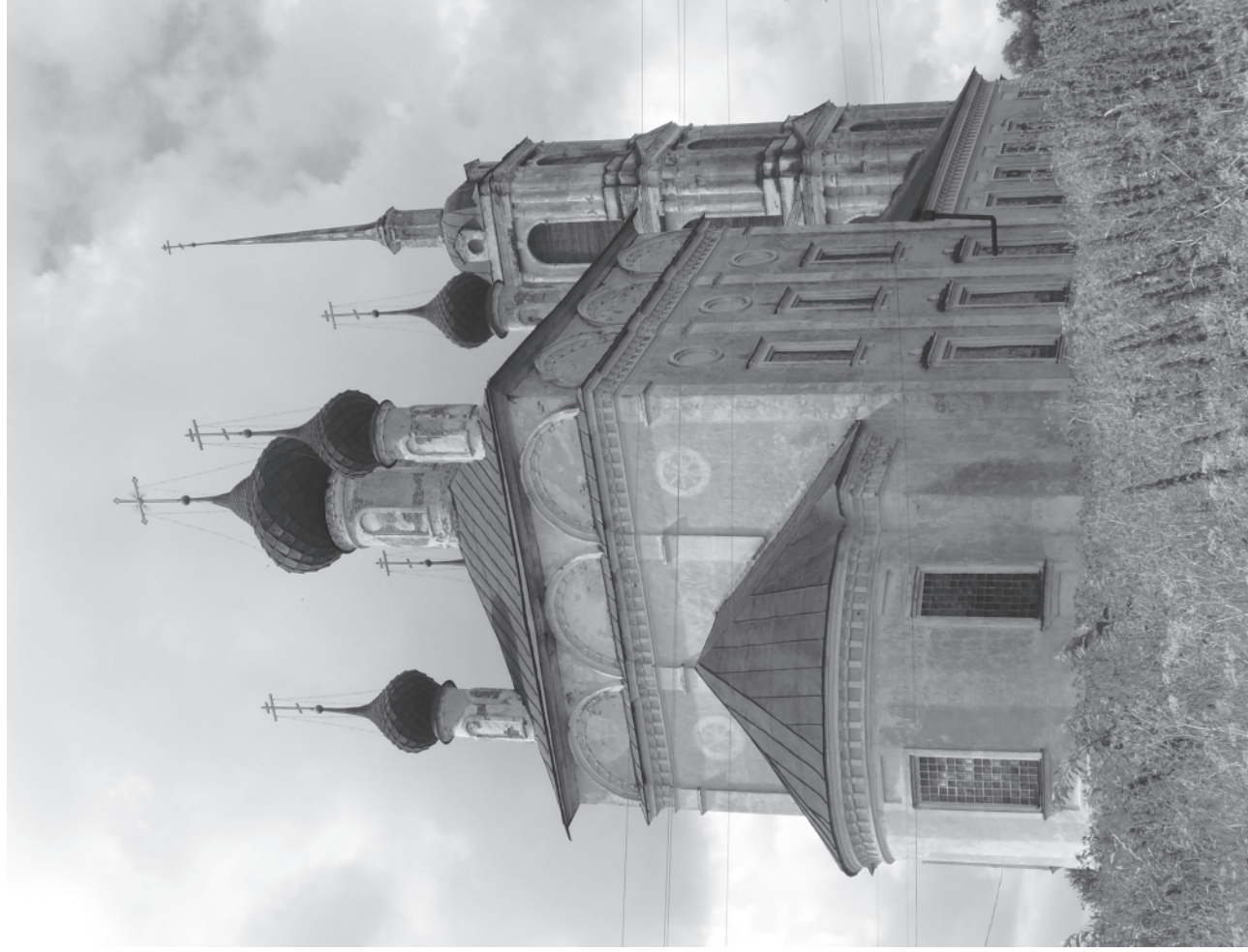
Троицкий храм. с. Ордино, 17 июля 2007 года.