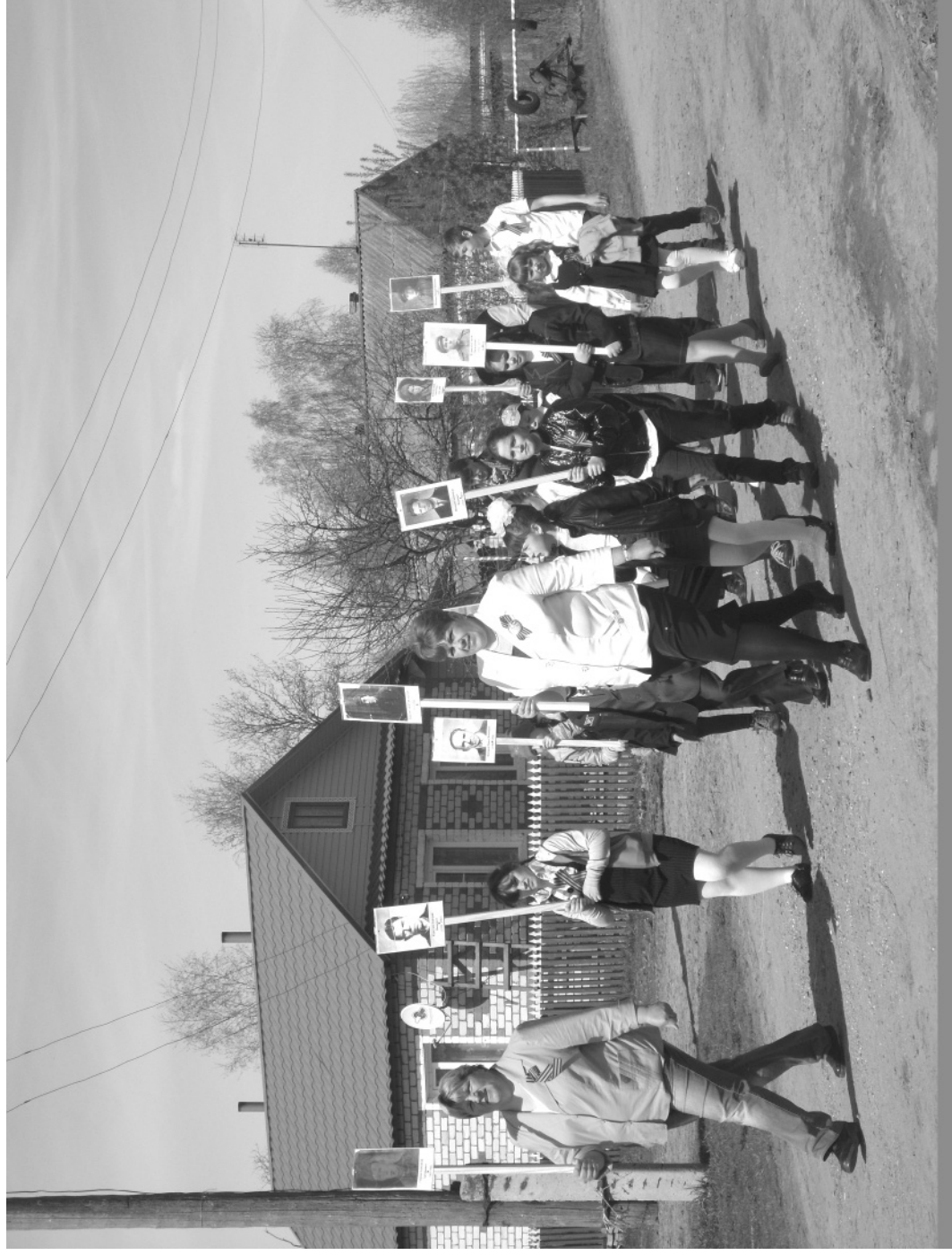
Кадка. Весна. Воронцово – Ордино.