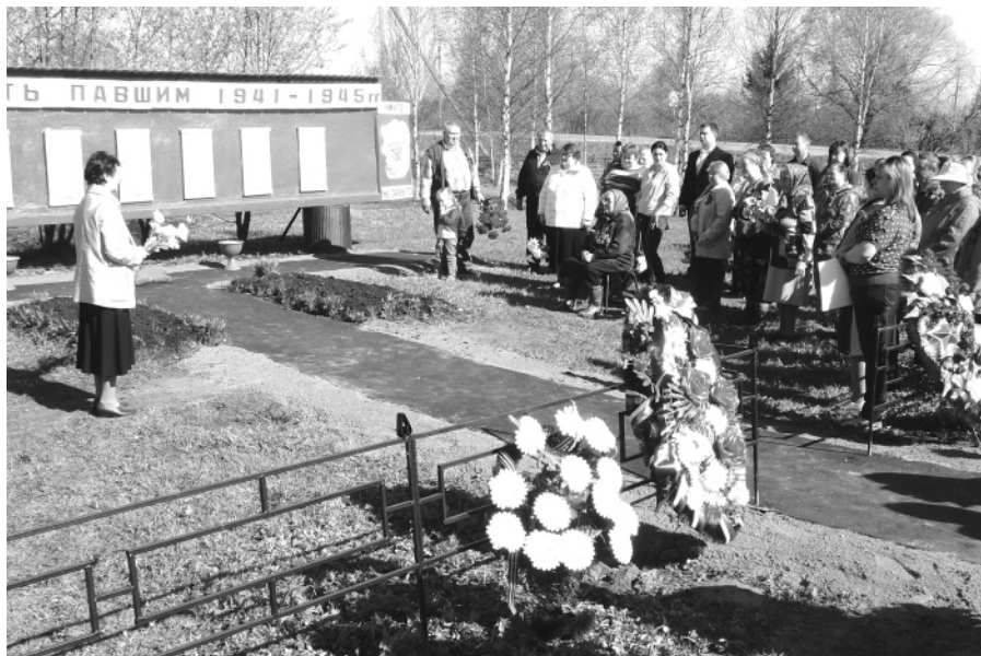
Митинги, посвящённые Дню Победы в Великой Отечественной войне. Мы привыкаем проводить их без ветеранов – их уже никого в живых не осталось. И совсем мало приходит тружеников тыла. Время неумолимо... д. Мартыново, 9 мая 2015 года.