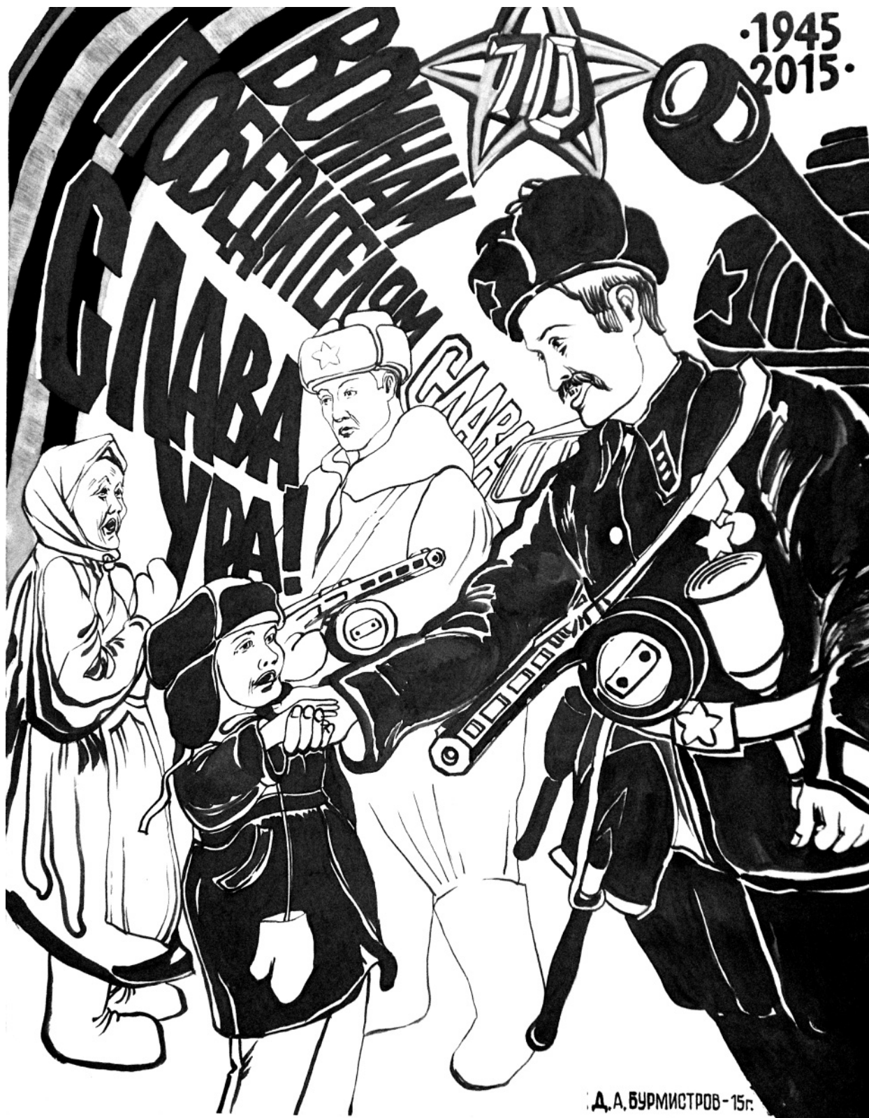
Плакат «Воинам-победителям – слава! Ура!»