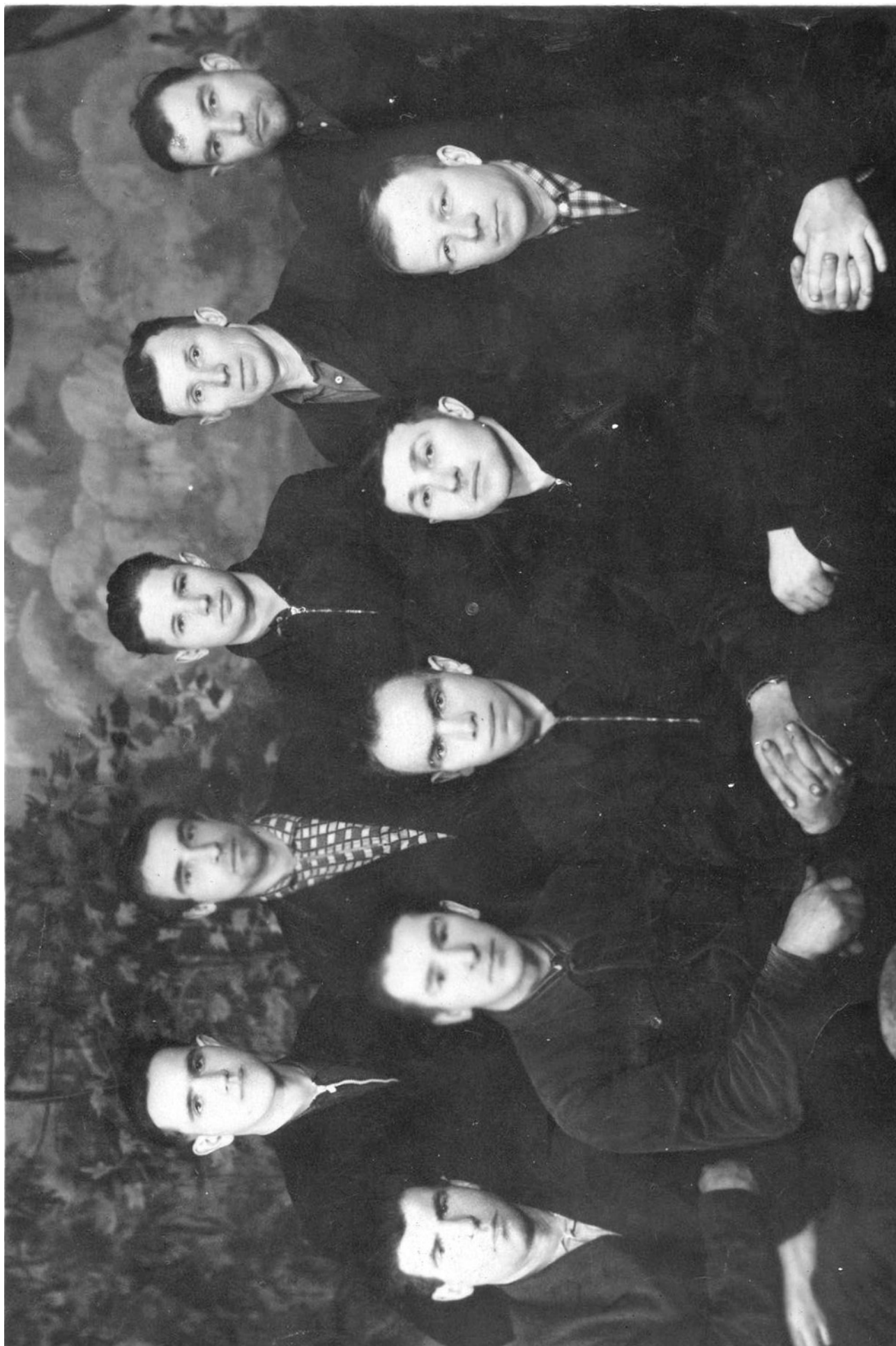
ПАВЛОВСКАЯ МТС. ТРАКТОРИСТЫ. 1954-1955 годы.