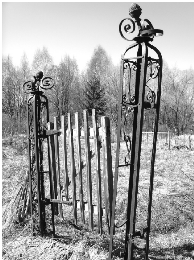
Кованые веретей Хоробровского кладбища нет-нет, да и вспомнят монастырские времена...

Великий князь Василий III не забыл своё обещание. 13 мая 1524 года была основана «Велия обитель Пречистой Богородицы Одигитрии» – Новый монастырь на Девицьем поле