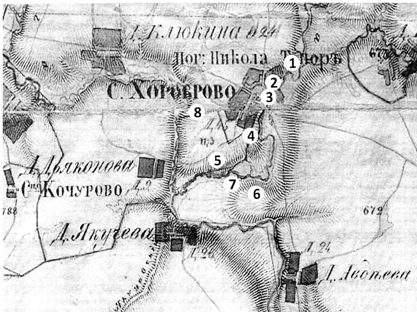
Хоробровские горы: 1 – Круча, 2 – Кокуйка, 3 – Иванова гора, 4 – Поповка, 5 – Вшивая горка, 6 – Слабутина, 7 – Стрижовы горы, 8 – Красная горка. Согласитесь, а ведь в обычае называть высокие берега рек горами есть тоже что-то византийское...

Схема выполнена на основе карты Александра Ивановича Менде, 1855-1857 годы