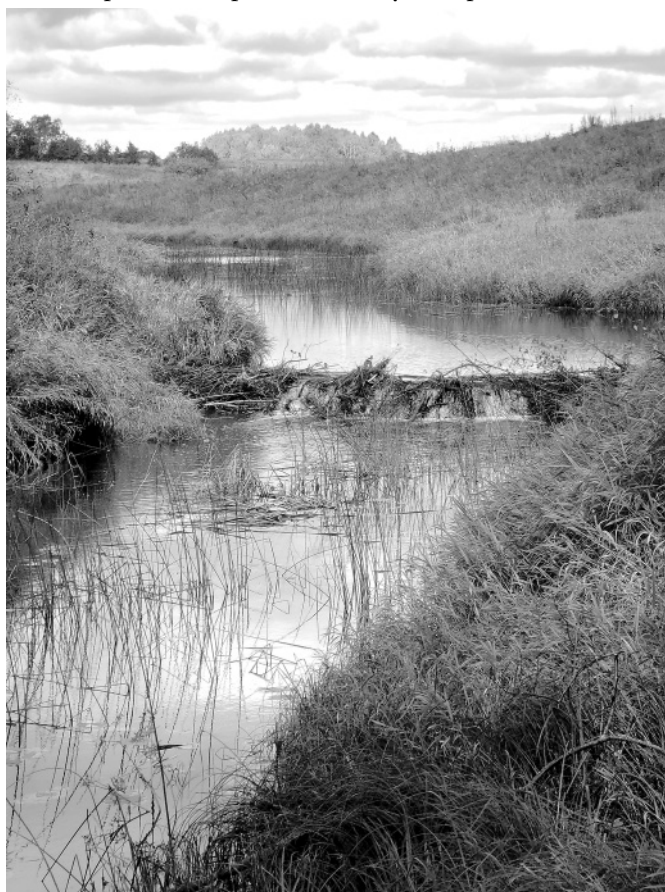
Река Кадка. Бобровая плотина у Пальцева близ села Ордина. Снимок С. Темняткина, 2007 год

Что же представлял собой этот местный путь в исторические времена? В дорусскую эпоху это мог быть внутренний торговый путь между племенными группировками меря и весь, граница между которыми, по оценке