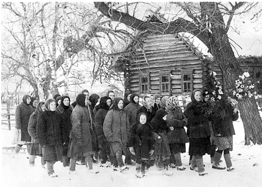
Дьяконовка. Хождение «с красам». Ноябрь 1956 года.