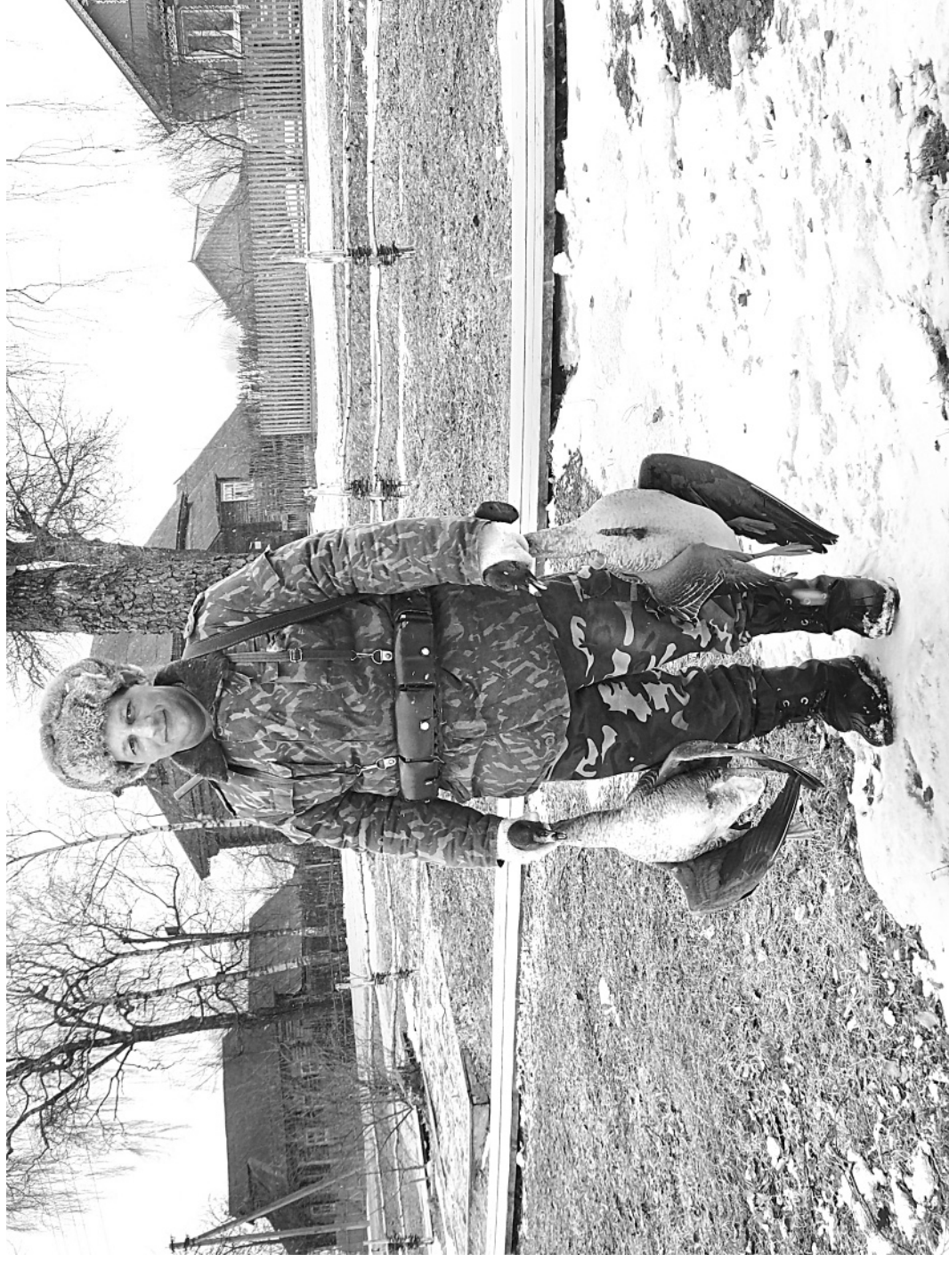
Кадка. Весна. Мартыново.