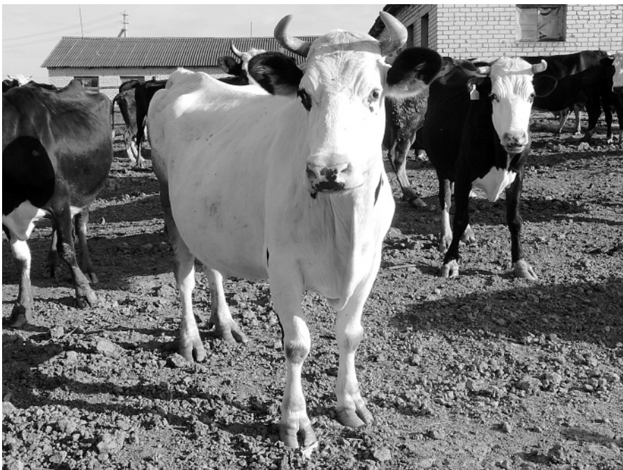
Во главе аристовского стада, как это и положено у кацкарей – Белая Корова.

26. Есть ли телефон? Есть, он же факс: 2-45-48.