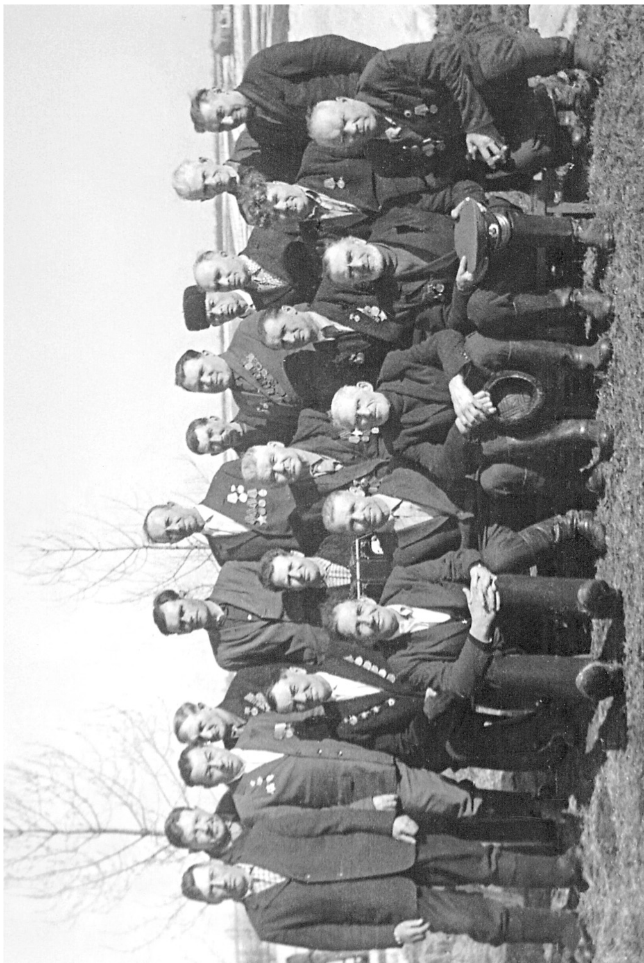
ЛЕТИКОВО. ВЕТЕРАНЫ. 9 мая 1976 года.