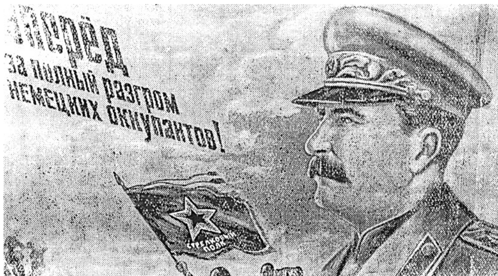
Плакат «Вперёд, за полный разгром немецких оккупантов!» Рисунок художника Н. Долгорукова.

Мы, учителя и учащиеся Алфёровской школы, благодарим колхозников колхоза имени Сталина Исаковского сельсовета, проявляющих заботу о школе. Колхоз имени Сталина (председатель Лемехов) выделил для учащихся нашей школы 11 пар валенной обуви, дал школе 1,5 центнера капусты, 1,5 центнера картофеля и мяса для го-