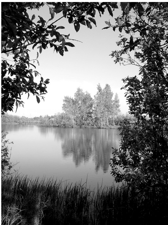
Деревню Иваново стёрла с лица земли совхозная мелиорация. И даже знаменитое Бяково болото давно уже не болото, а пруд.

А ряженкам 5) -то как, милой, ходили. Начасто ходили! Рядились не только на свадьбы да Новой год, а партия соберётся, и пойдём плясать песни! В кого рядились-то? Да в баушку какую или в дедушка; ведь и одевать-то было больне нечего, а мы всё ровно на-