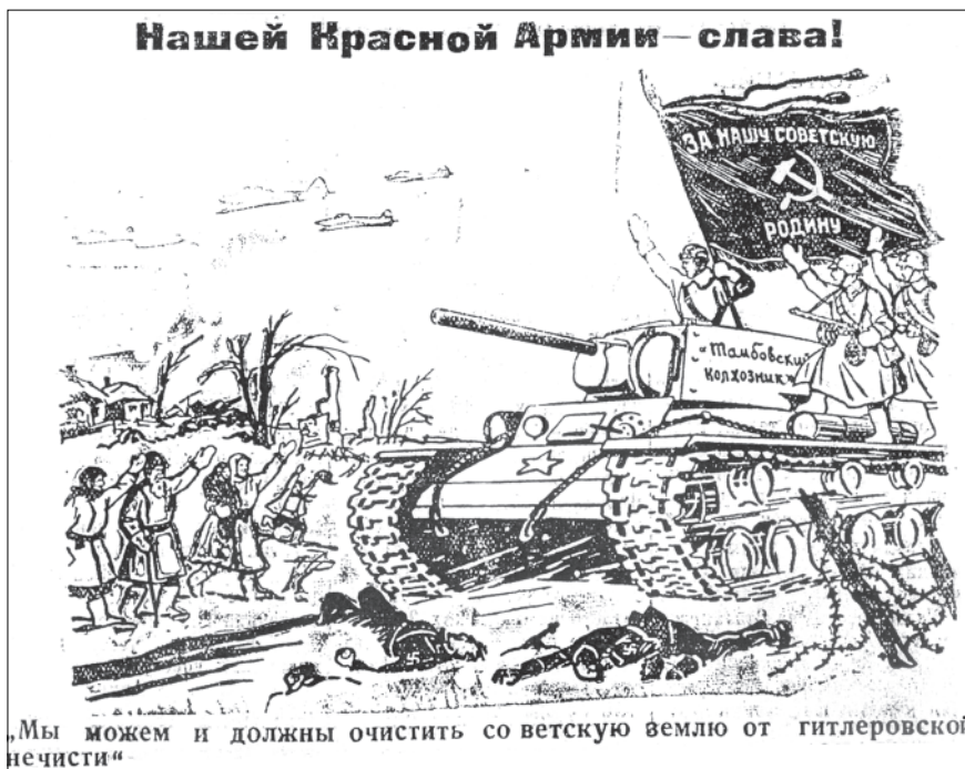
Плакат «Мы можем и должны очистить советскую землю от гитлеровской нечисти».

Коллектив Рождественского детского дома приобрёл