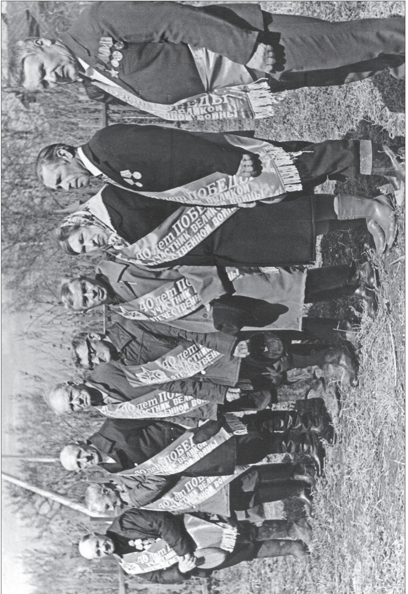
РОЖДЕСТВЕНО. ВЕТЕРАНЫ. 9 мая 1985 года.