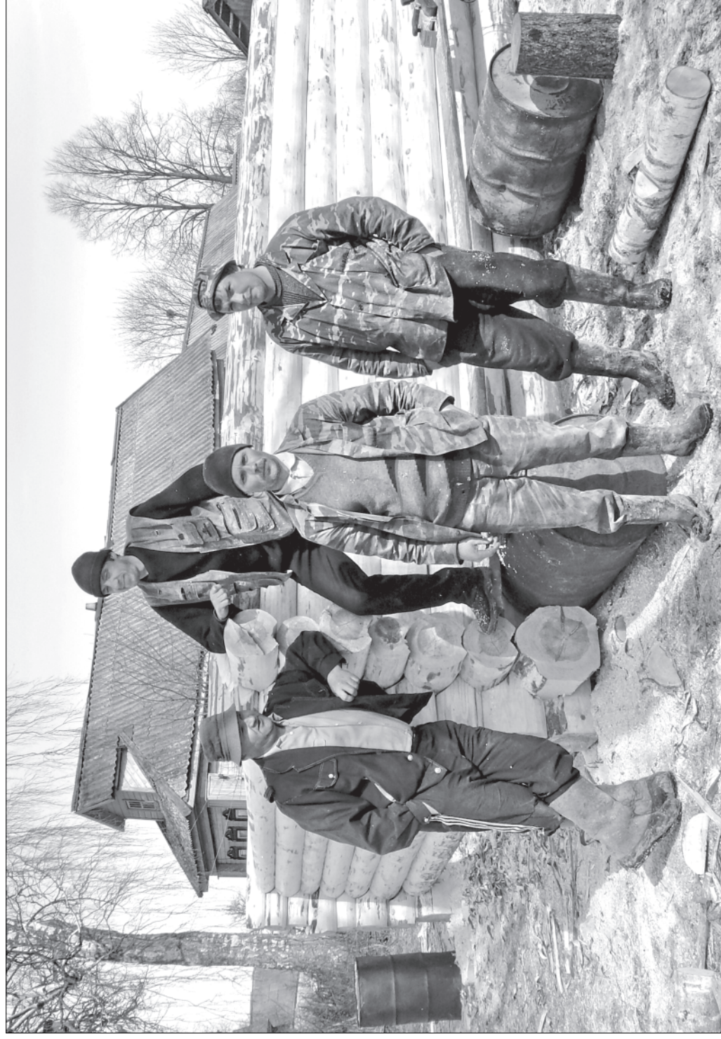
Кадка. Весна. Алфёрово.