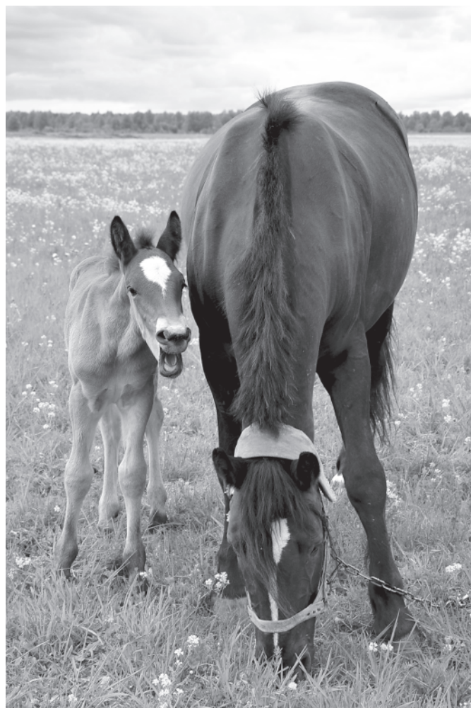
Мартыново. Первое лето Говорка́. 6 июня 2017 года.

22 июля. Ночи холодные – сегодня плюс 10°C, а вот днём плюс 23°C. Дождя нет, и все убирают сено – хоть и валявошное, да по нынешнему лету и такое роскошь. Тѣмкою залетали комары.