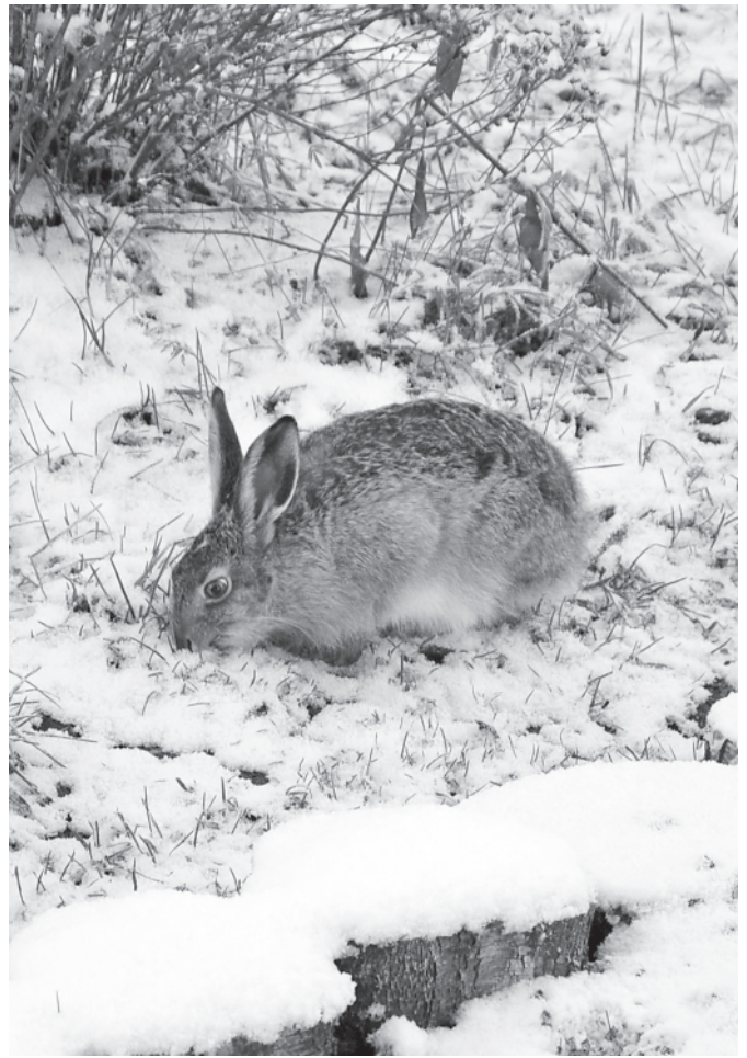
Мартыново. Заяц под окном. 1 ноября 2017 года. Снимок Ирины Александровны Давыдовой, д. Мартыново

10 декабря. Проснулись от того, что снег с шу-