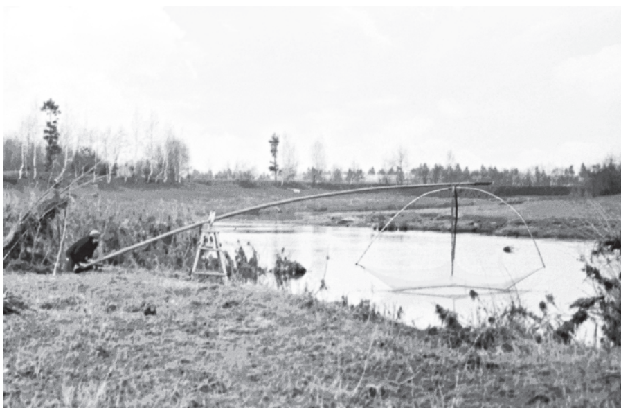
Намёт на реке Корожечне. Для любопытных уточним, что это Нижняя Кадка, а точнее Сеча – небольшой лес возле деревни Чернятина при впадении Кадки в Корожечну.