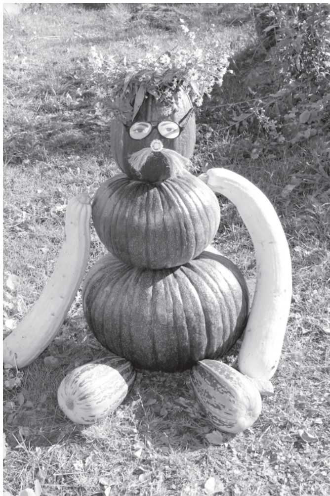
Мартыново. Осенний человек. 23 сентября 2017 года.

20 октября. С бёлá минус 1°C, за́зимок на траве. Днём плюс 4°C, на́волошно с прояснениями, морось. А вчера был ливень и юго-западный ветер 6 метров в