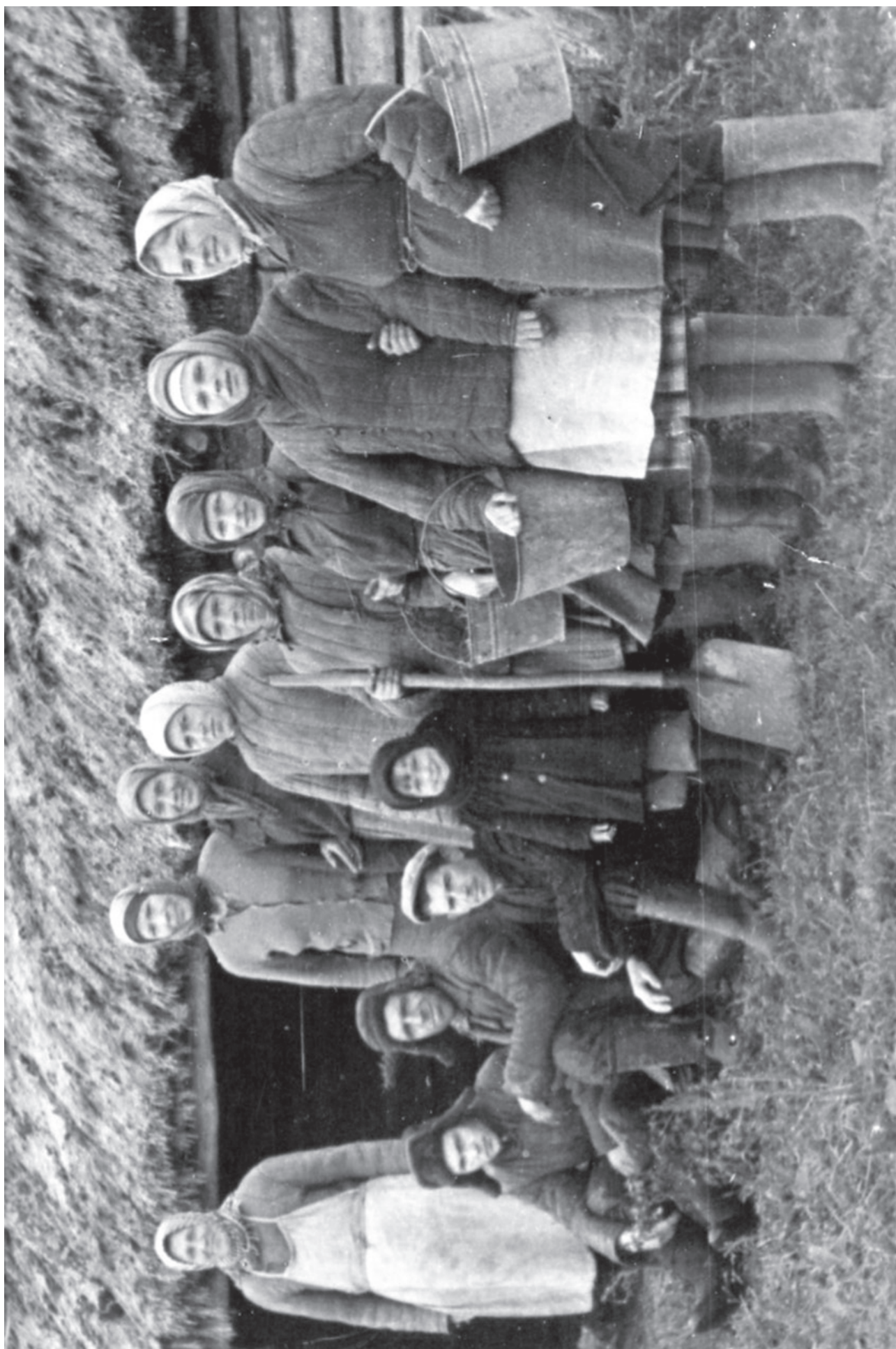
МАРТЫНОВО. У ЗНАМОВЫХ РИГИ. Около 1959 года.