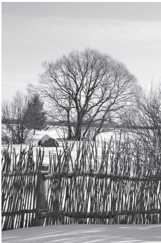
Мартыново. Зимние о́гумны. 25 февраля 2017 года.

7 февраля. Позвонили из Платунова: у них минус 30°C. И у нас минус 30°C с бела́, а днём минус 17°C.