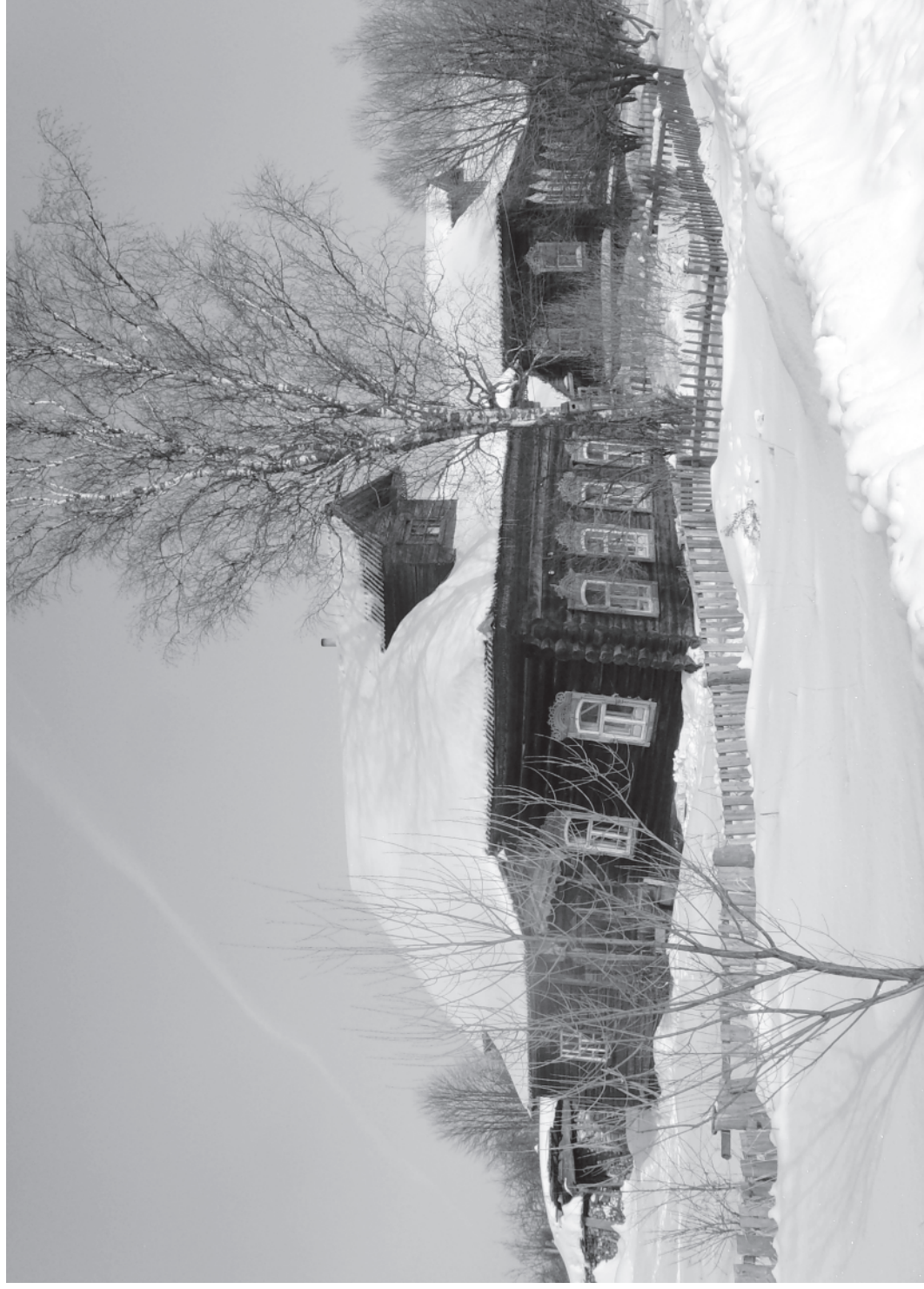
Кадка. Зима. Дуново.