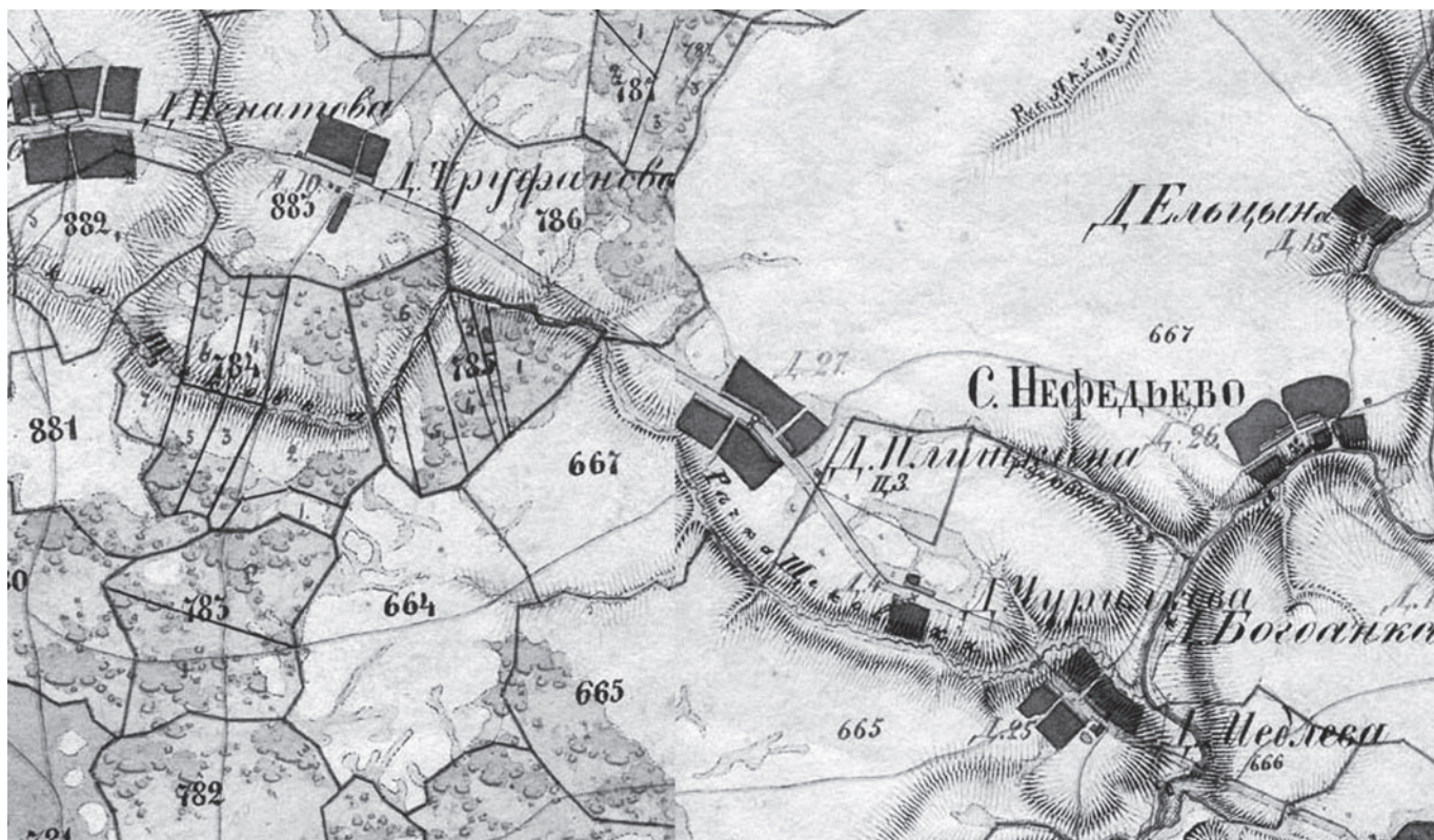
Игнатово, Труфаново, Плишкино-Нефедьевское, Чурилково, Медлево – все эти деревни располагались на Угличско-Бежецком тракте. Ну, или, как говорили в народе, на «Большой дороге».