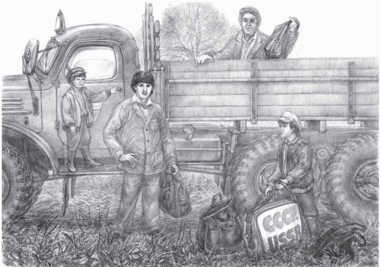
«Приехали из ульянкинского сельмага. Подорожники. (В деревне Чернятина Нижней Кадки, 1987 год)». Из серии «Дороги Нечерноземья».

Рисунок Дениса Александровича Денисова, г. Москва – д. Чернятино, 2016 год