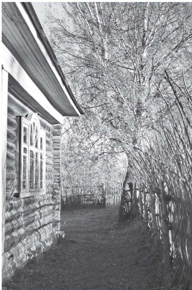
Мартыново. Осенью. 10 октября 2016 года.

11 сентября. День выстоял: целый день солнце! И сразу на глазах стали желтеть бѣрэзы и липы, осины