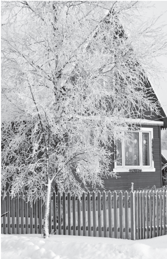
Мартыново. Иней. 16 декабря 2016 года.

4 ноября. Зима, самая настоящая зима! За ночь навалило 4 см снега и ещё подсыпает. В поле 9-10 см. Около 0°C, тихо.