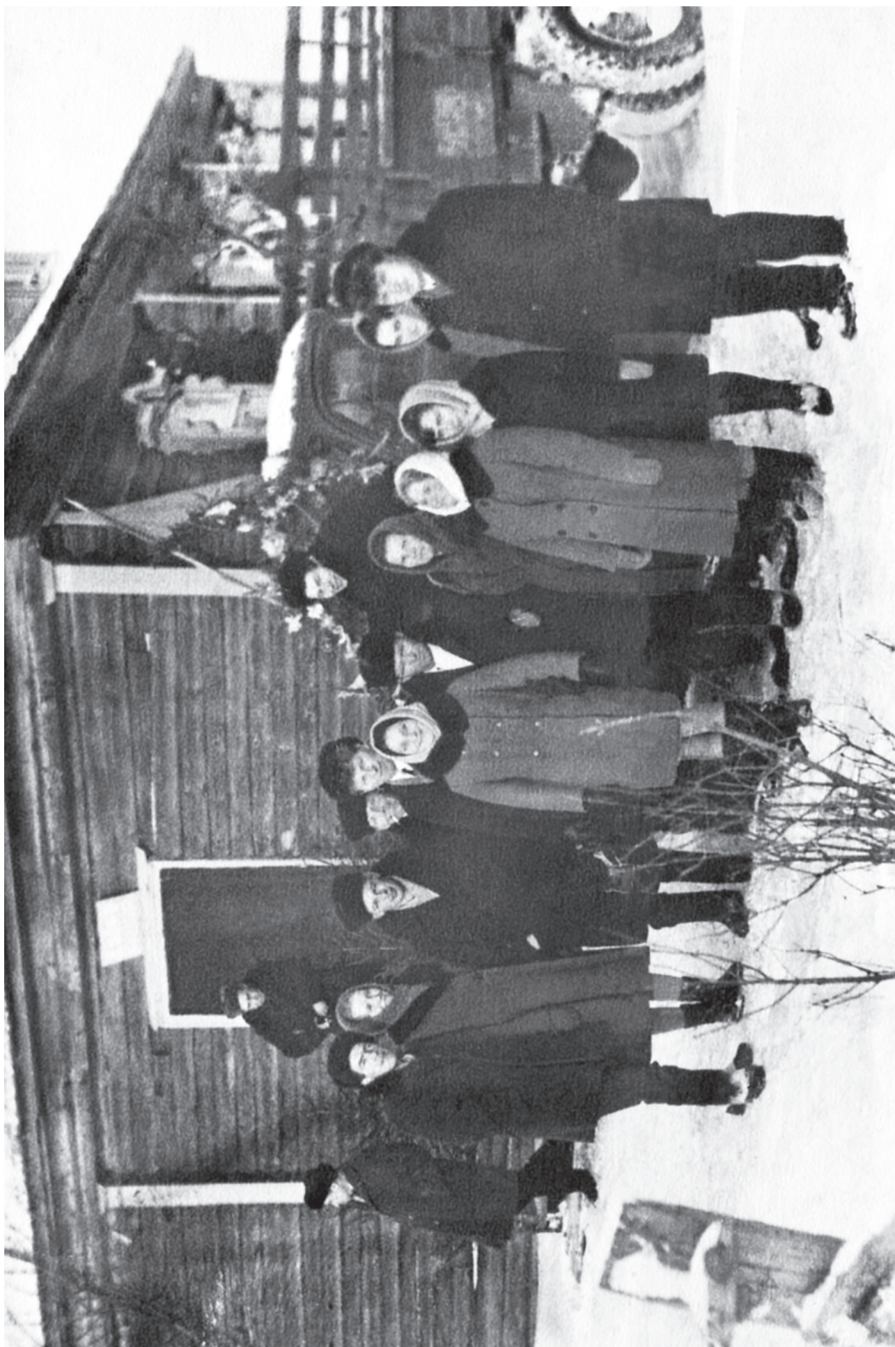
МАРТЫНОВО. НА СВАДЬБЕУ. 20 ноября 1971 года.