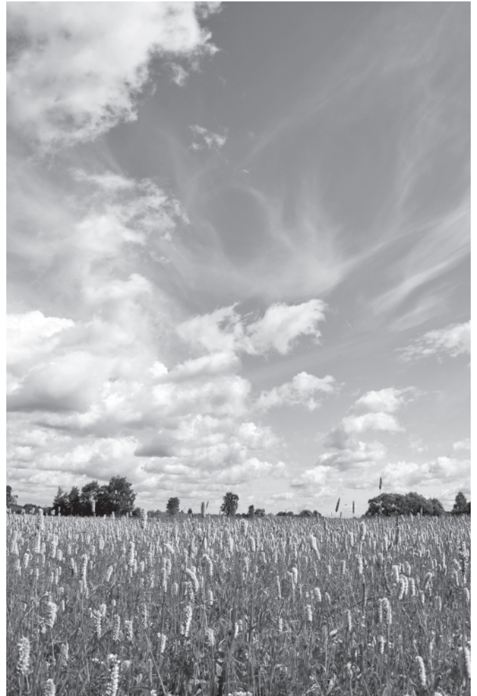
Мартыново. Раковые шейки на огúмнах. 10 июня 2016 года.