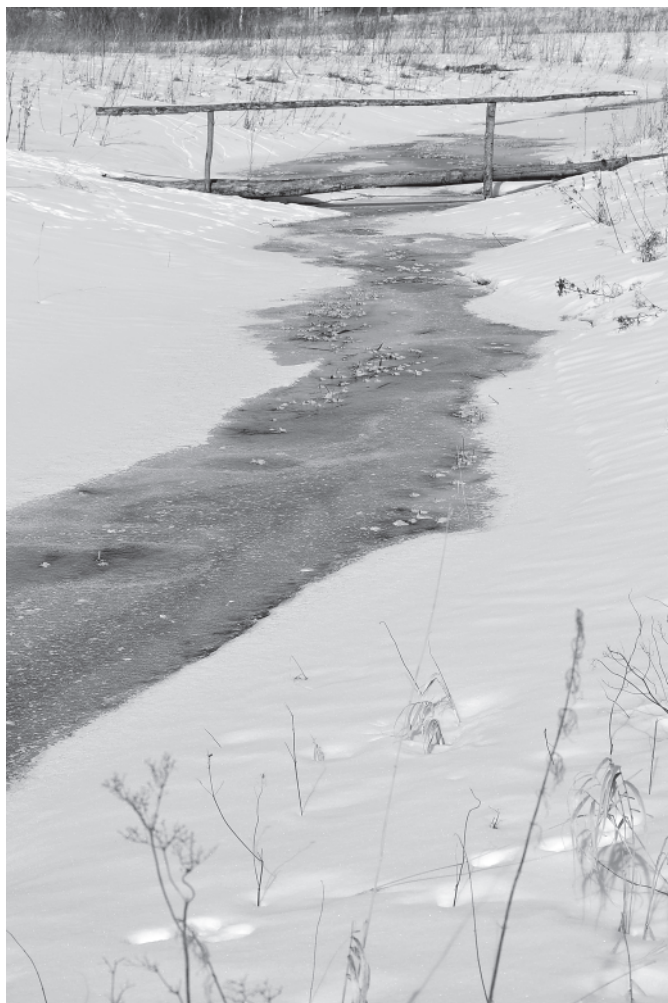
Топорка. Течение застыло. 24 марта 2016 года. Снимок Ирины Александровны Давыдовой, д. Мартыново