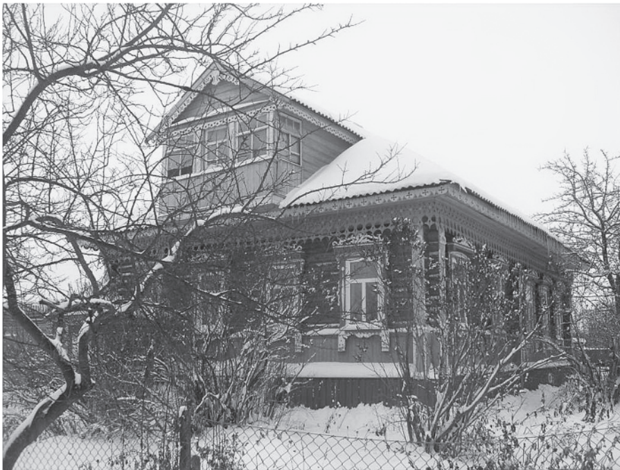
Дом Пименовых (бывший Муравьёвых и Рубановых), д. Глотова, 2016 год.