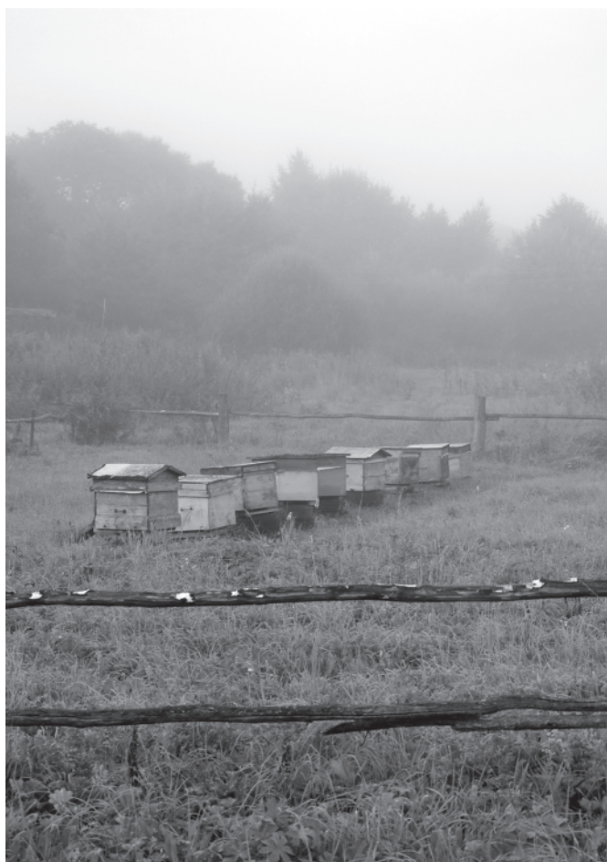
Мартыново. Туманный рассвет. 27 сентября 2015 года.

14 сентября. Летят косяками журавли. Аисты, как обычно, улетели накануне Успенья, но одна пара по-