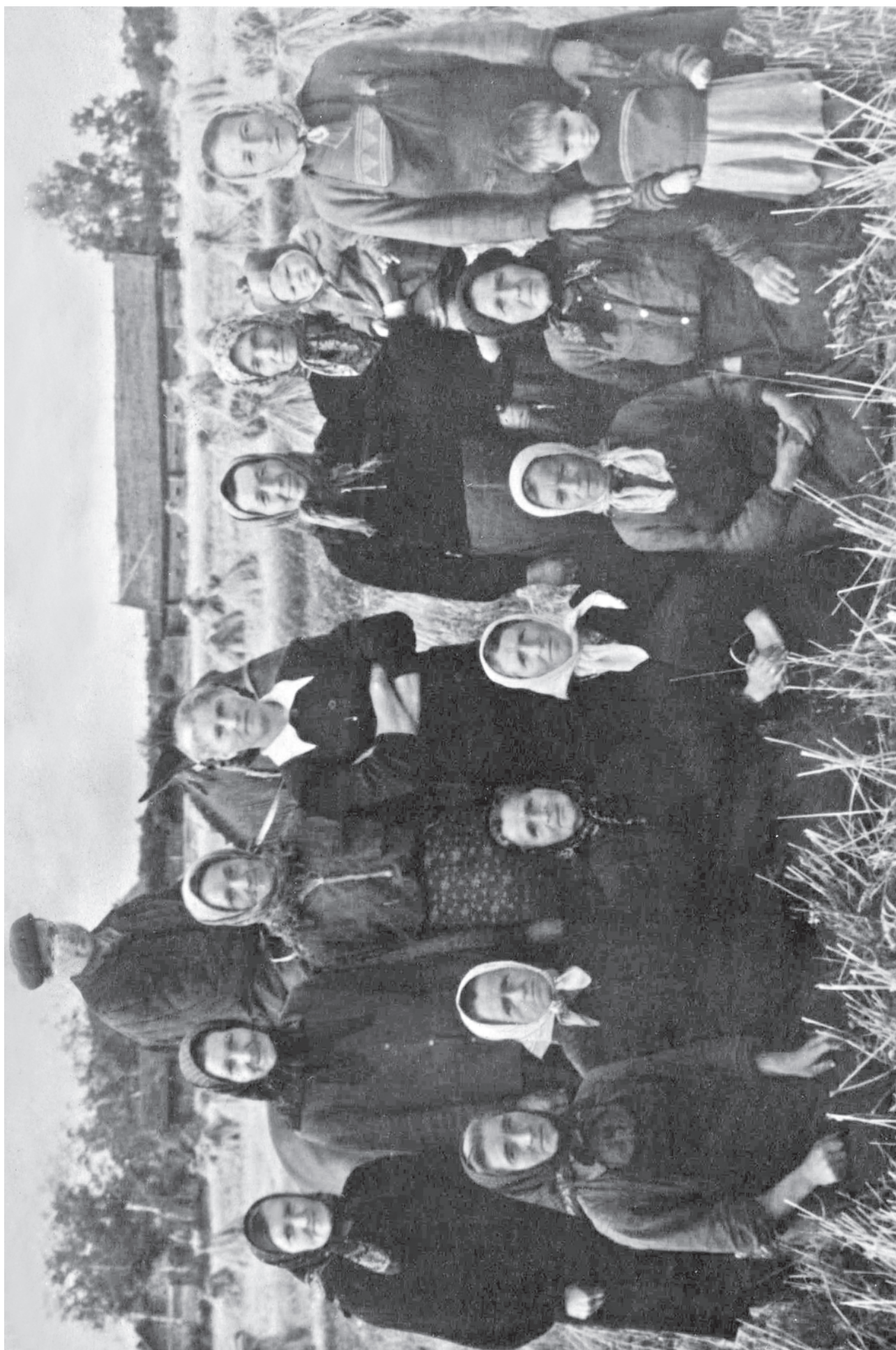
КОБЕЛЁВО. УБОРОЧНАЯ. 1957 год.