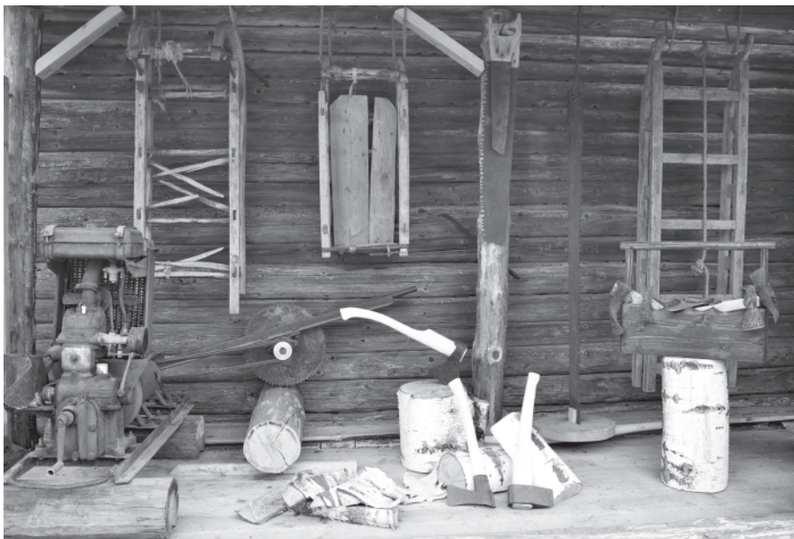
Фрагмент музейной экспозиции «Откуда дровишки?» Слева бензопила, изготовленная мартыновским жителем Виктором Васильевичем Мелёшкиным в 1960-е годы. Снимок С. Темнятина, 2014 год