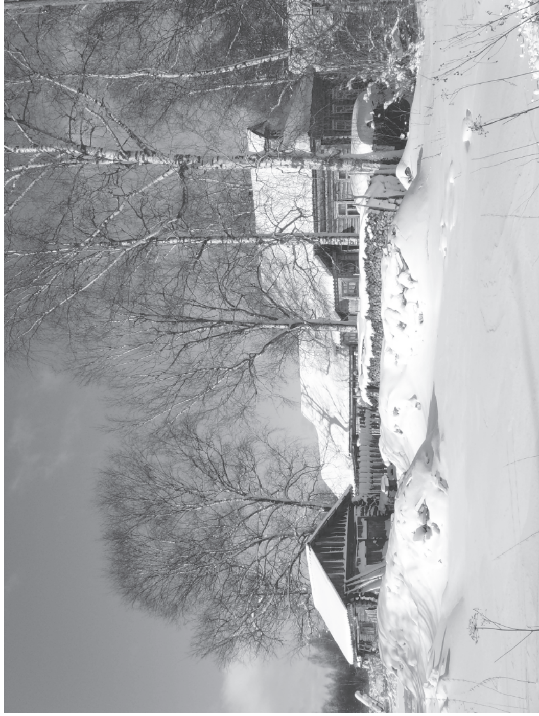
Кадка. Зима. Нефино.