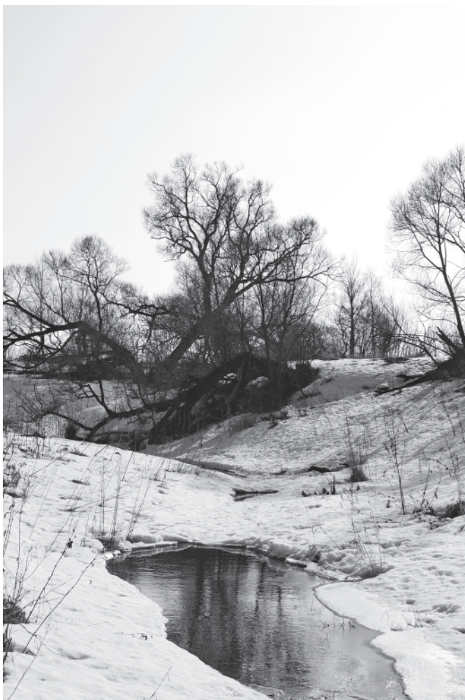
Топорка. Пробуждение. 11 марта 2015 года.

20 марта. Не успели наговориться про недавнее северное сияние, как новое необыкновенное явление – солнечное затмение! Наблюдали его в час – во втором часу дня, солнце походило на серп убывающей луны. А на увале придорожной канавки в Мартынове неожиданно расцвели два растеньица мать-и-мачехи.