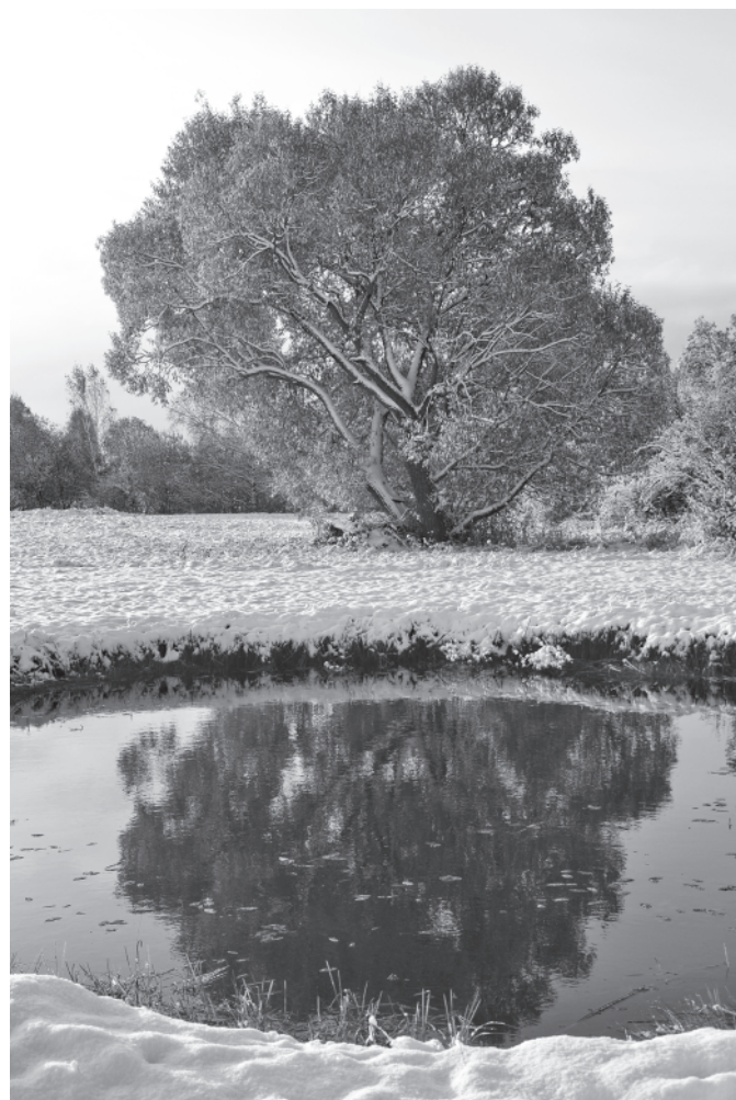
Мартыново. Первый снег. 8 октября 2015 года.

3 ноября. Плюс 8-10°C. Второй день завывает северо-западный ветер 4 метра в секунду с порывами