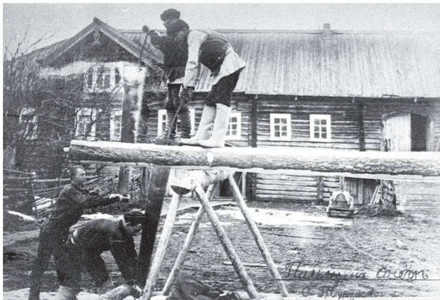
Пиление продольными пилами. с. Турчасово Онежского уезда Архангельской губернии. Начало XX века.

В вездесущем Интернете мы нашли описание того, как распиливали такой пилой брёвна на доски археологи в августе 2001 года. Они решили реконструировать старинное судно и для чистоты эксперимента пользовались только