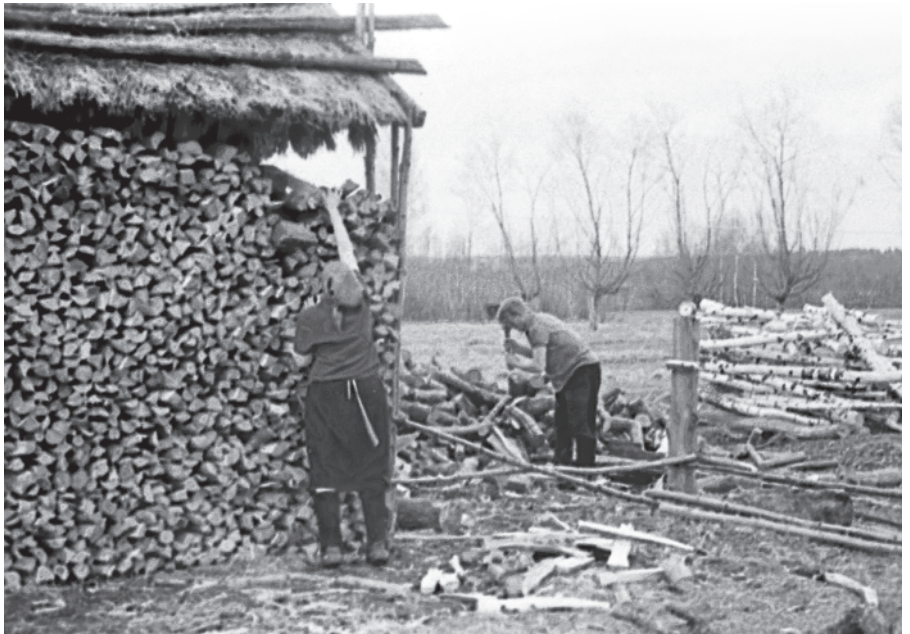
Колка и окладка дров в поленницу. д. Селезенцево, Нижняя Кадка, 1968-1970 годы.

– Кузьнёткой работы топор. Видно, что калёной : раньше голову запаривали, в большой печи калили безгодные топоры. Из углей выхватят, да в шачкю с горя-