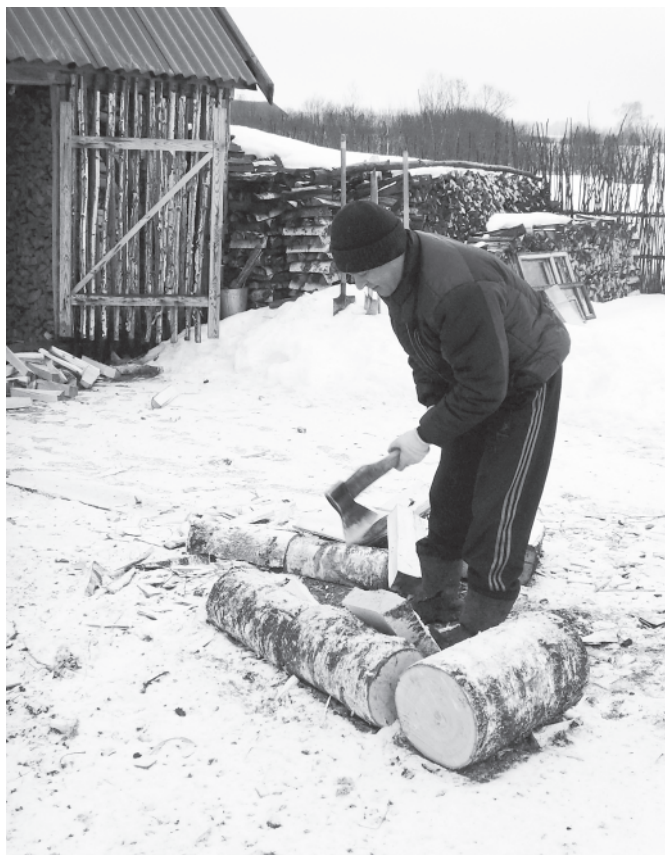
Что есть мочи размахивая топором, дрова колют только го- рожане в фильмах. Деревенские же, экономя силы, легонько тыкают топором...

Но это были планы власти, а дрова нужны всегда и кроме леса их взять негде. Когда власти особо прижимали, брали дрова тайком, рубили в гослесфонде по ночам и тайком вывозили.