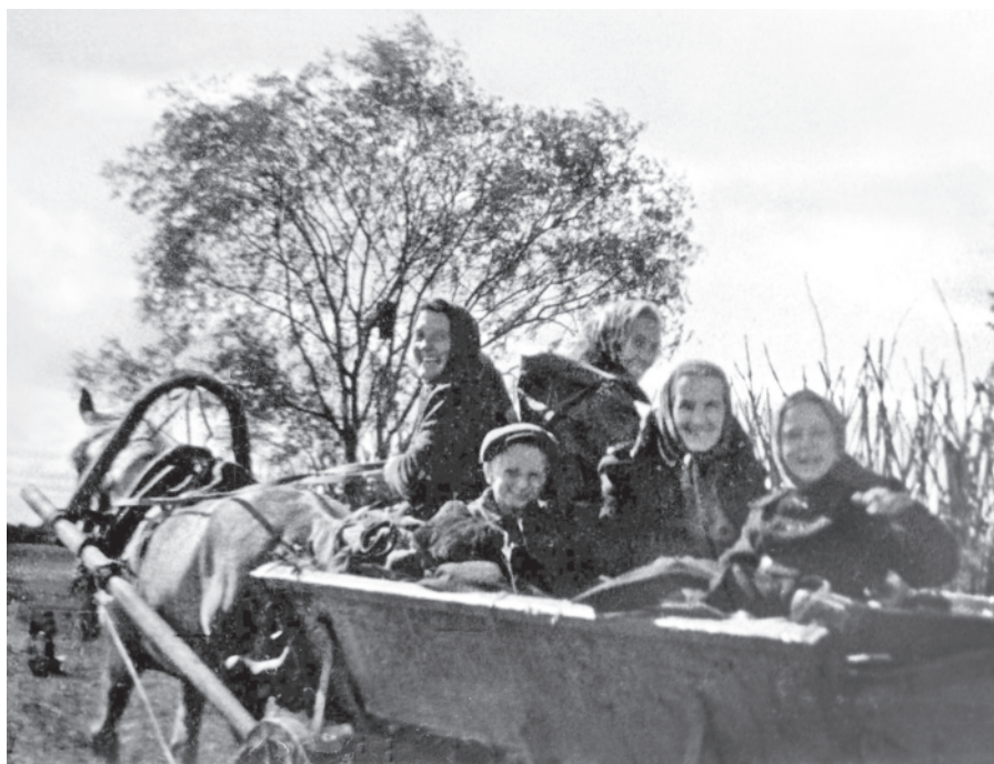
«Питерянцев» везут! (А телега, кстати, называется «грабарка»). д. Киндяково, 1950-е годы.