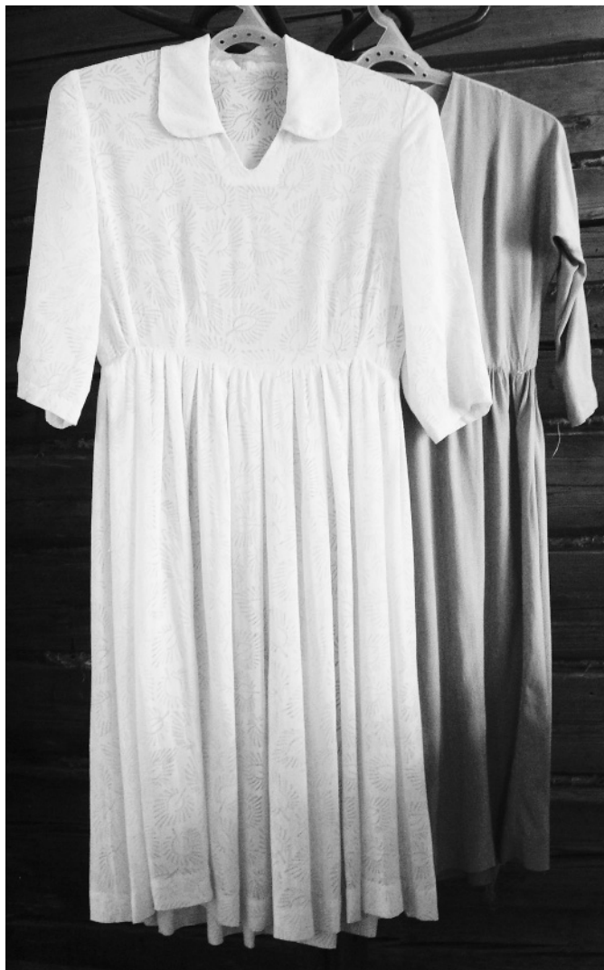
«Платье сваребное с подстёгою» – платье свадебное на чехле – теперь в собрании Этнографического музея кацкарей.