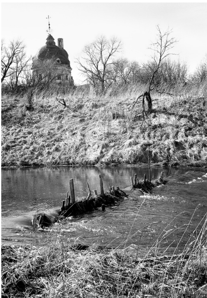
Старый ез на Топорке.

2011 год