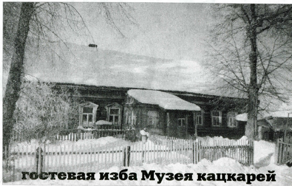
гостевая изба Музея кацкарей