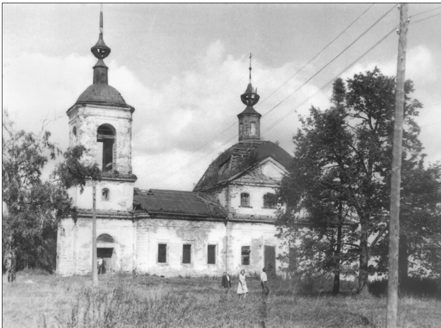
Усадьба Знаменское. Каменная церковь Знамения Божией Матери, построенная в 1784 году Николаем Андреевичем Тютчевым – дедом великого поэта Ф.И. Тютчева. Фото Виктора Ивановича Ерохина (г. Углич), 1985 год.

Но вернёмся к статистике. Какие предметы и в каком количестве преподавались в Знаменском училище? В младшем отделении: Закон Божий – 2 часа, церковно-славянское чтение – 3 часа, русское чтение и письмо – 11 часов, арифметика – 6 часов, чистописание – 2 часа в неделю. В среднем отделении: Закон Божий – 2 часа, церковно-славянское