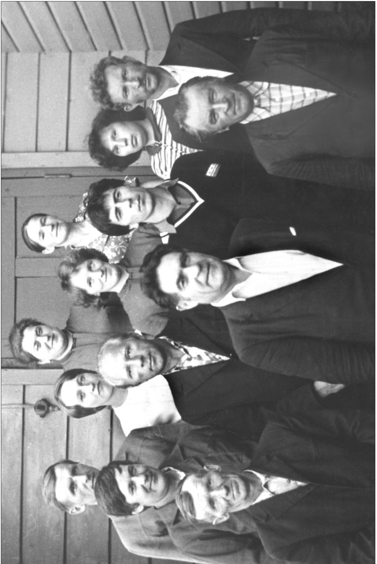
ОРДИНО. КОНТОРСКИЕ. 29 июля 1983 года.