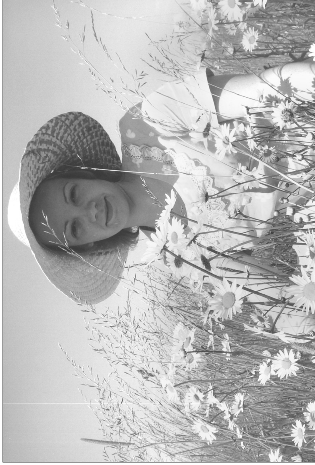
Кадка. Лето. Юрьевское.

Снимок Лидии Ивановны Чураковой, 2008 год