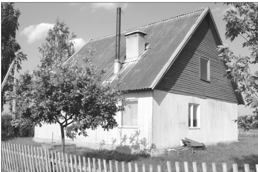
Ординский ФАП расположен в новом посёлке Воронцово.