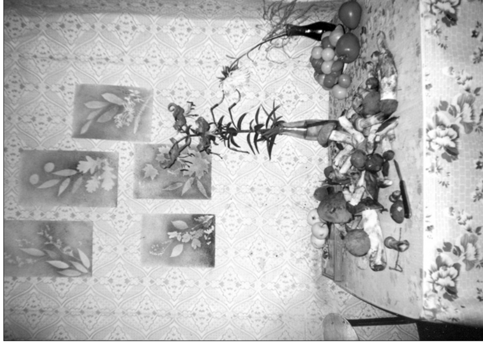
Натюрморт с подосиновиками. 20 августа 2003 года