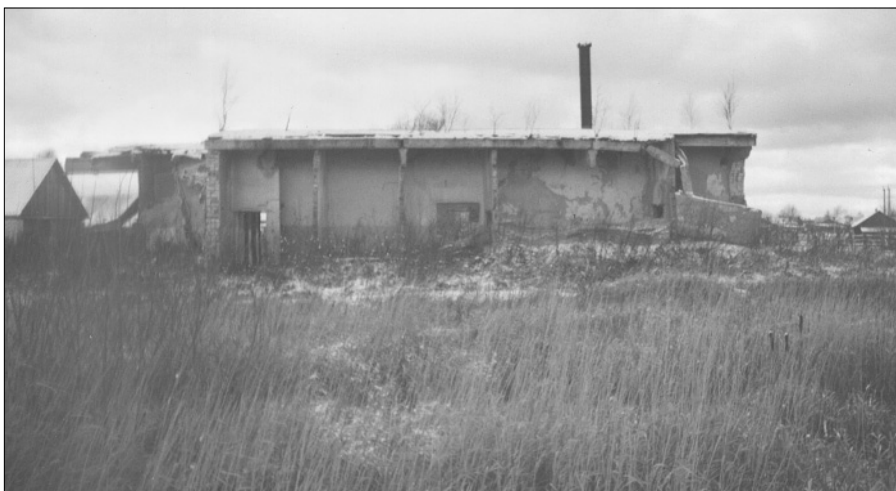
Развалины пекарни, строилась в 1966-1967 годах.