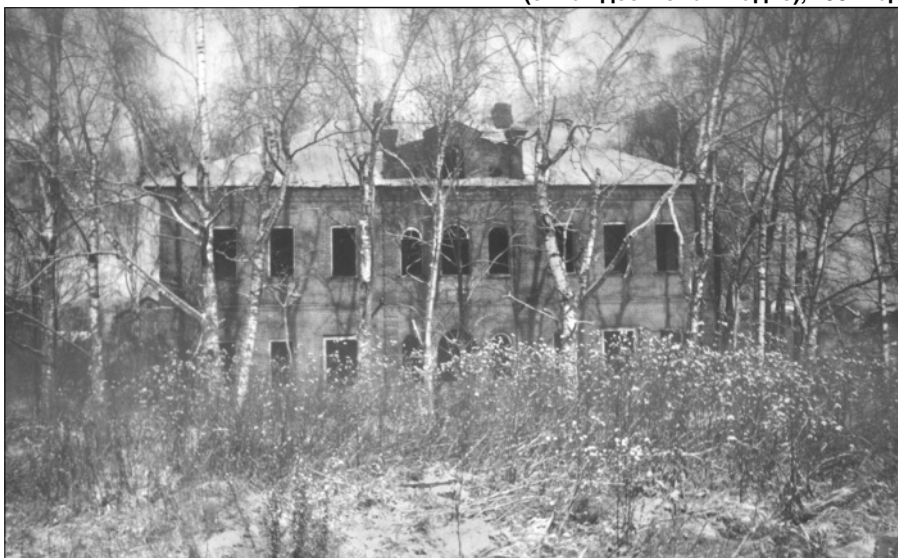
Старое школьное здание, строилось в 1913-1933 годах.

(с. Рождествено в Кадке), 2007 год