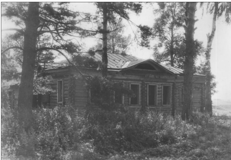
Вид на дом господ Тютчевых со стороны церкви – здание, по преданию, построенное ещё на рубеже XVIII-XIX веков. Именно в нём и располагалась в советское время Знаменская начальная школа. 1985 год.