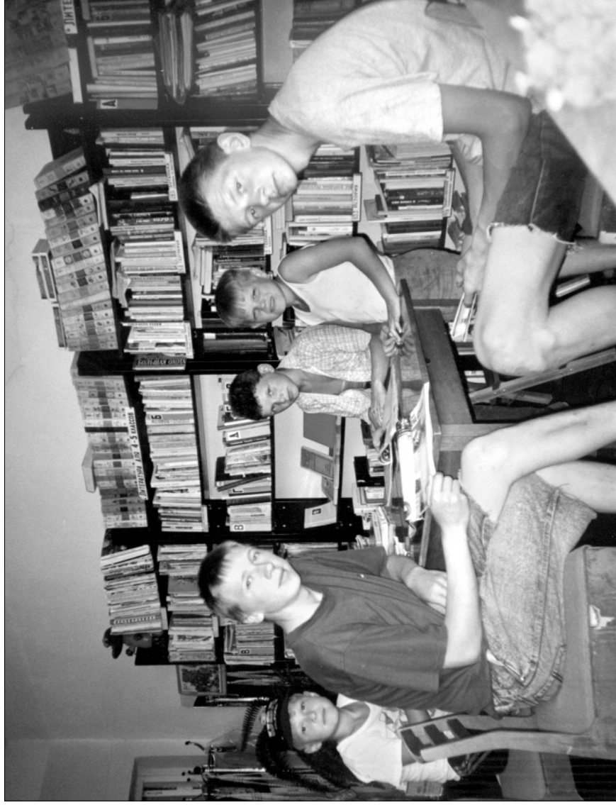
В Мартыновской библиотеке всегда многолюдно. 1998 год