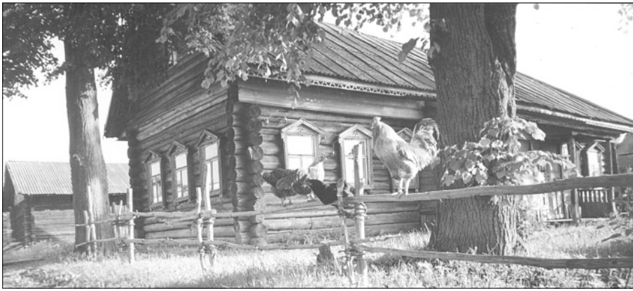
Лето в Этнографическом музее кацкарей.

Снимок С.Н. Темняткина (д. Мартыново), 2005 год