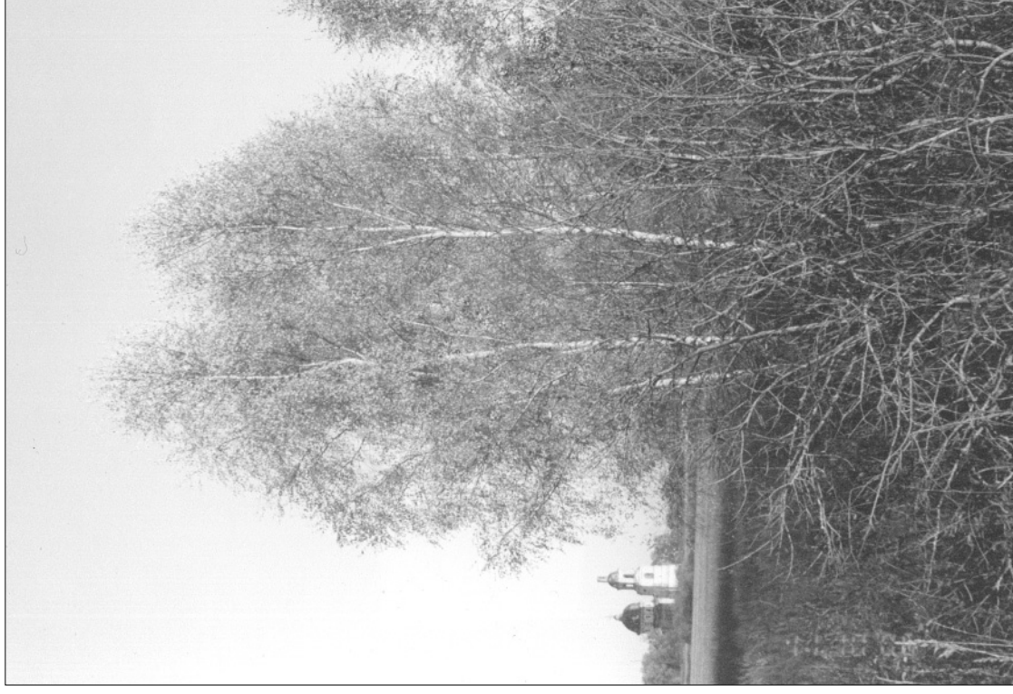
Вид на Николо-Топор из Поджручъя (возле Хороброва). 2006 год