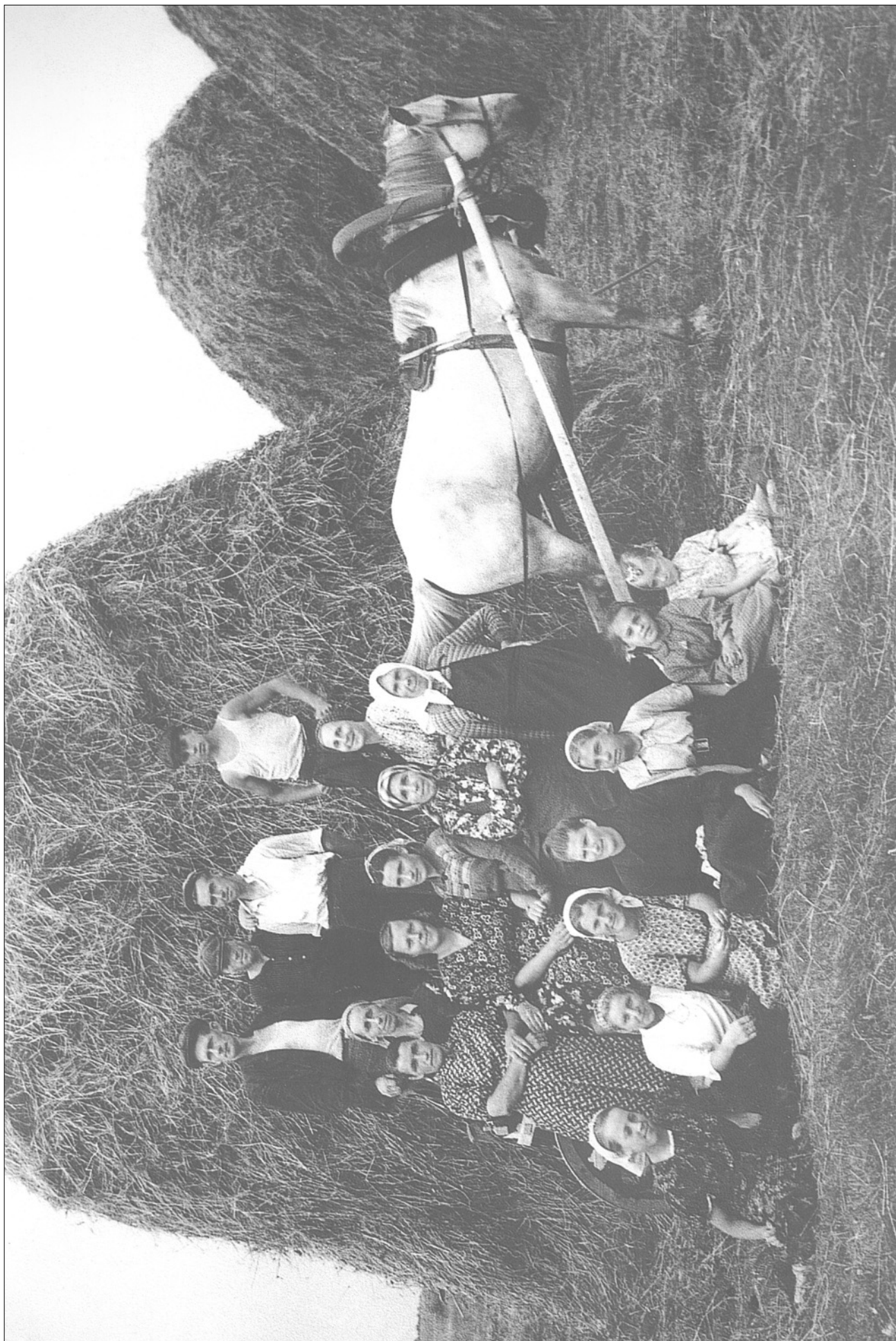
ЮРЬЕВСКОЕ. У ОМЁТОВ. 1956-57 годы.