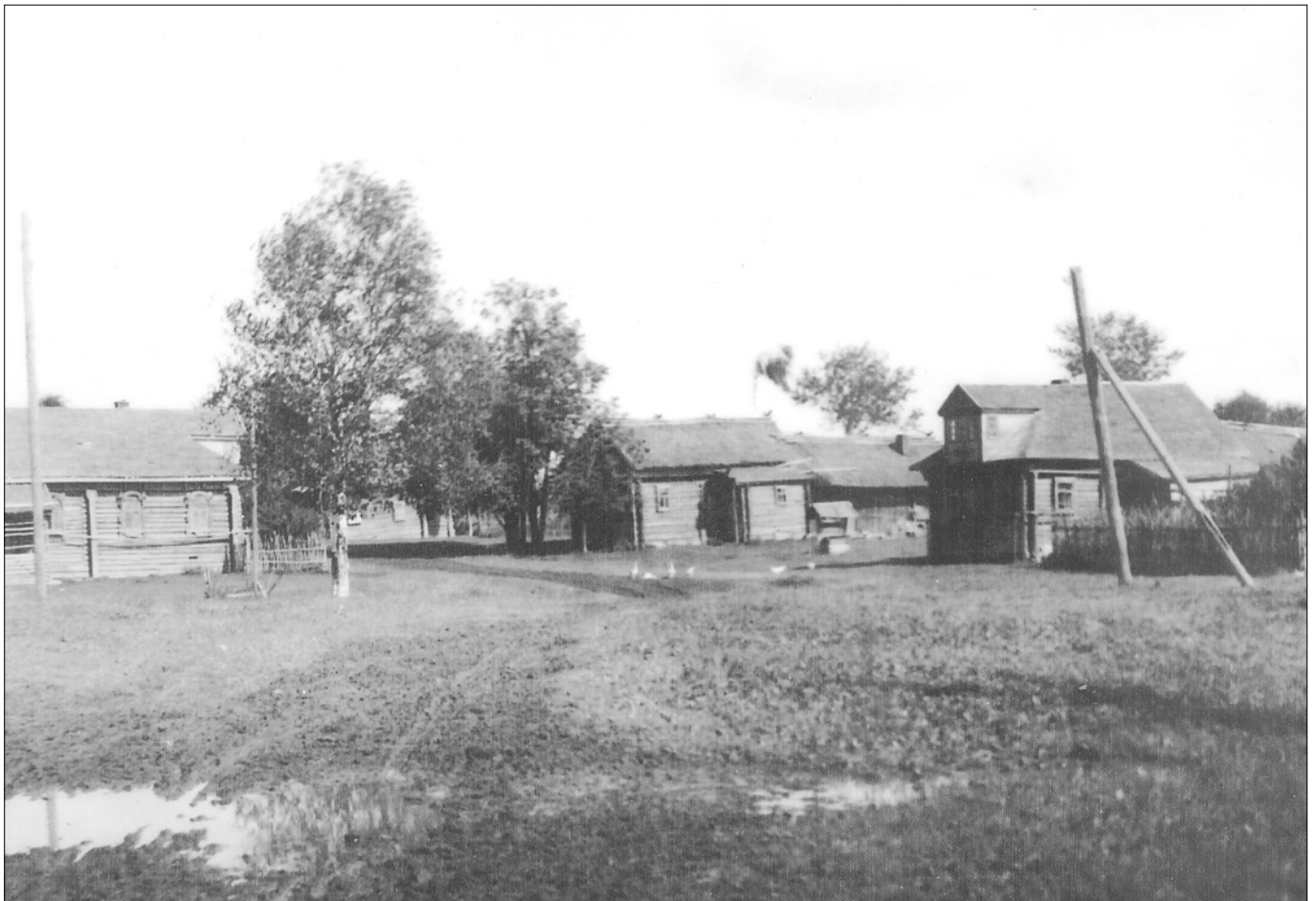
Деревня Воронцово. На обороте фотографии надпись: «1952 г. Август. д. Воронцово. Вид от Трухина».

Это было днём, но я добрался до кровати в большой половине, положил на подушку сандалии и зас-