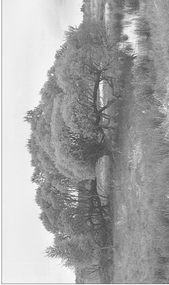
Старые ветлы над речкой над Манкой — вот и всё, что осталось от бывлой деревни Платуновские Харчевни. 2005 год