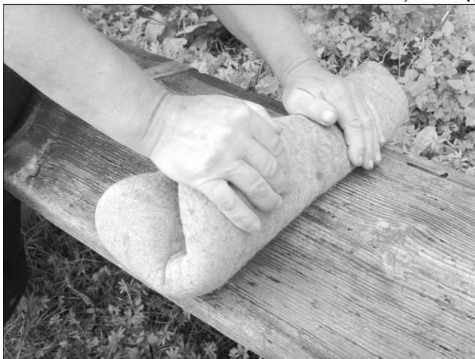
А так – на плаща.