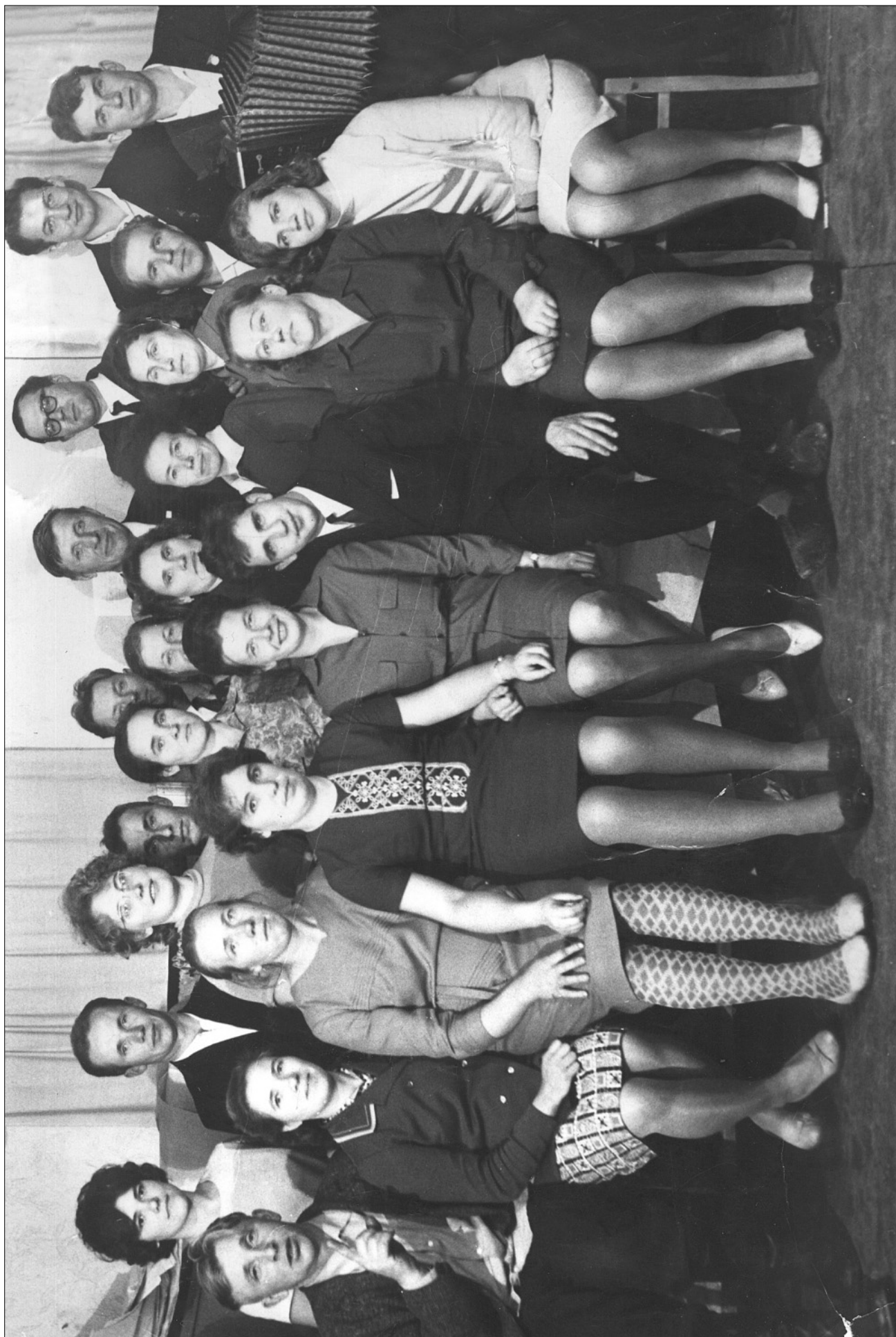
КОЛОГРИВЦЕВО. КОНТОРСКИЕ. Осень 1968 года.