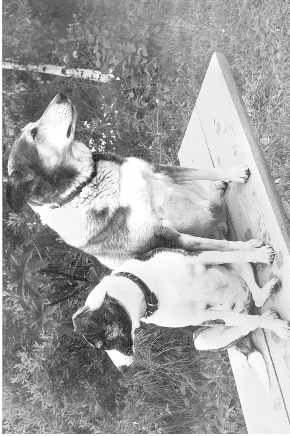
Кадка. Лето. Юрьевское.

2006 год