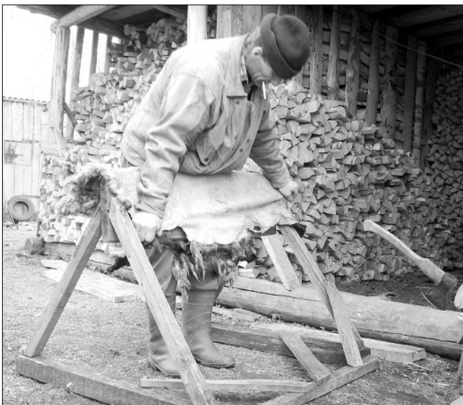
А так тянут овчину на потажном станке.