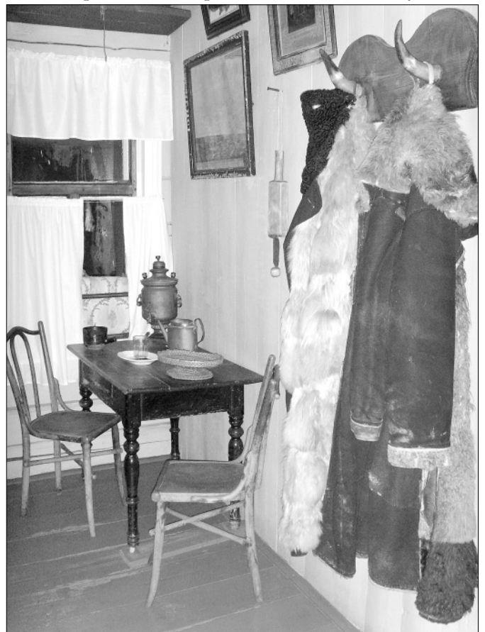
Фрагмент экспозиции Этнографического музея кацкарей в кути.

Учёные видят в этих странных на первый взгляд действиях отголосок той далёкой старины, когда люди верили в своё родство с каким-нибудь жи-