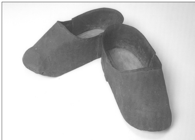
Железные галоши – гамашш – из собрания Музея кацкарей.