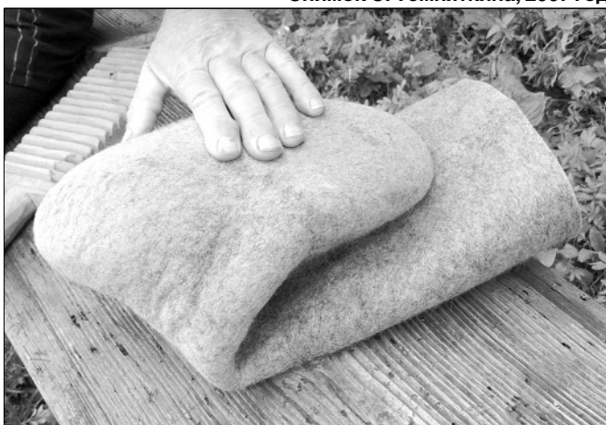
Так заворачивали чосанок на козла.