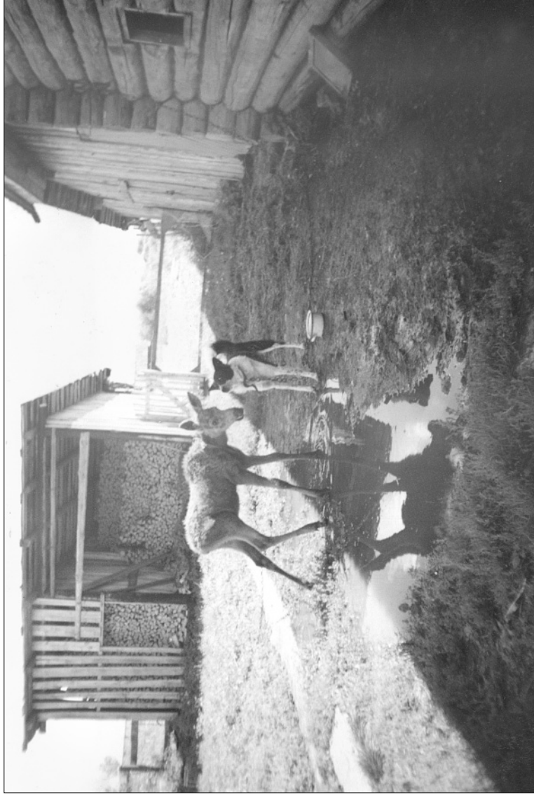
Два друга: лосёнок Стрижка и пёс Мухтар. 2003 год