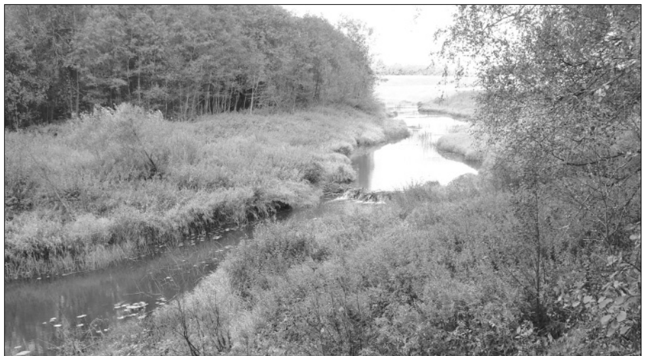
Здесь проходила линия обороны: слева лес Пальцево, справа мякишевский берег Кадки. Река Кадка у впадения в неё Татарки, 8 сентября 2007 года.