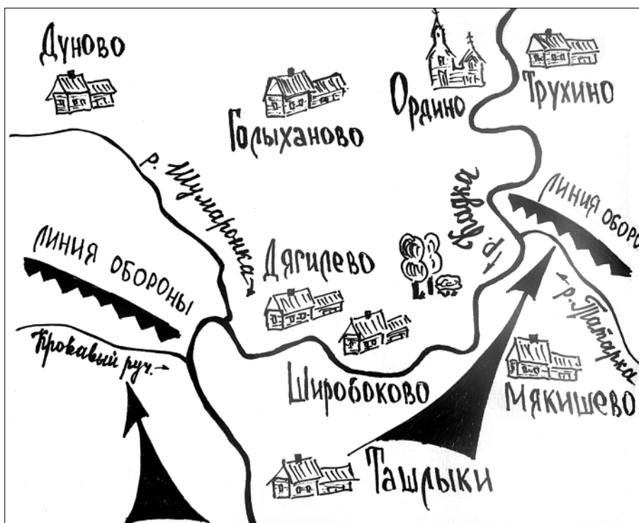
План предполагаемого сражения с монголо-татарами в Нижней Кадке на рубеже «Кровавый ручей – Кадка – Татарка».