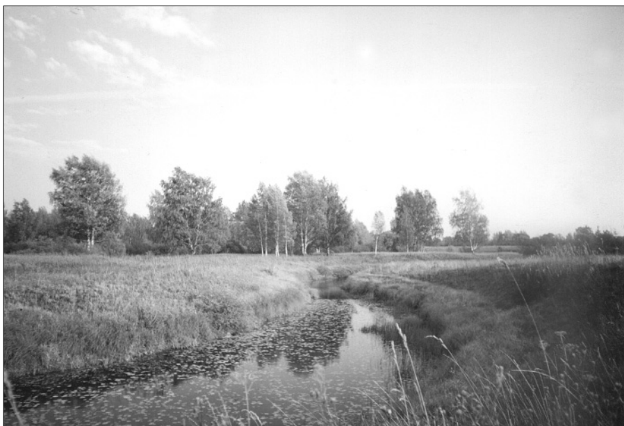
Река Кадка у Юрьевского. 24 сентября 1999 года.

Тут приезжают в Юрьевское Первовы. Они купили красивый дом с резными наличниками че-