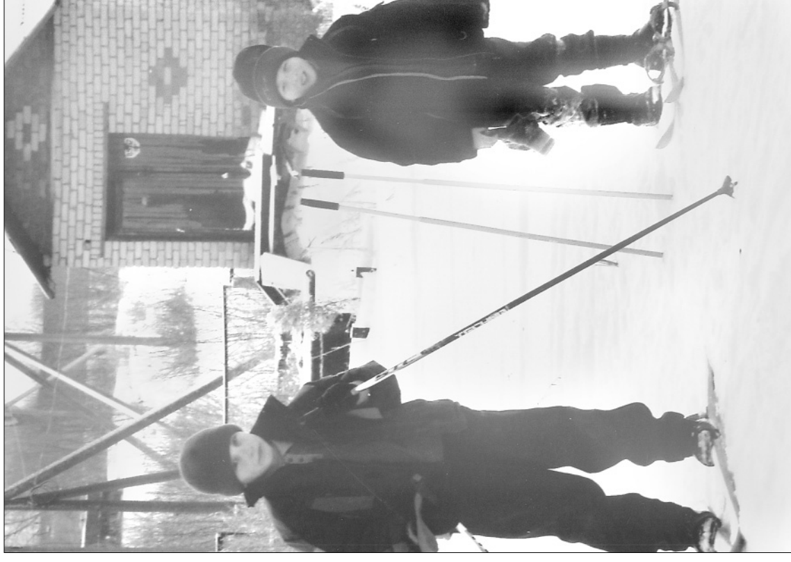
Хорошо зимой-то! 2008 год