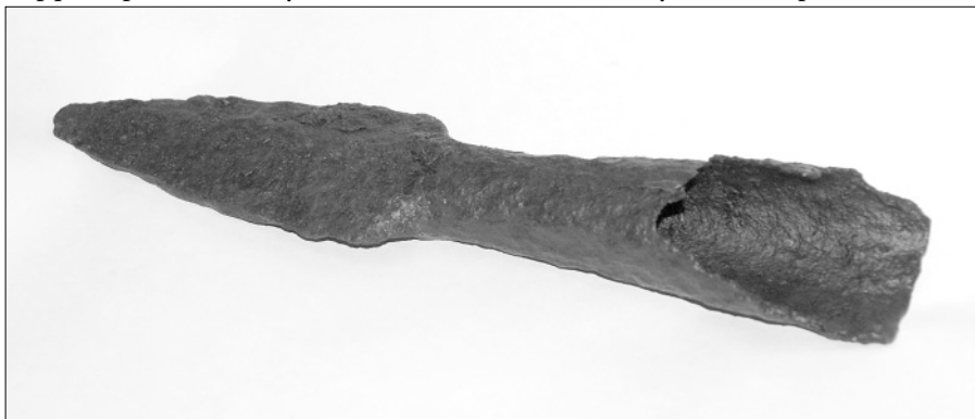
А вот и «живой» свидетель татаро-монгольского нашествия – копьё XIII-XIV веков, найденное на реке Кадке возле деревни Владышина.

Из собрания Этнографического музея кацкарей. Снимок Анны Ясинской, 2007 год