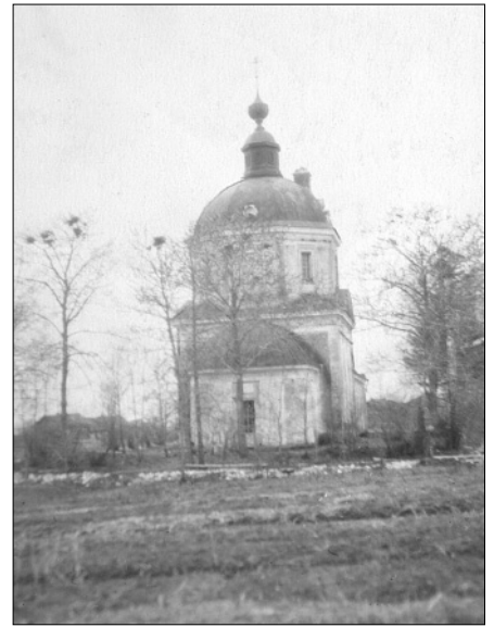
Георгиевский храм в селе Юрьевском перед сносом. Вторая половина 1950-х годов.

Он улыбается, гладит меня своей рукой по голове и мне тоже говорит: