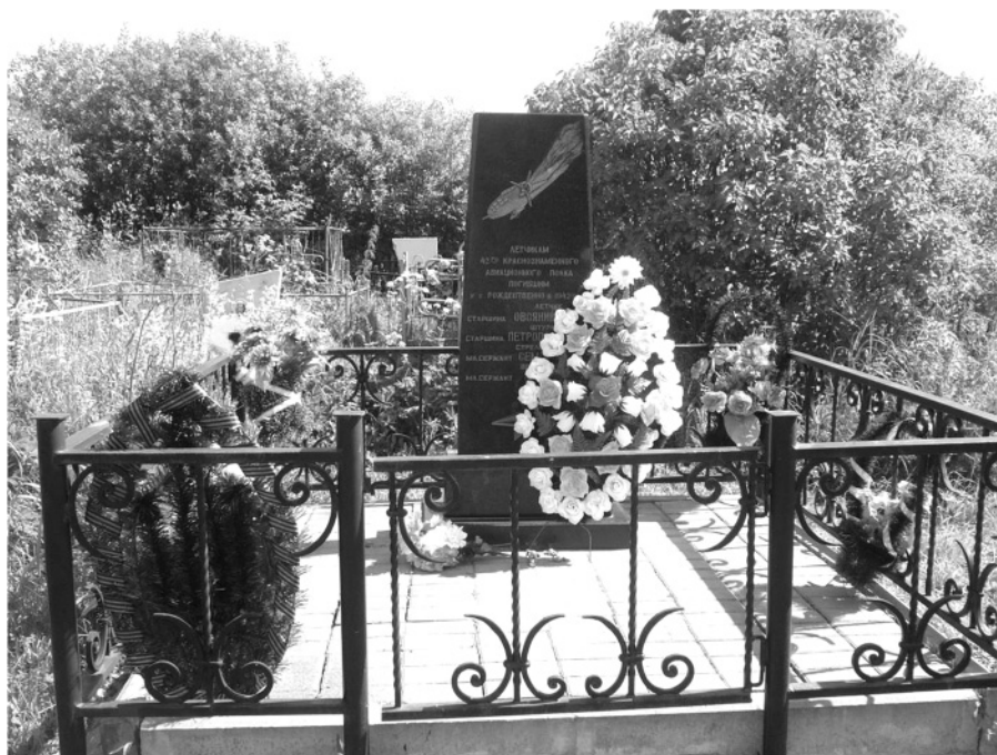
Братская могила лётчиков, разбившихся в ночь на 11 декабря у деревни Нинорова, на Рождественско-Кацком кладбище. 2013 год.

На нашем кладбище мирная тишина. Шепчутся липы, тихо шумят берёзки, птицы щебечут на разные голоса, словно рассказывают нашим солдатам о том, что в их семьях уже есть правнуки, что их племянникам давно за шестьдесят, но