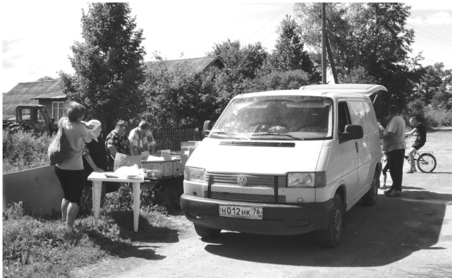
Из современной жизни Платуновского края: автолавка примаскаляла!