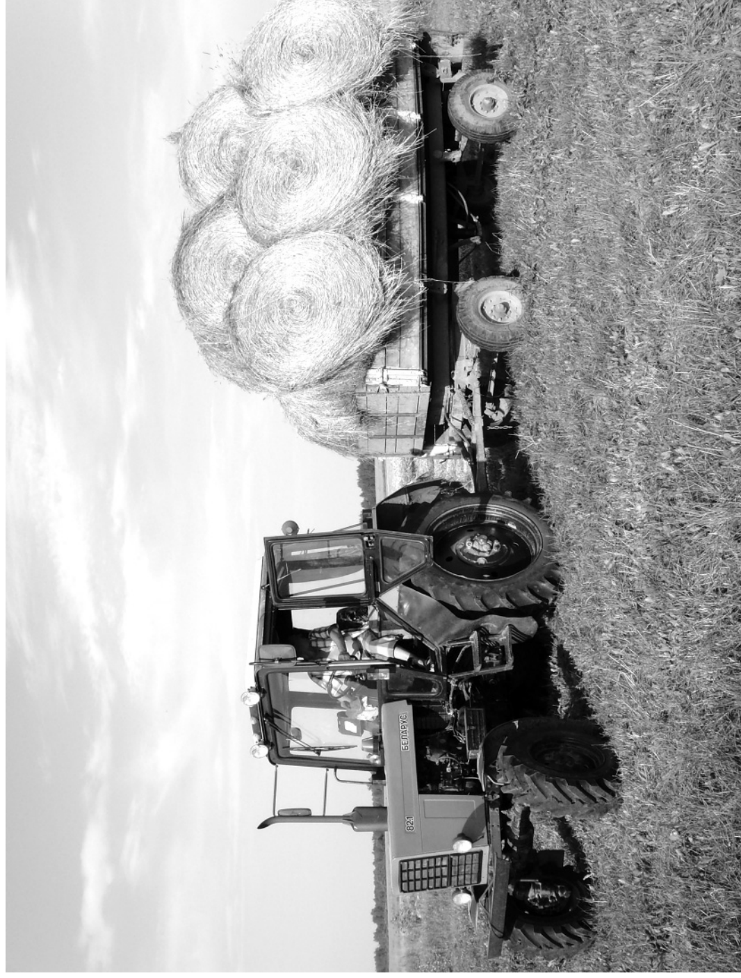
Кадка. Лето. Мартыново.