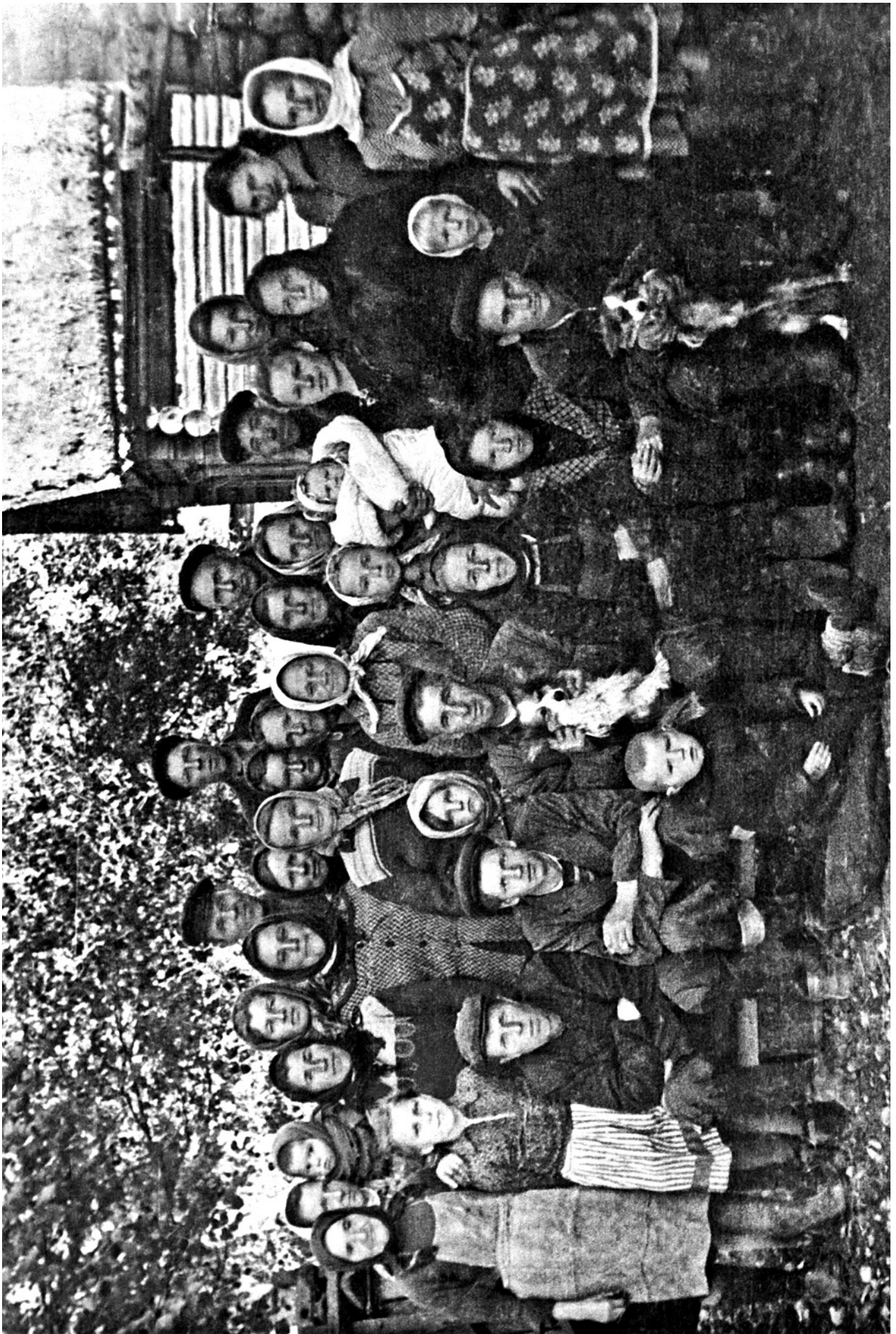
ПЕРЕМОШЬЕ. «ОННОДЕРЕВЕНЦЫ». 1957 год.