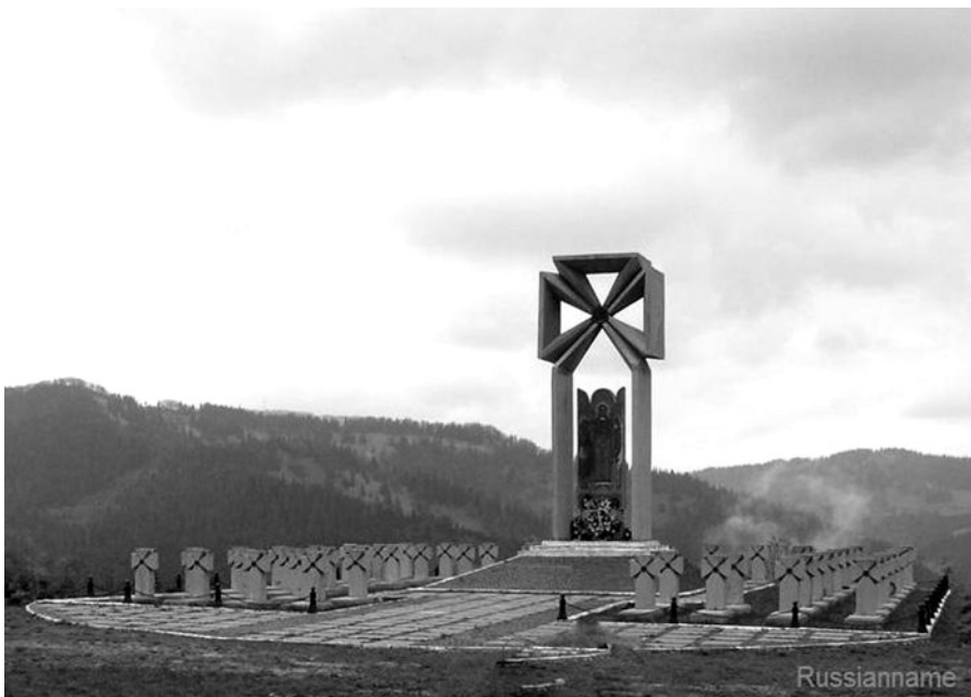
На той самой горе Маковке в Карпатах в память о своих погибших украинцы возвели мемориал. Россияне о своих потерях в Первой мировой войне, похоже, и не вспоминают.