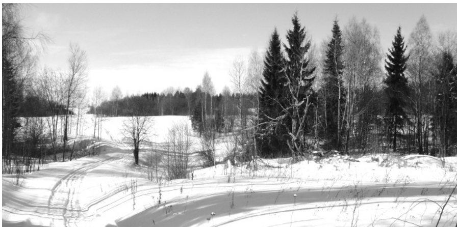
Зимняя дорога в Нижней Кадке; в заливке протекает речка Берёзовка.

Юрий Владимирович Курдюков, Угличский государственный историко-архитектурный и художественный музей