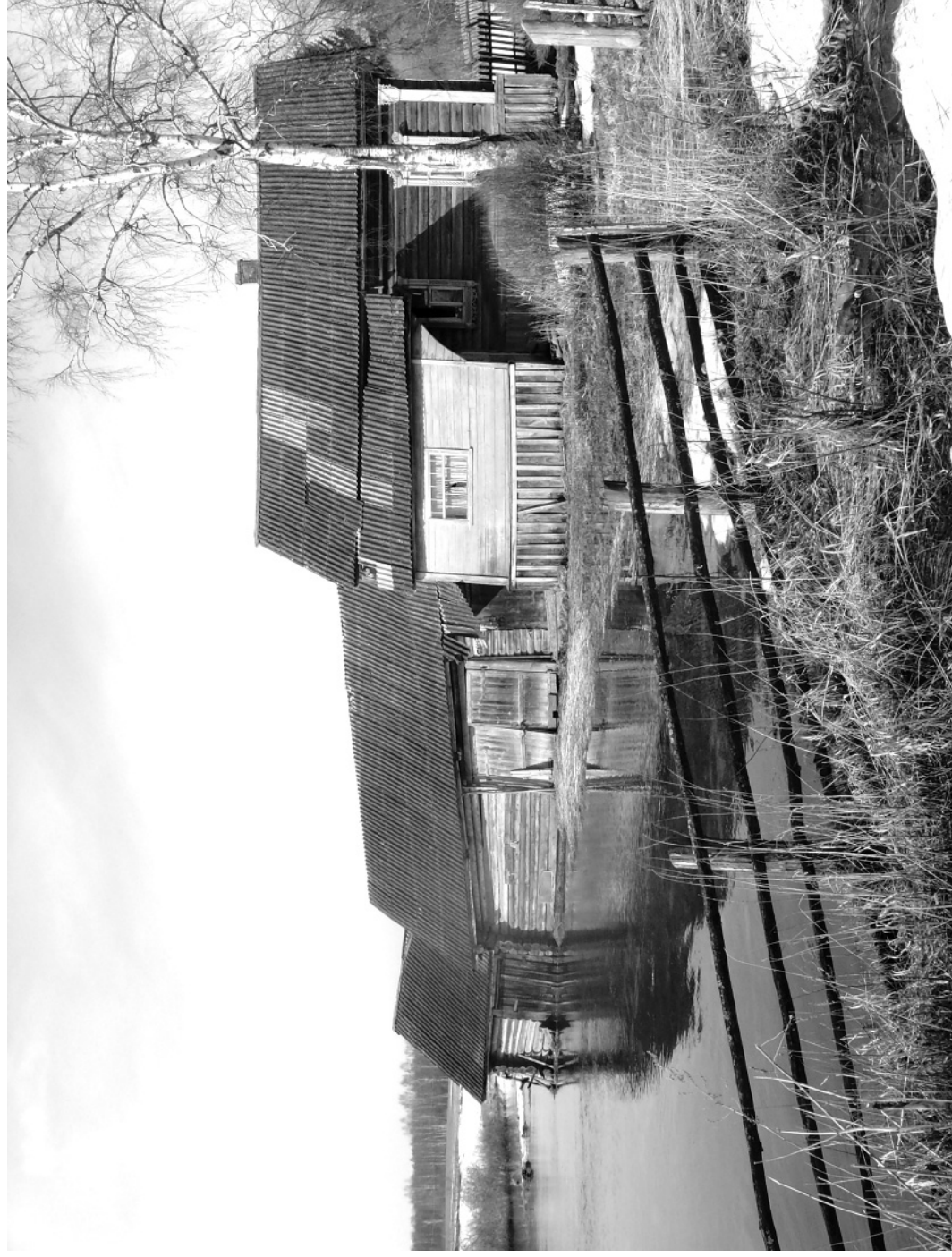
Кадка. Весна. Платуново.