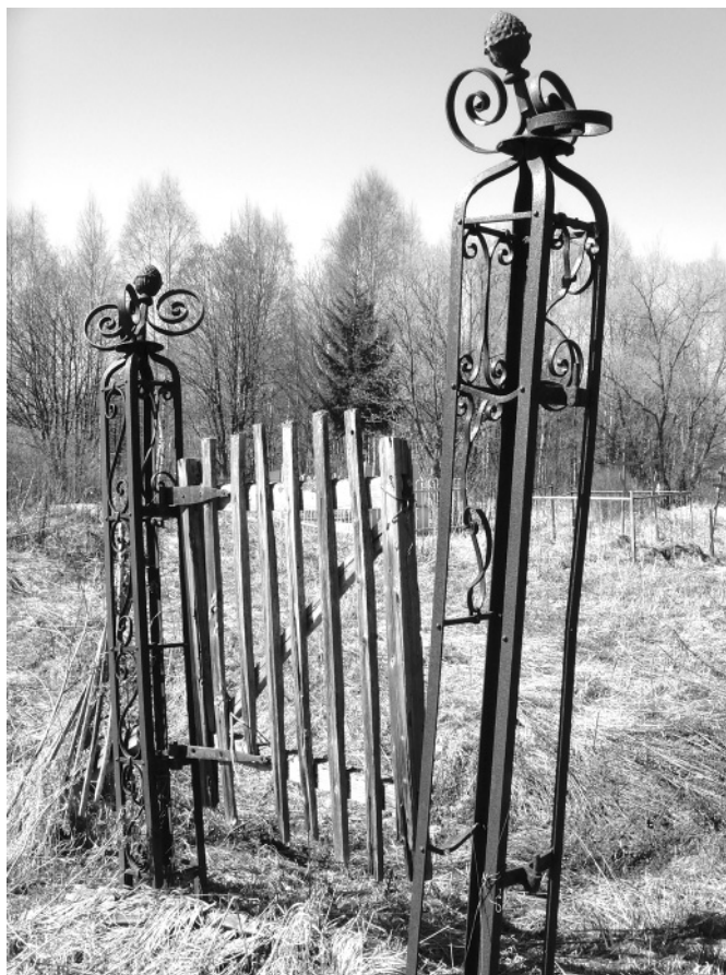
Кованые веретви Хоробровского кладбища нет-нет, да и вспомнят монастырские времена...

Великий князь Василий III не забыл своё обещание. 13 мая 1524 года была основана «Велия обитель Пречистой Богородицы Одигитрии» – Новый монастырь на Девичьем поле