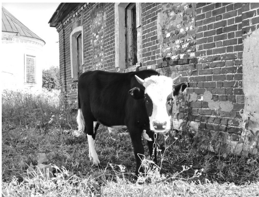
Бычок-годовичок у церковной сторожки в Ордине.