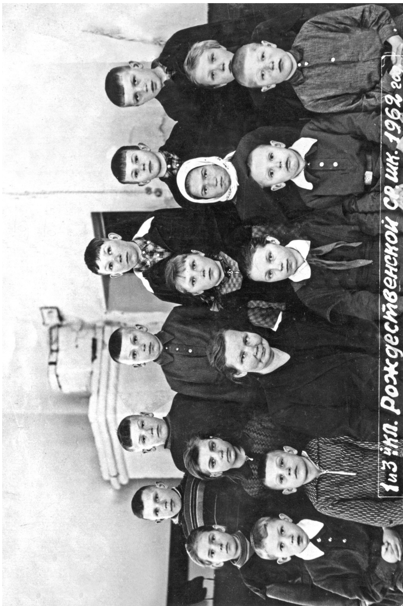
РОЖДЕСТВЕНО. УЧЕНИКИ. 1962 год.