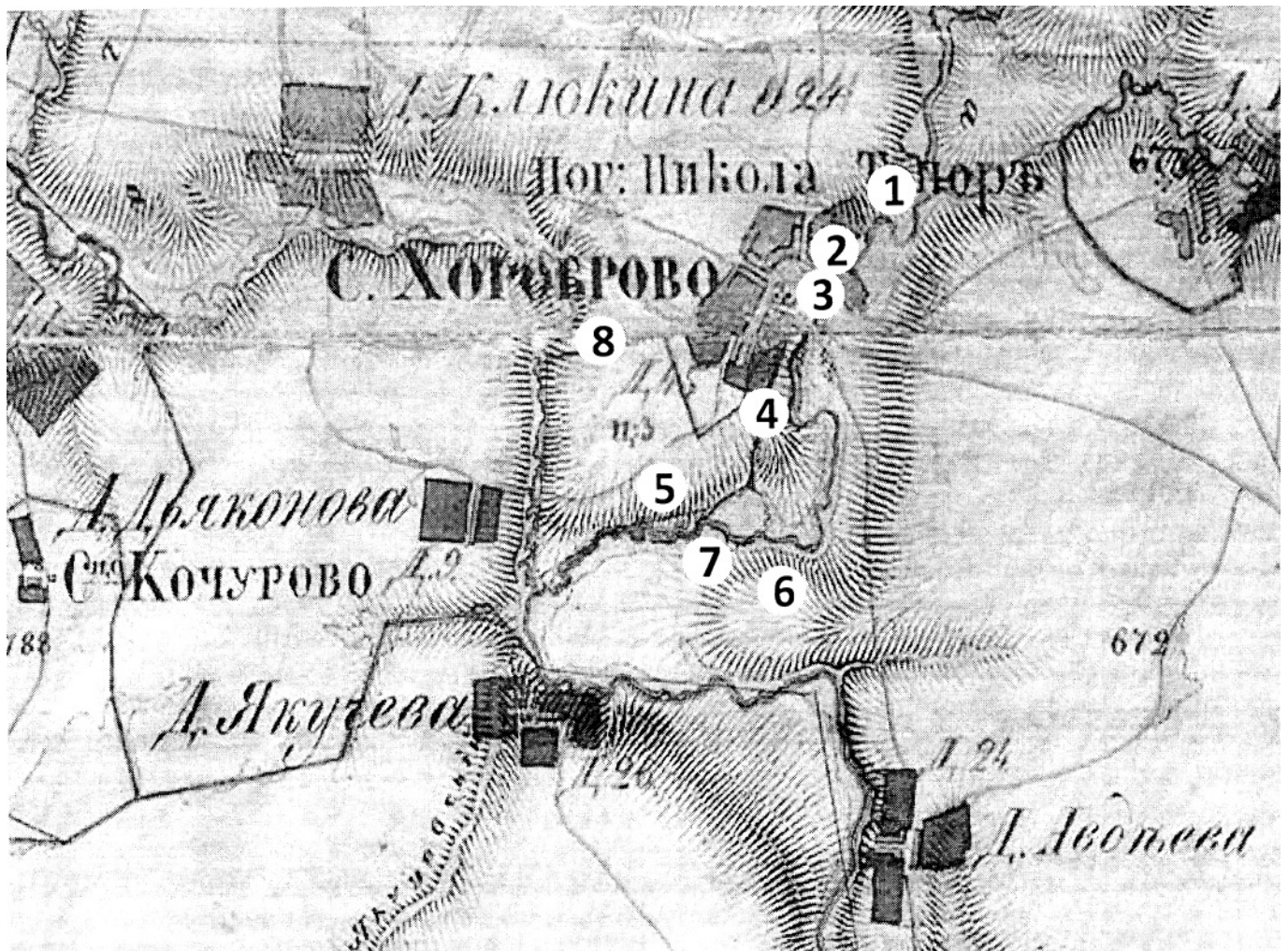
Хоробровские горы: 1 – Круча, 2 – Кокуйка, 3 – Иванова гора, 4 – Поповка, 5 – Вшивая горка, 6 – Слабутина, 7 – Стрижовы горы, 8 – Красная горка. Согласитесь, а ведь в обычае называть высокие берега рек горами есть тоже что-то византийское...

Схема выполнена на основе карты Александра Ивановича Менде, 1855-1857 годы