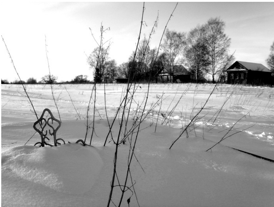
Могильный крест на сельской площади Крест.

Один из самых крупных монастырей Панагии Одигон, численностью 30 сестёр, находился в Константинополе при храме Одигон, о котором мы рассказывали в самом начале. Думаю, здесь необходимо осветить одну интересней-