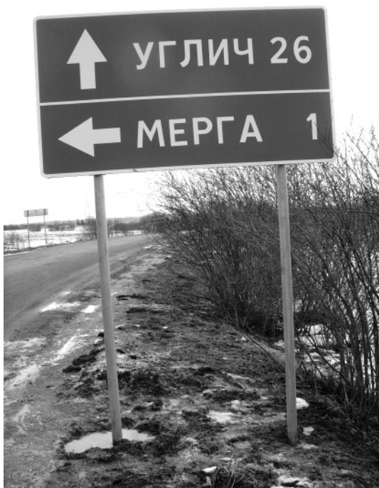
От Рождествена до Углича дорожники обещают 26 километров. А в действительности все 40, если не застрянешь или не заблудишься...