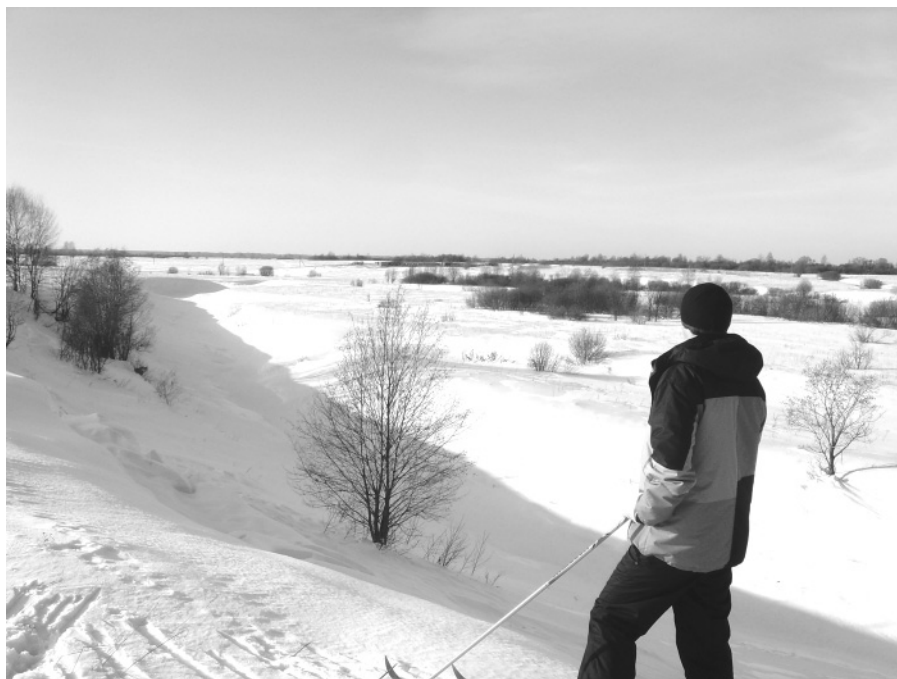
Вид с горы Слабутины на кацкие поречины.

И то, что местные жители побавивались этой горки – тоже понятно. На святом месте, по церковному преданию, незримо всегда присутствует ангел, охраняя и защищая